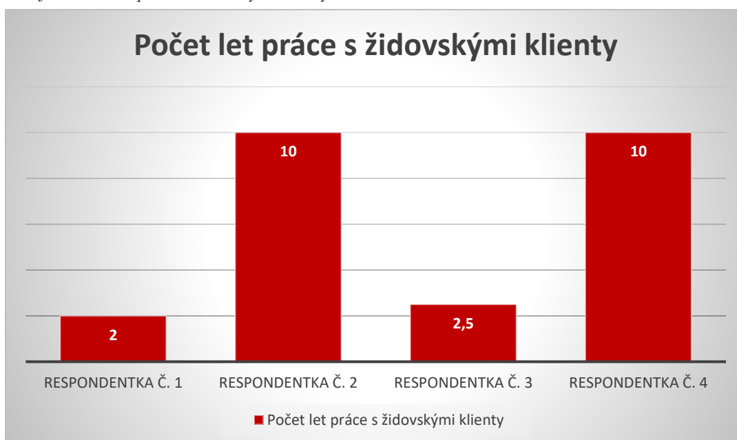
Graf 2 Počet let práce s židovskými klienty

Největší zkušenosti s prací jako ergoterapeutka se židovskými klienty má respondentka č. 2. a č. 4 (10 let). Naopak nejkratší dobu s klienty pracovaly respondentky č.3 (2,5 roku) a respondentka č. 1 (2 roky).