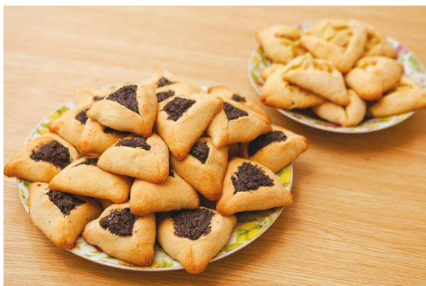
Obrázek 5: Hamanovy uši