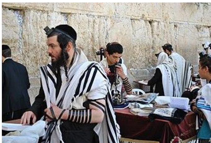
Obrázek 6: Modlení v typickém židovském oděvu talit u Zdi nářků