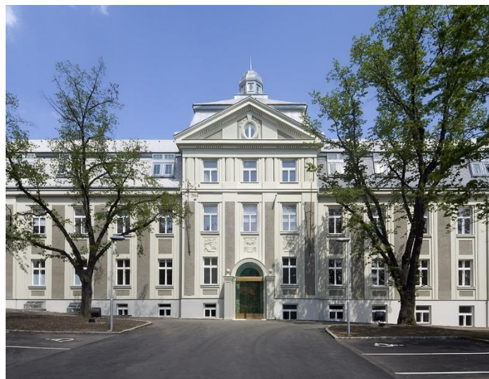
Obrázek 9: DSP Hagibor, hlavní budova