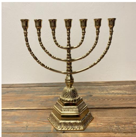
Obrázek 1: Menora