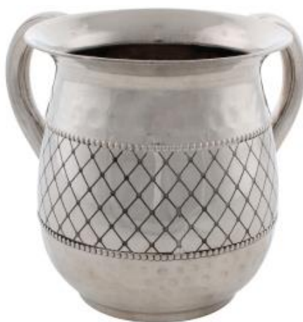
Obrázek 4: Natla