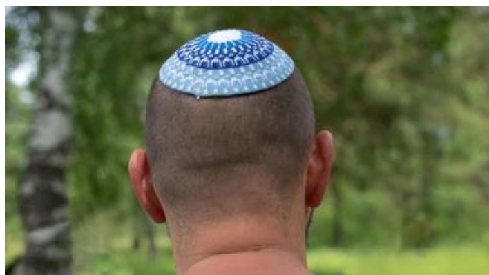
Obrázek 3: Kipa