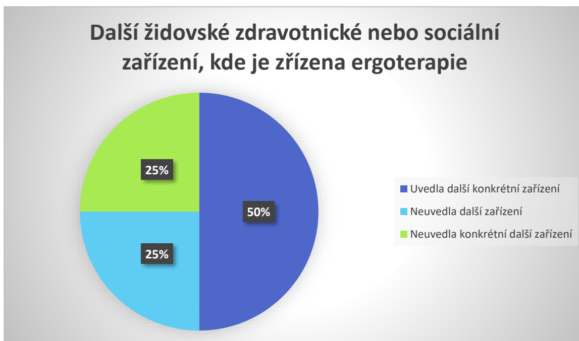
Graf 3 Další židovské zdravotnické nebo sociální zařízení, kde je zřízena ergoterapie

Respondentka č. 4 odpověděla: „Židé žijí po celém světě, takže si myslím, že v každé zemi, kde žijí se nachází nějaké sociální nebo zdravotnické zařízení určené pouze pro ně.“