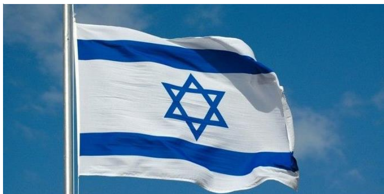
Obrázek 2: Izraelská vlajka s Davidovou hvězdou