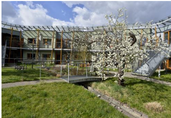
Obrázek 8: DSP Hagibor, obytná část