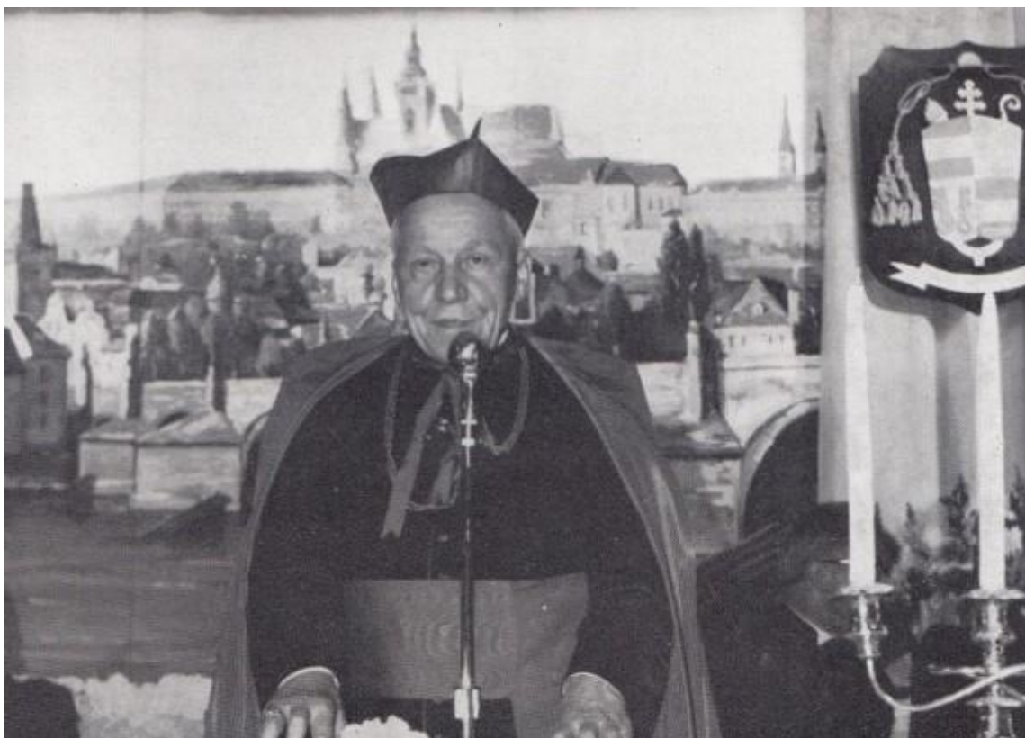
Obrázek 12 – Svatý otec se loučí se zesnulým Josefem Beranem 133