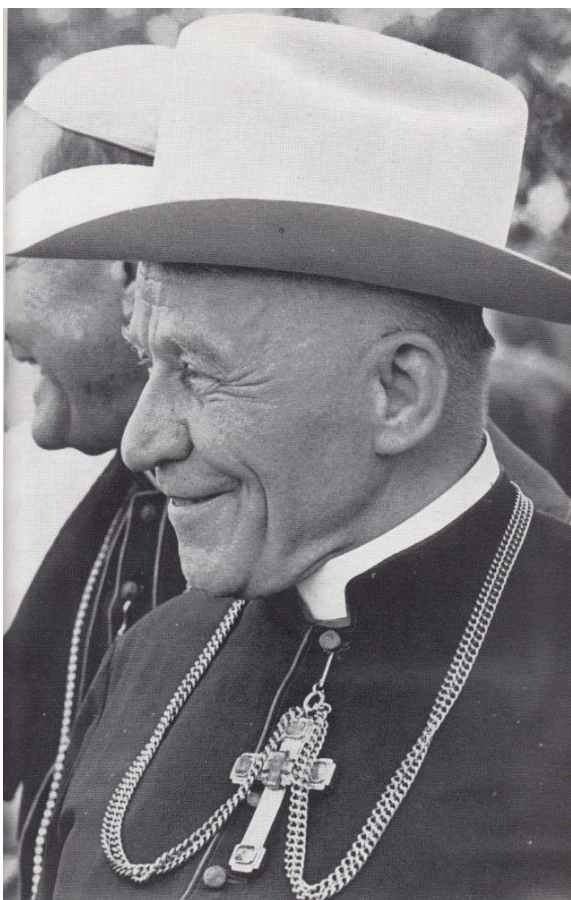
Obrázek 8 – U ostatků bratra Slavoje 129