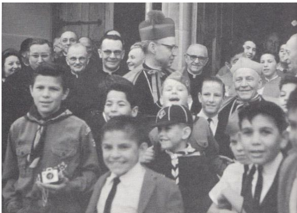
Obrázek 6 – Na návštěvě v texaské Praze 127