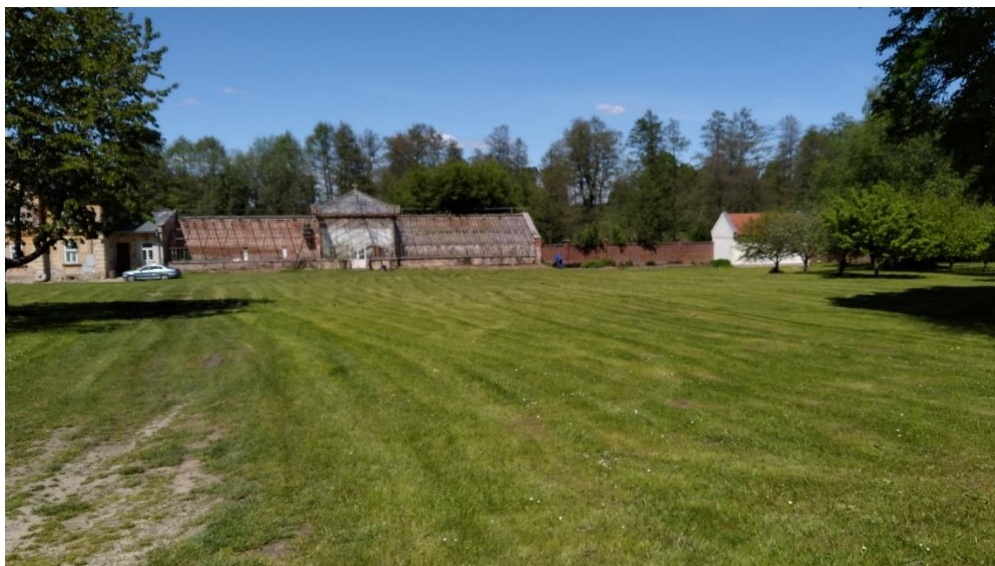
Obrázek č. 4: Klášterní hospic. Dne 22. 05. 2020.