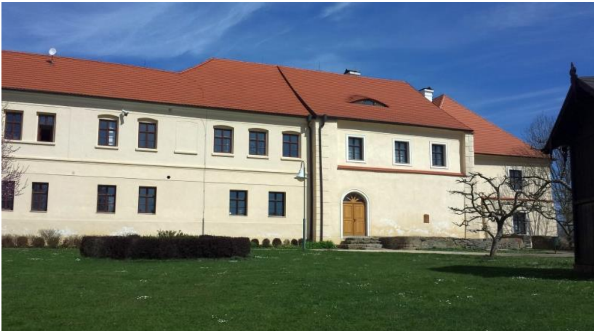
Příloha č.6: Minoritský klášter, kde byl Ilov dočasně pohřben