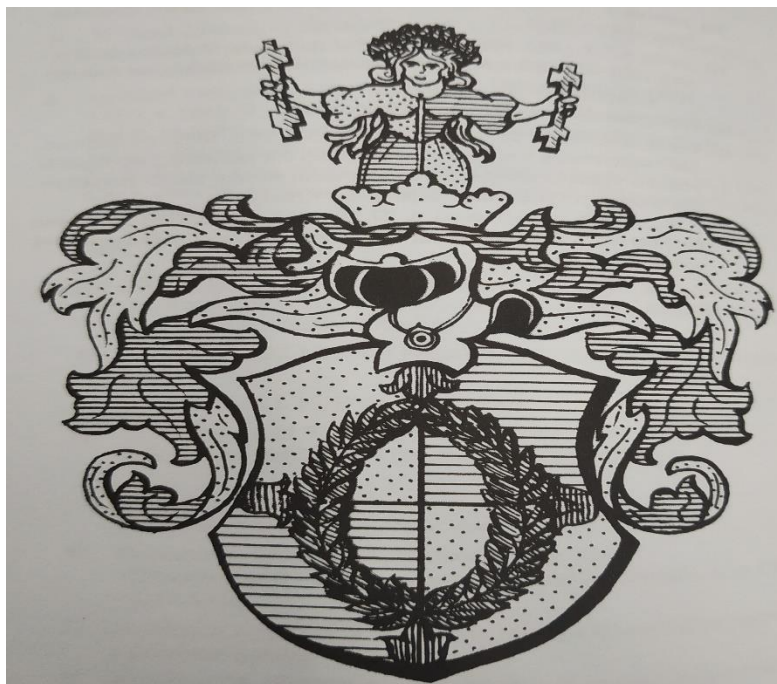
Příloha č.1: Erb Kristiána Illova