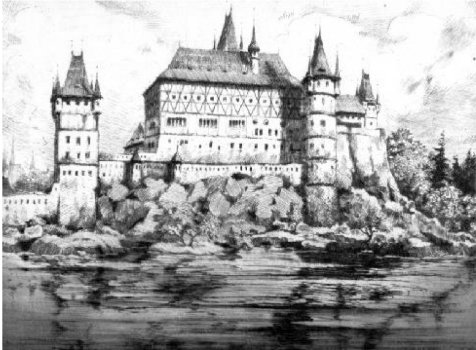
Příloha č.5: Chebský hrad v roce 1634 podle R. Schindelbucha z roku 1924