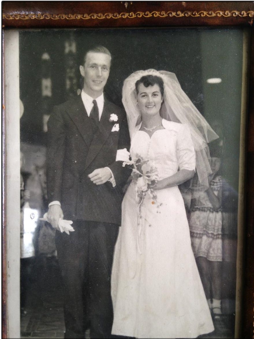
Příloha č. 9 - Svatební fotografie 9