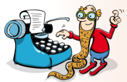
Obr. 8: Korektura textu v učebnici pro devátý ročník, str. 38

Kryštofovy lyže stály opřené o skříň. Podej Jakobovy talíř. Potkal jsem bratry Pospíšilovi, když jeli na hokej. Obdivuji sourozence Boubínovy, jak to všechno zvládly. Petrovi rodiče se často hádají. Mám rád Ortenovy verše. Vojtovy zazvonil telefon. Dedečkovi koně zvířeziliv nejednech dostizích.