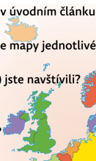
Obr. 4: Hledání souvislostí, Český jazyk 6, str. 19