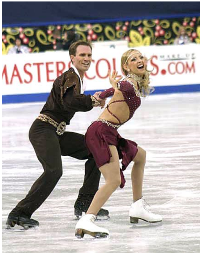
OBRÁZEK 9 - TATYANA NAVKOVÁ - ROMAN KOSTOMAROV