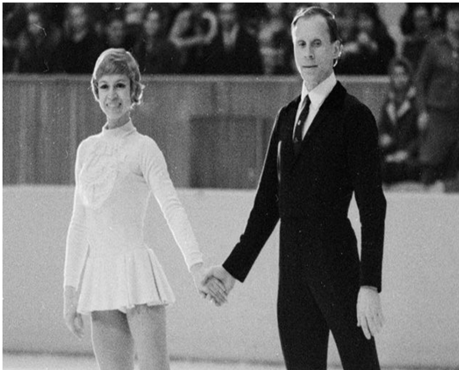
OBRÁZEK 6 - LIUDMILA BĚLOUSOVOVÁ - OLEG PROTOPOV