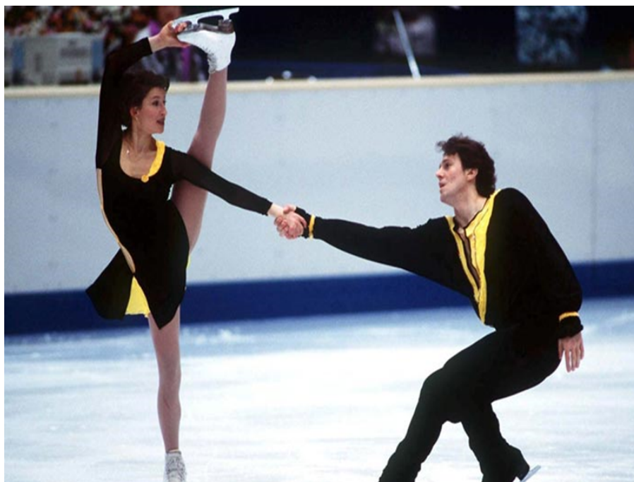
OBRÁZEK 10 - OKSANA KAZAKOVA - ARTUR DMITRIEV