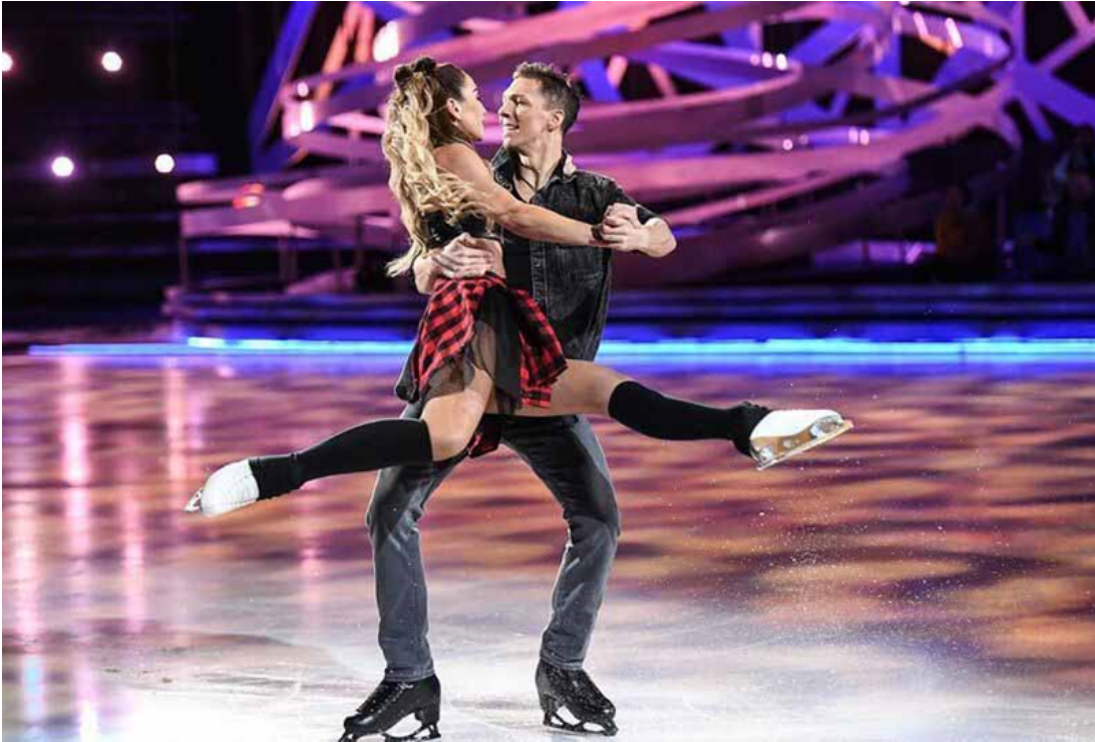
ОБРАЗОК 11 - ТЕЛЕВИЗНИ ШОУ “ЛЕДНИКОВЫЙ ПЕРИОД”