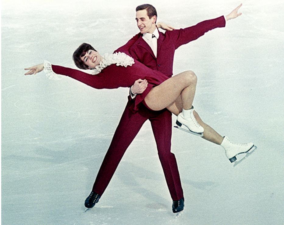
OBRÁZEK 5 - LIUDMILA PACHOMOVOVÁ - ALEXANDR GORŠKOV