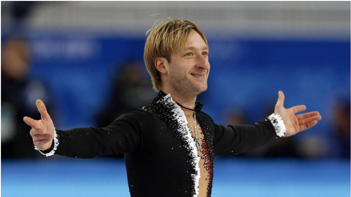
OBRÁZEK 7 - JEVGENIJ PLJUŠČENKO