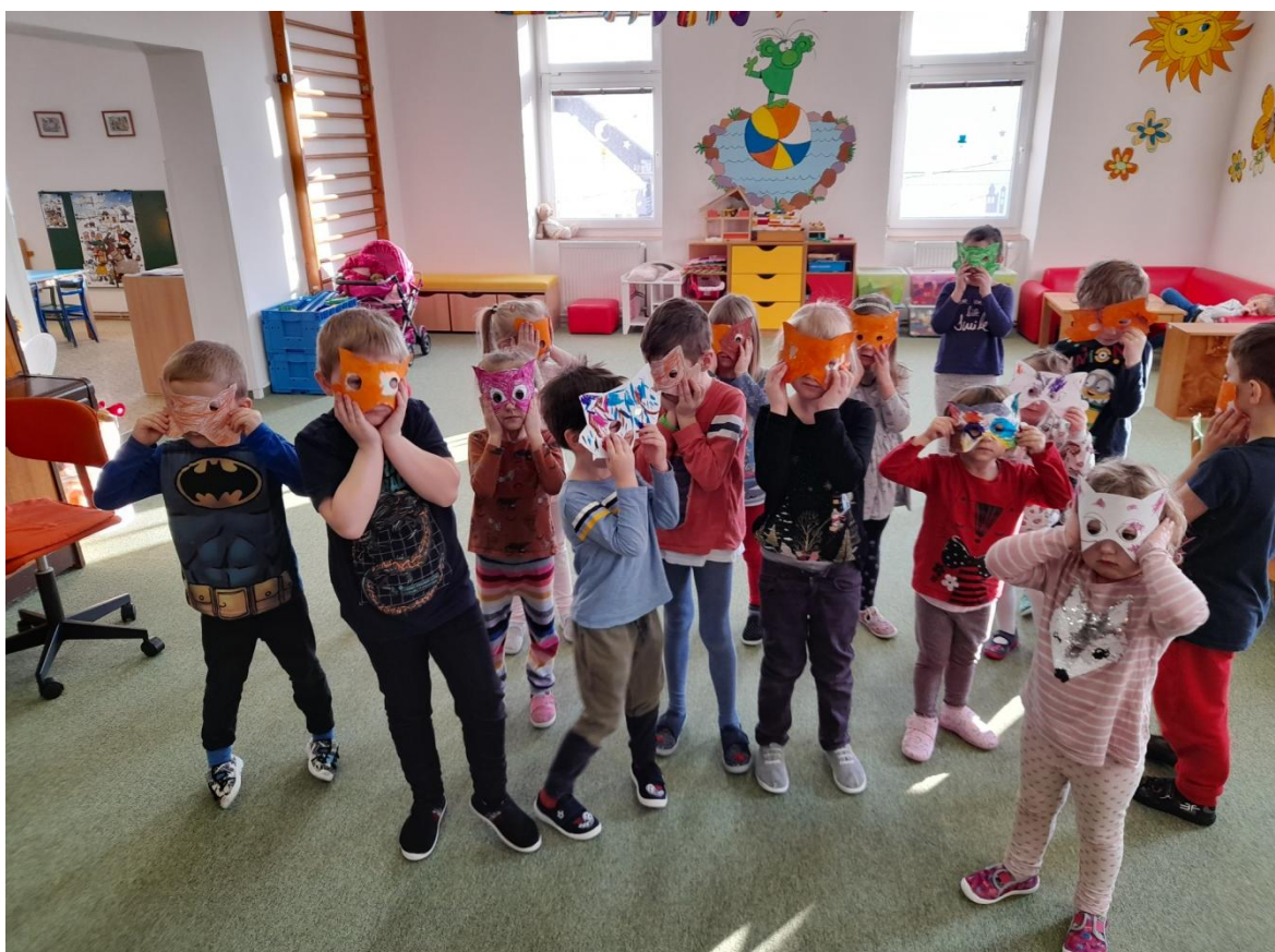
Na lišky v doupatech