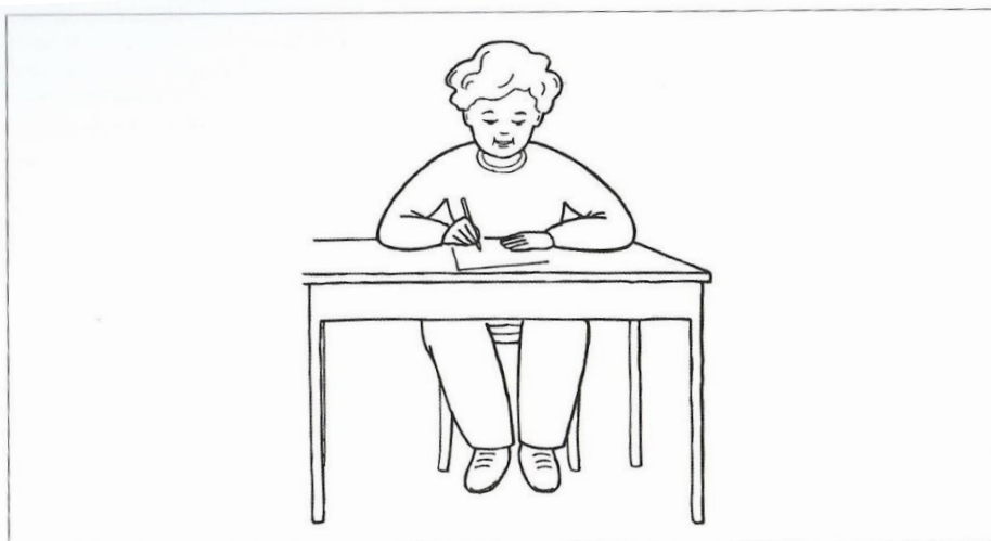
Poloha vsedě - správné sezení při kreslení a psaní.

Obrázek 1: Poloha vsedě, správné sezení při kreslení a psaní (Bednářová, Šmardová, s. 49, 2011)