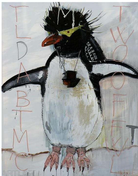
Příloha 4: Václav Gírsa, Rockhopper, 2007