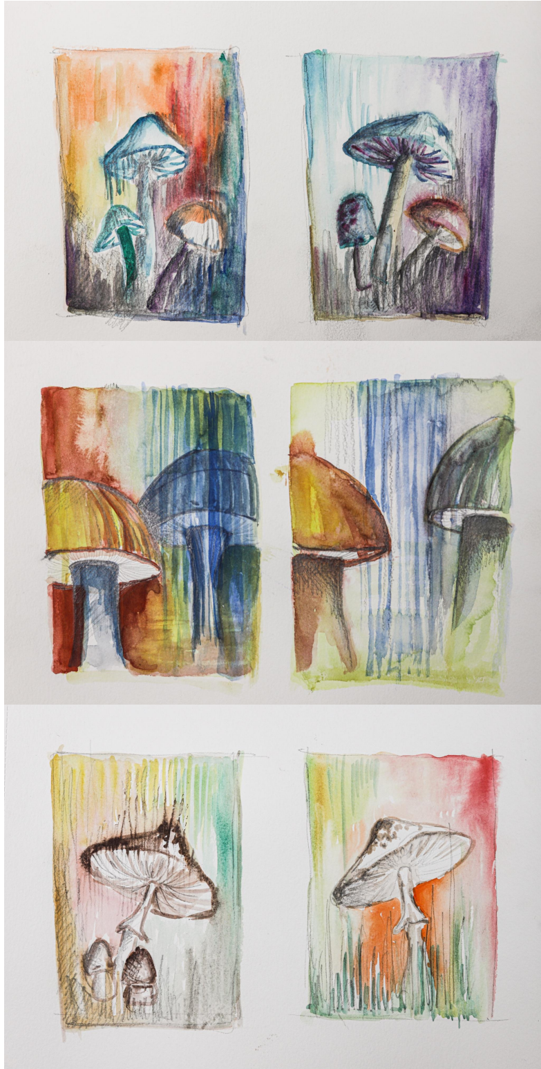
Příloha 8: Možné varianty