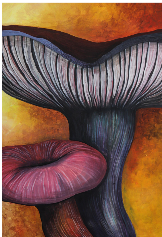
Příloha 14: Obraz č. 6