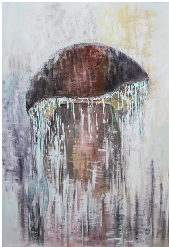
Příloha 11: Obraz č. 3