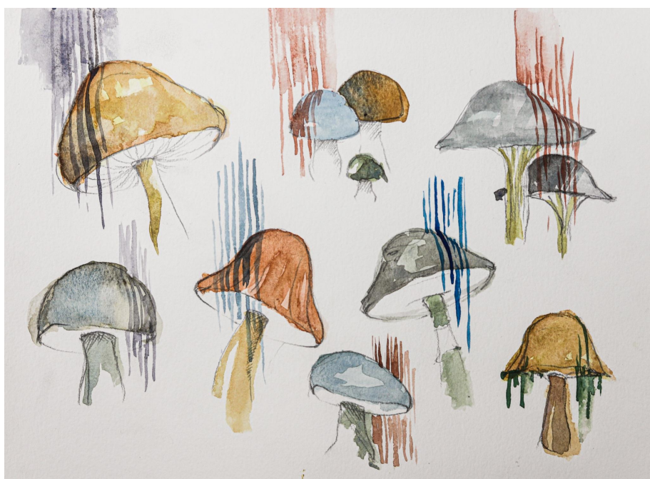
Příloha 6: Hledání emočního prvku