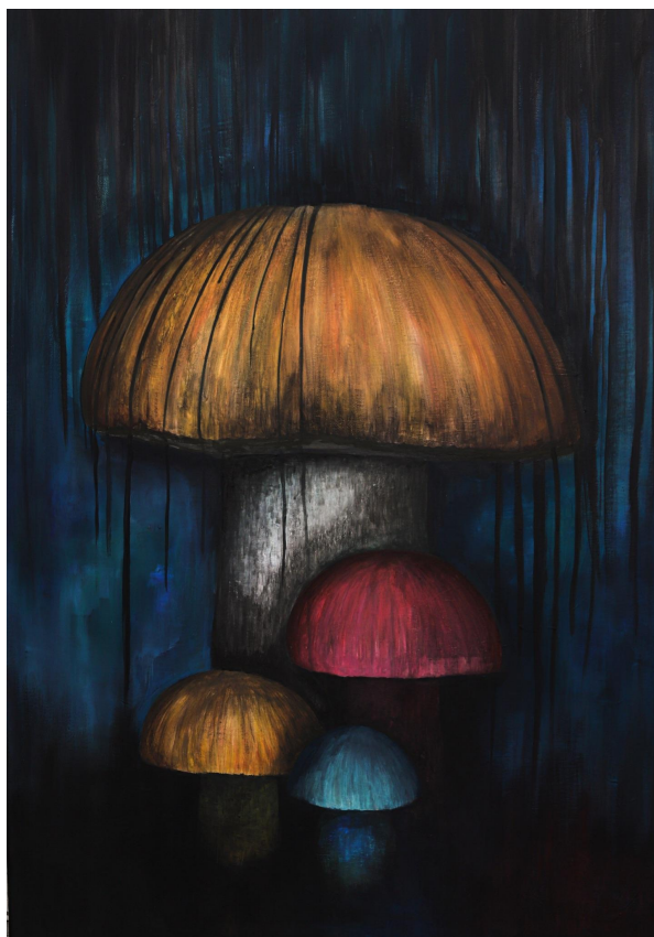
Příloha 13: Obraz č. 5