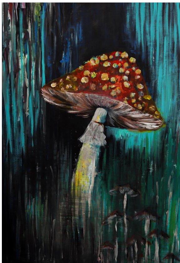
Příloha 9: Obraz č. 1