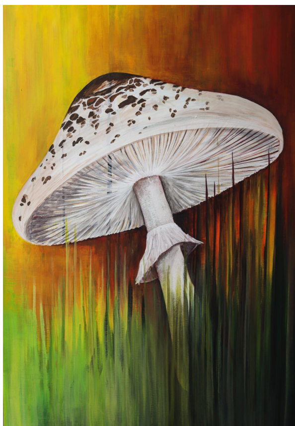
Příloha 12: Obraz č. 4