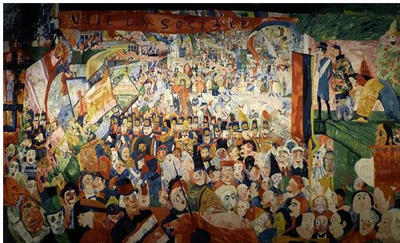
Příloha 1: James Ensor, Vjezd Krista do Bruselu, 1886