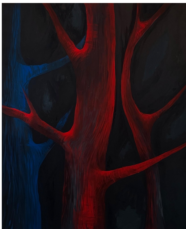
Příloha 16: Obraz č. 8