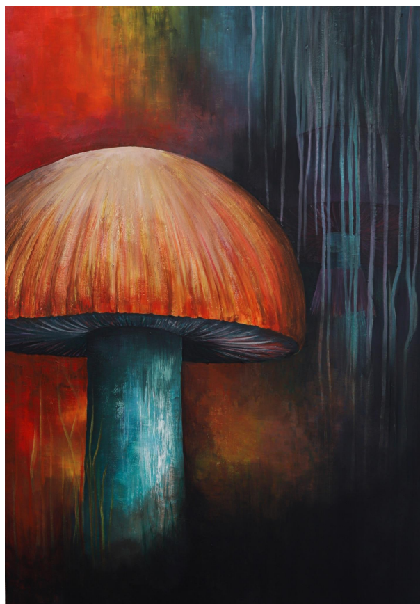
Příloha 15: Obraz č. 7