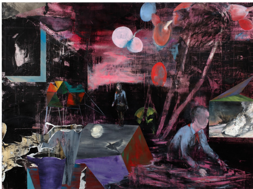
Příloha 3: Josef Bolf, Cassiopeia, 2017