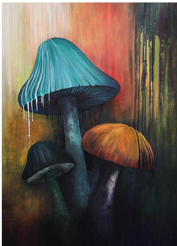
Příloha 10: Obraz č. 2