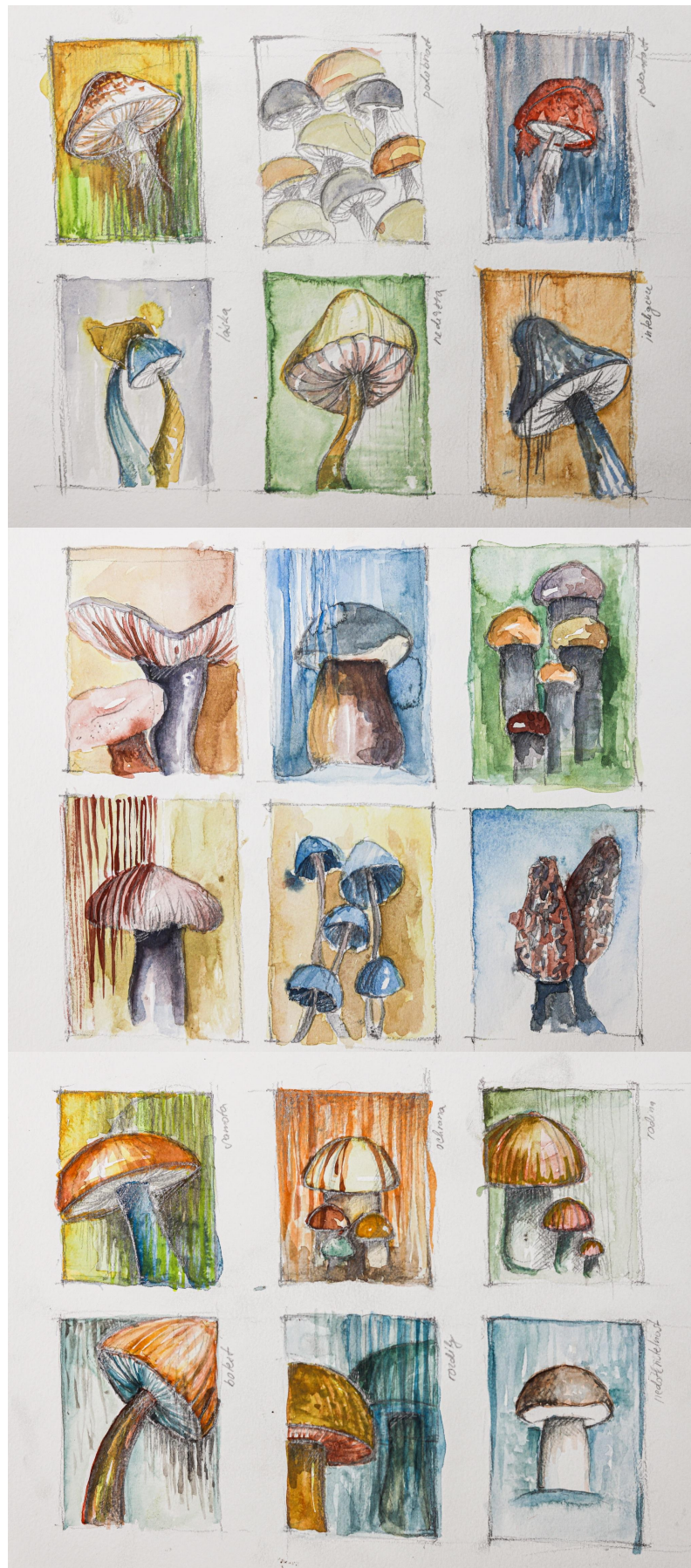
Příloha 7: Náčrt jednotlivých obrazů