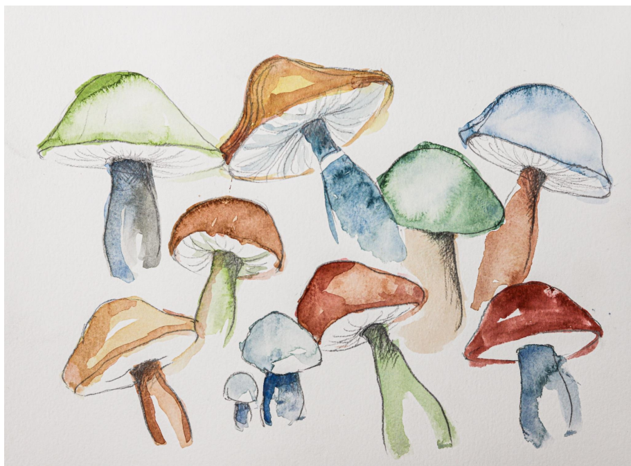
Příloha 5: Počáteční skici