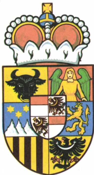
Příloha 11: Erb rodu Lobkoviců 95