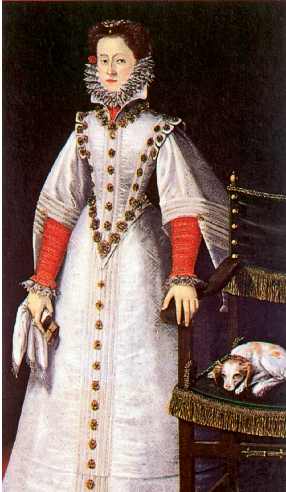
Příloha 5: Polyxena z Lobkowicz 89