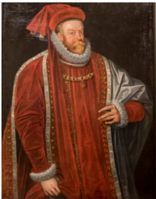
Příloha 2: Vratislav z Pernštejna 86