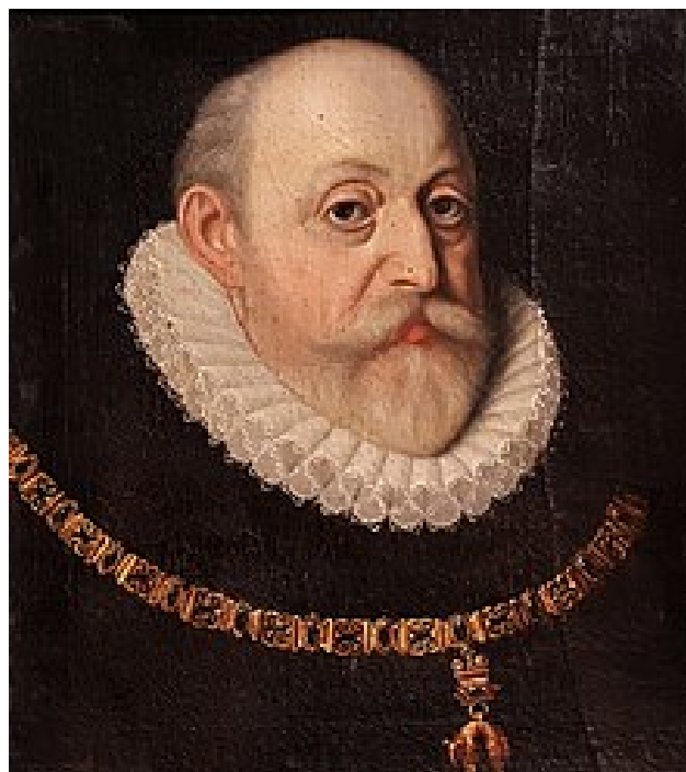
Příloha 7: Vilém z Rožmberka 91