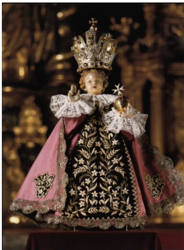
Příloha 12: Pražské Jezulátko 96