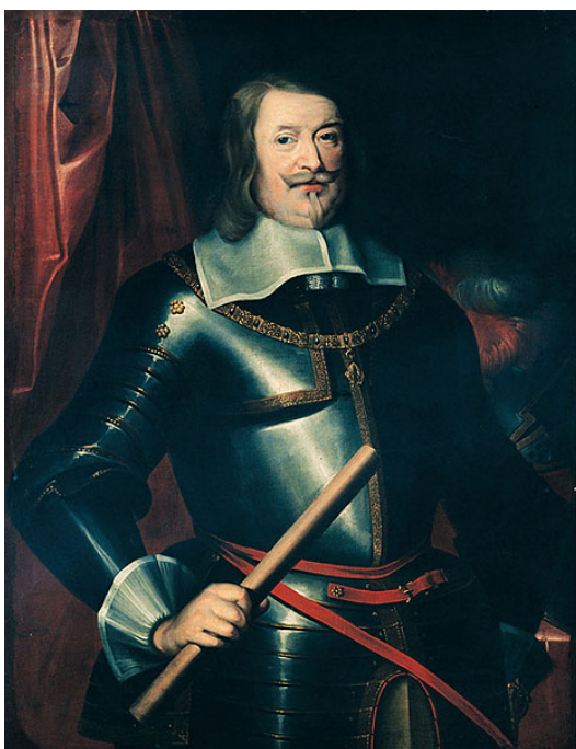
Příloha 10: Václav Eusebius Popel z Lobkovicz 94