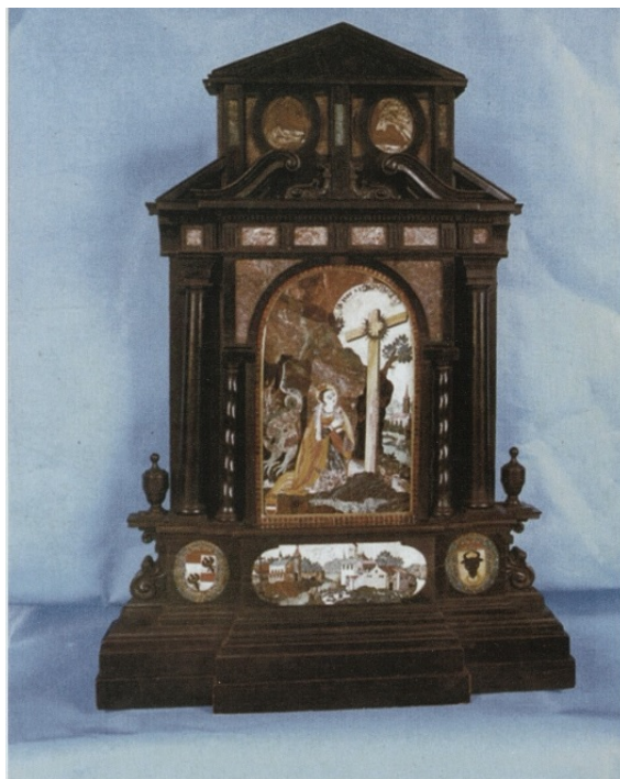
Příloha 9: Svatební dar Rudolfa II. ke svatbě a Vojtěch Popela 93