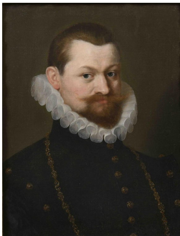
Příloha 8: Zdeněk Vojtěch Popel z Lobkovicz 92