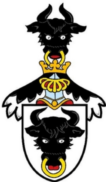
Příloha 1: Erb rodu Pernštejnů 85