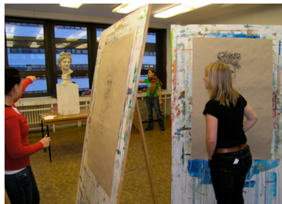
Než se stal fakultou se jménem Ladislava Sutnara a s vlastní budovou, sídlil Ústav umění a designu i v budově Fakulty strojní. Snímek je z roku 2009.

V roce 2021 už listujete časopisem Z a v něm čtete tento článek. Držíte v rukou důkaz, že Západočeská univerzita v Plzni má za sebou bohatých 30 let, během nichž se neustále vyvíjela, a před sebou má slibnou budoucnost, která může na třicetiletém základu pevně stát. ●