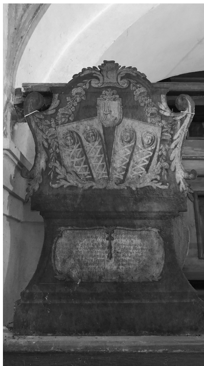
Náhrobní epitař čtyřčat Alžběty Pernerové z roku 1801.