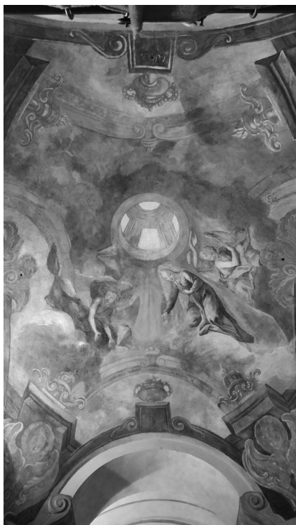
Freska Panny Marie jako přímluvkyně, F. J. Lux, asi 1746. Foto Pavel Kozák, 2020