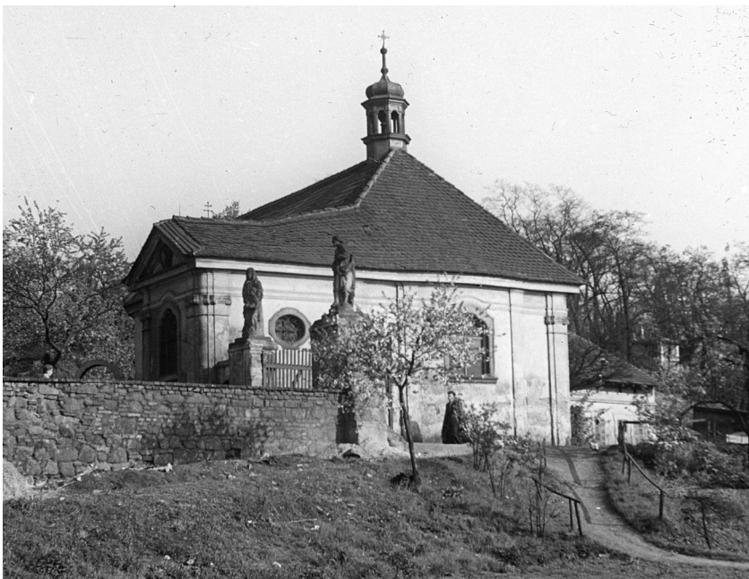
Pohled na kostel od řeky Radbuzy z původní úrovně terénu, 40. léta 20. století. AMP, Sbírka negativů, inv. č. N 895, sign. e1