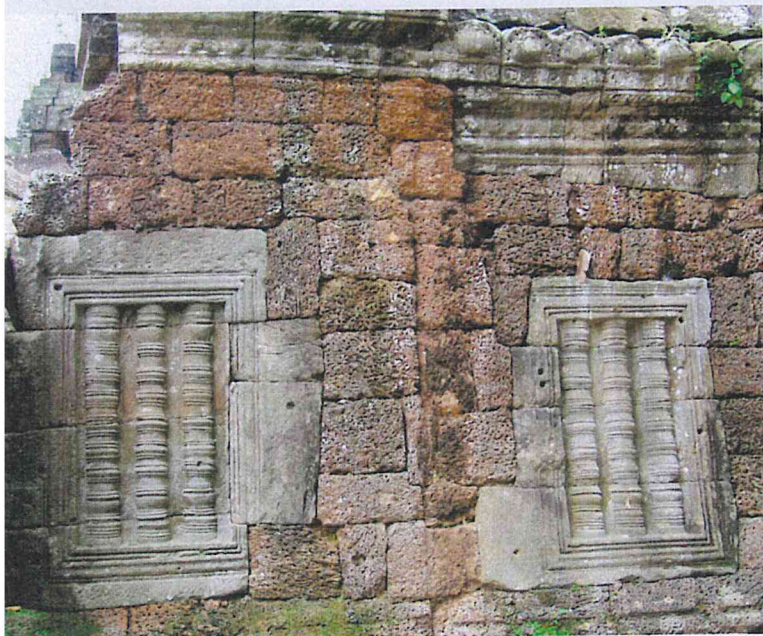
▲ Obr. 3 Konstrukce stěny chrámové chodby kombinující lateritové a pískovcové bloky, chrám Ta Nei, konec 12. století

hutným a těžkým dřevem. Stromy s chrámovými stavbami vytvářejí vizuálně velmi atraktivní a unikátní prostředí.