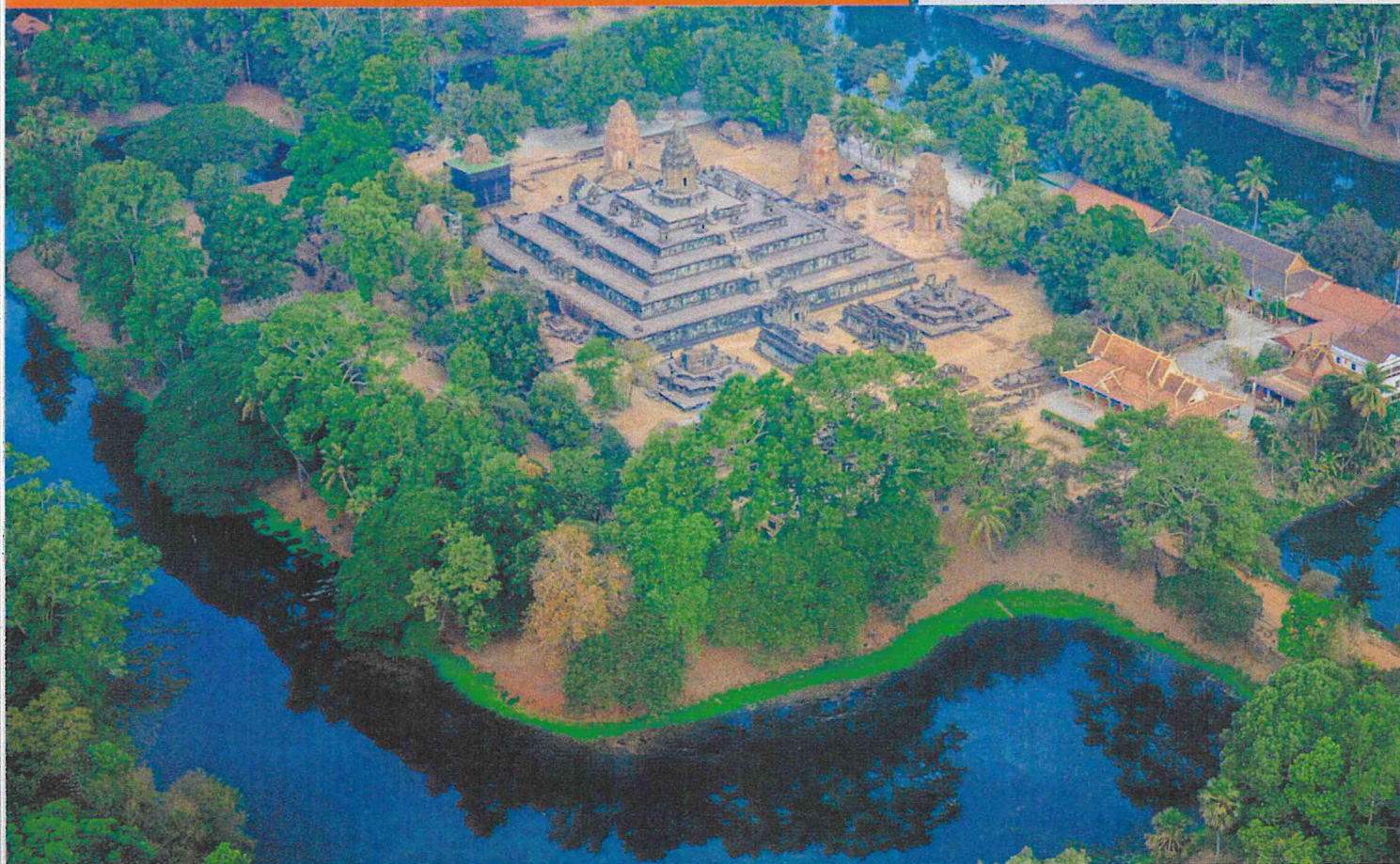
▲ Obr. 1 Typické prostorové uspořádání angorského chrámu – první pískovcový chrám Bakong, konec 9. století