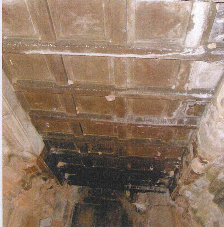
▲ Obr. 9 Novodobý železobetonový strop chodby, tvarová replika původního dřevěného podhledu, chrám Baphuon

[5] PAŠEK, J.; K. KRANDA. Existing Analysis and Evaluation of the Observed Structural Faults in Standing Constructions of Angkor. Published lecture, 21 st Technical Session of International Co-ordinating Committee for the Safeguarding and Development of the Historic Site of Angkor Meeting, Siem Reap, June 2012, pp. 105–107.