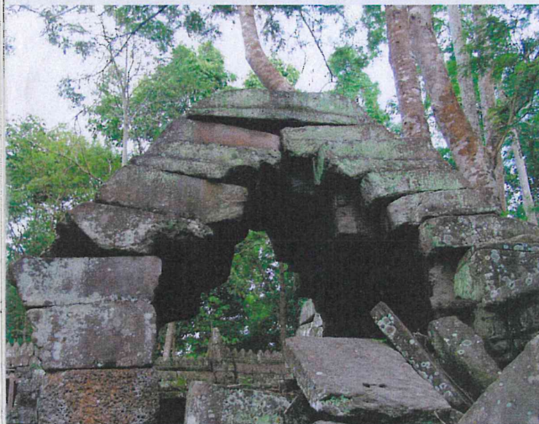
▲ Obr. 6 Nepravá klenba angorského chrámu ve stavu narušené stability a probíhajícího kolapsu, chrám Ta Nei