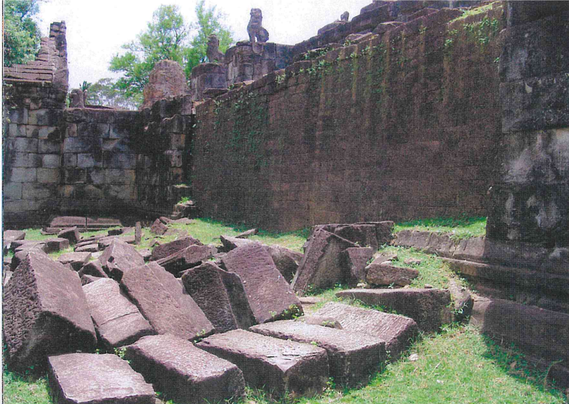
▲ Obr. 5 Dvouvrstvá opěrná zeď opláštění stupně pyramidy se zhroutilou vnější pískovcovou vrstvou, chrám Bakong