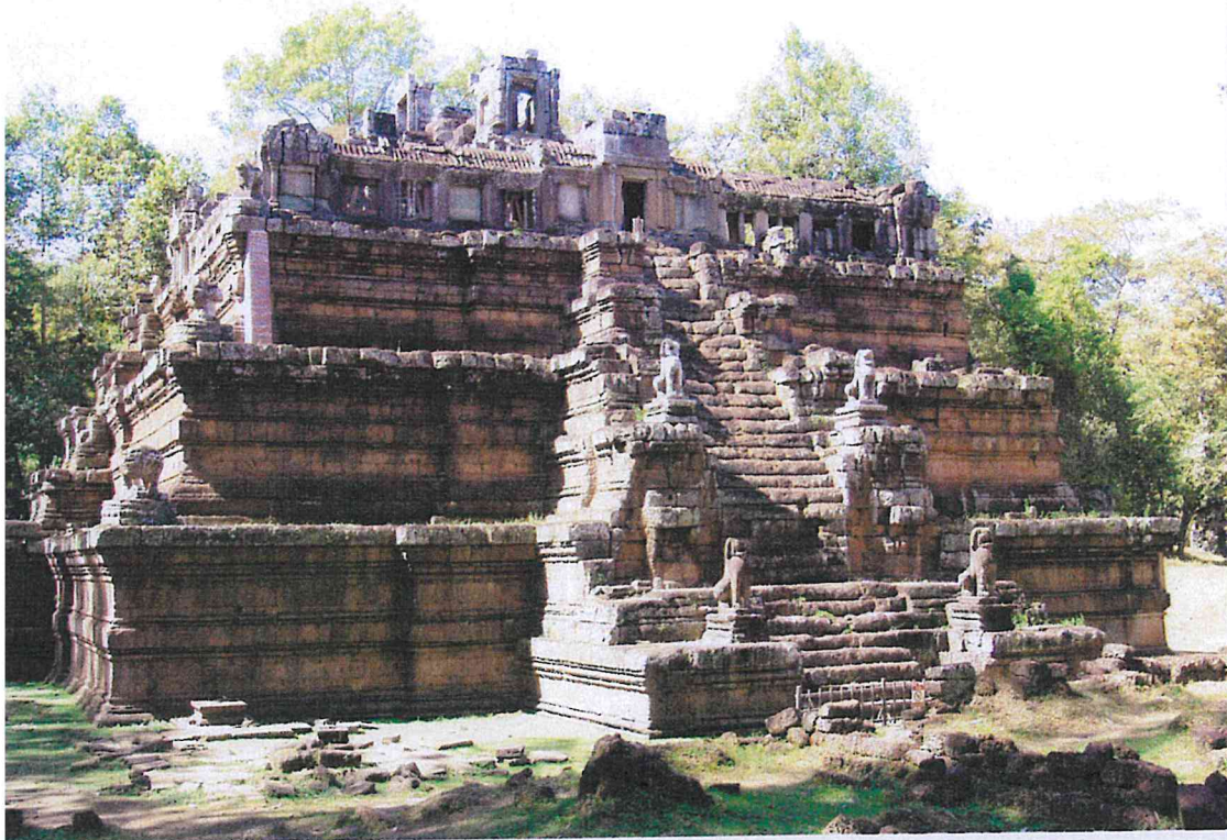
▲ Obr. 2 Centrální stavba chrámu Phimeanakas, konec 10. století

■ pisolitický laterit, který byl mj. použit i na obvodové stěny chrámů zdobených reliéfy.