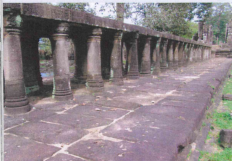
▼ Obr. 7 Konstrukce vnější přístupové cesty – tzv. causeway, chrám Baphuon, polovina 11. století

anebo jezera v zelených plochách uvnitř areálu. U velkých chrámů tvořily součást jejich vnitřních prostor bazény, některé menší chrámy byly umístěny doprostřed vodní nádrže. Angkorské pláně jsou často cyklicky zaplavovány v době monzunů. Pro přístupy a přechody přes vodní a zaplavované plochy byly budovány vyvýšené cesty hustě podepřené pilíři, tzv. causeways (viz obr. 7). Chrámové stavby byly opatřeny systémem pro zachycení a odvedení dešťové vody, jenž zajišťoval ochranu jejich uživatelů i stabilitu konstrukcí, a to zejména v období monzunu. Pokud byla zachována jejich těsnost, vnitřní a vnější odvodňovací opatření zajišťovala efektivní a kontrolovaný odvod dešťové vody. Jednalo se zejména o dešťové drážky, žlaby a tunely, odvádějící vodu