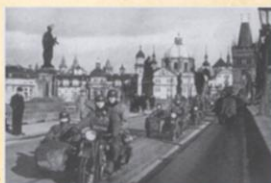
Nacisté v Praze