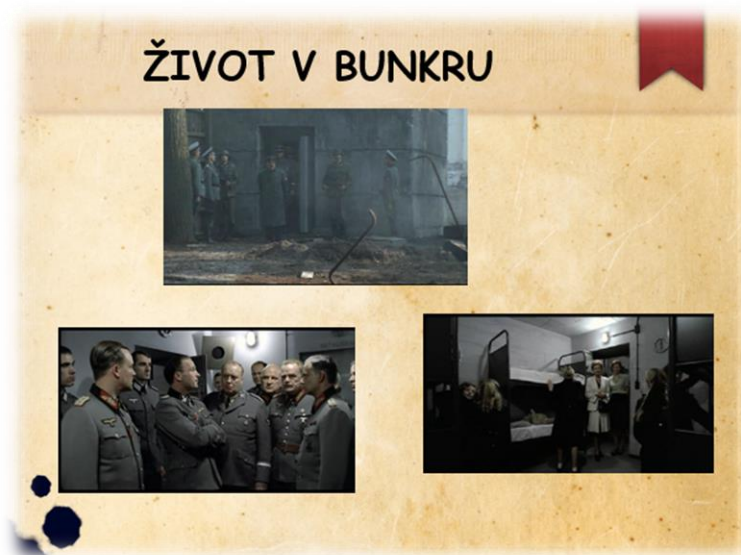
Obrázek XIII - Život v bunkru

Žákům jsem samozřejmě řekla i o dalších atentátech. Opět se všichni shodli na tom, že kdyby se atentáty povedly, mohl být klid.