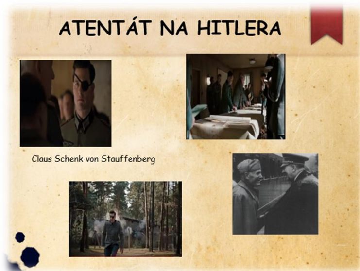
Obrázek XII - Atentát na Adolfa Hitlera

Na Adolfa Hitlera nebyl spáchán atentát pouze jednou, ale vybrala jsem asi ten nejdůležitější – atentát, který provedl Claus Schenk von Stauffenberg, jeden z Hitlerových mužů. O tomto atentátu je film Valkýra, z kterého je vybrán ikonický text na tomto snímku. Na poslední fotografii je znázorněn Adolf Hitler se svým přítelem Benitem Mussolinim. Vůdce po tomto atentátu prohlásil, že je nesmrtelný a Prozřetelnost chce, aby vedl Německo.