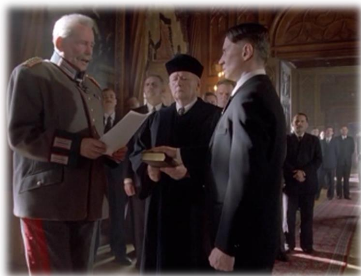
Obrázek XXIX - Hitler vzestup zla (Kancelář)

Žákům byla puštěna ukázka s Gelinou sebevraždou. Aby pochopili, proč tento čin udělala, pustila jsem jim ještě kousek, kde Hitler našel svou neteř se svým řidičem, jehož chtěl zastřelit. Ještě před puštěním ukázky se sebevraždou se mě žáci ptali, proč raději neutekla. Později ale viděli, že to možné nebylo.