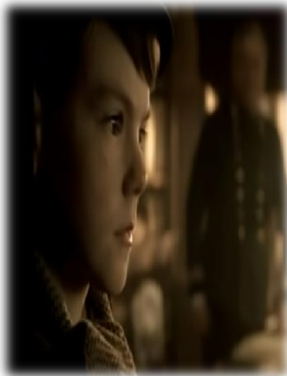
Obrázek XVI - Hitler Vzestup zla (Dětství)

Žákům jsem nejdříve pustila atentát na Hitlera – videoukázka je z filmu Valkýra. Část filmu, ve které je atentát ukázán, jsem žákům pustila z youtube. Tato ukázka trvala devět minut.