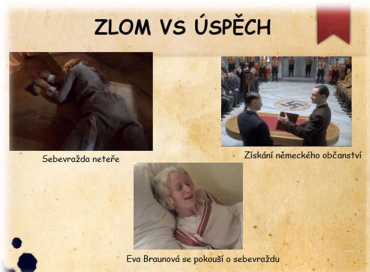
Obrázek VIII - Hitlerovy pády a úspěchy

Velkou ránou pro Adolfa Hitlera byla sebevražda jeho neteře Geli, která se již nehodlala smířit s životem ve zlaté kleci. Zemřela tak druhá žena, kterou Hitler miloval. I Eva Braunová se pokusila o sebevraždu, která se jí však nepodařila. Stejně jako Geli žila v ústraní. Na ikonickém textu vpravo nahoře přebírá Adolf Hitler německé občanství od Josepha Goebbelse. Žákům přišlo divné, že do této doby neměl žádné občanství. Důležité bylo žáky seznámit také s osobností Josepha Goebbelse, jež Hitlera doprovázel až do úplného konce. Žákům jsem dále vysvětlila spojitost mezi ním a českou herečkou Lídou Baarovou.