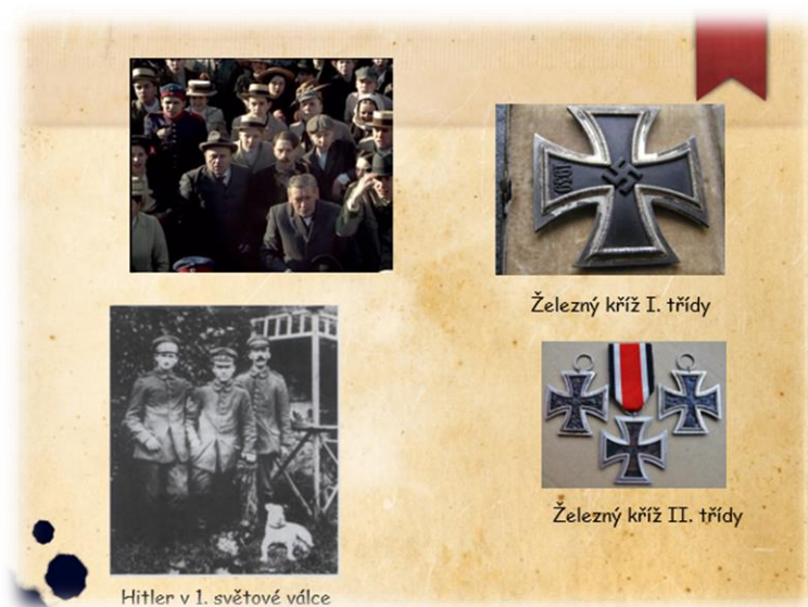
Obrázek III - Adolf Hitler v první světové válce

Druhý snímek žáky seznamuje s podobou Adolfa Hitlera jako malého chlapce a jeho rodiči. Na snímku je také vyobrazen Hitlerův rodný dům. Žáky jsem seznámila s Hitlerovou rodinnou situací, kdy ho jeho otec chtěl mít úředníkem stejně, jako byl on sám. Matka ho spíše rozmazlovala. Pro žáky bylo nepochopitelné zjištění, že jeho rodiče byli příbuzní. Žáky zajímalo, zda tento fakt mohl mít vliv na Hitlerovu povahu a chování. Osobně si myslím, že by zde mohla minimální šance, že příbuzenský vztah jeho rodičů mohl mít z části vliv na jeho osobnost, ale o tom se můžeme pouze dohadovat.