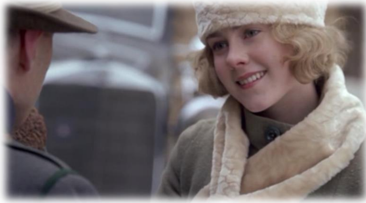
Obrázek XXVI - Hitler Vzestup zla (Geli)