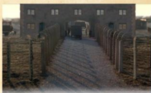
První koncentrační tábory