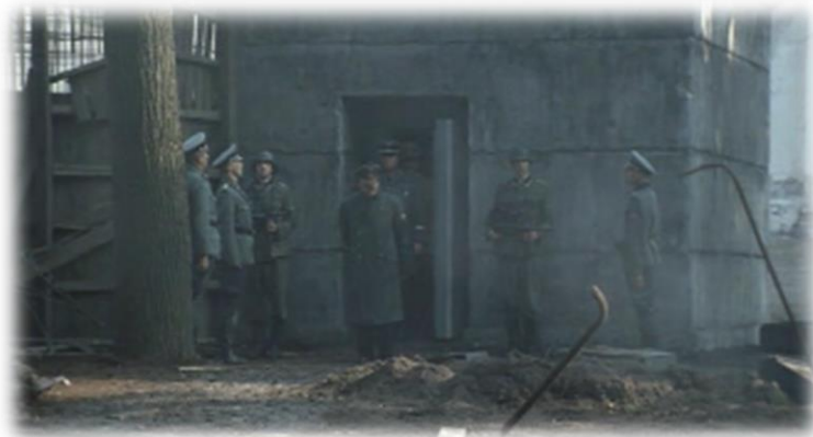
Obrázek XXX - Pád Třetí říše (Bunkr)