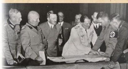
Podpisování mnichovské dohody

Zeptala jsem se, zda se i v dnešní době můžeme setkat s kancléřem. Původně jsem nepředpokládala, že žáci budou odpověď na mou otázku znát (myslím si, že se příliš na seriózní pořady a zprávy nedívají), ale byla jsem příjemně překvapena, když mi jeden chlapec správně odpověděl.