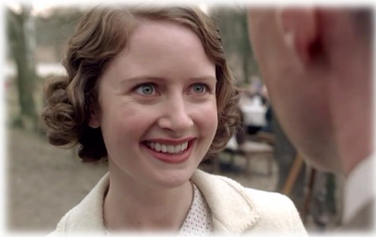
Obrázek XXVII - Hitler Vzestup zla (Eva Braunová)

Žáky jsem již první hodinu seznámila s dalšími ženami Hitlerova života. Hitler miloval kromě své matky i svou neteř Geli. Eva Braunová sice byla jeho partnerkou a později i ženou, ale myslím si, že takovou náklonost, kterou měla jeho matka a Geli, ona od Vůdce neměla. Žáci se poprvé setkali se jménem Eva Braunová.