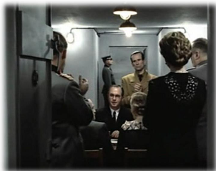
Obrázek XXXII - Pád Třetí říše (Svatba)