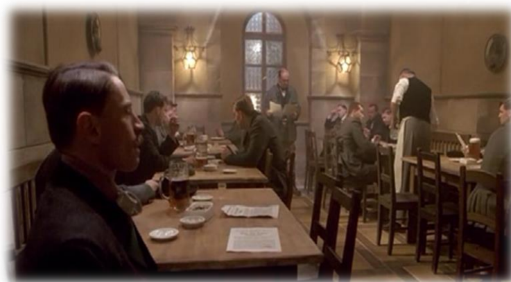
Obrázek XX - Hitler Vzestup zla (Počátky)

Žáci v první hodině viděli ikonický text s Hitlerovými pokroky v řečnictví. Druhou hodinu měli možnost vidět začínajícího Hitlera a mohli srovnat jeho posouvání se v řečnictví.