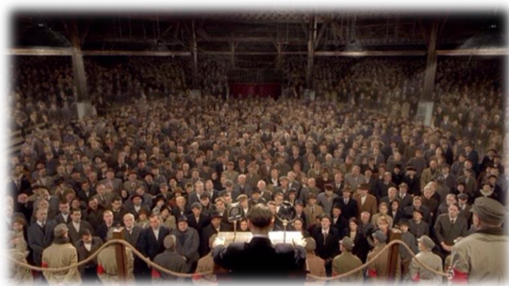
Obrázek XXII - Hitler vzestup zla (Velký úspěch)

Při ukázce plného cirkusu Krone, několik žáků přirovnalo dav k robotům. Když jsem se jich zeptala, proč zrovna k robotům, argumentovali tím, že roboti musejí být poslušní a dělají pouze to, co se jim řekne. Někdo dokonce přirovnal Hitlera k hypnotizérovi.