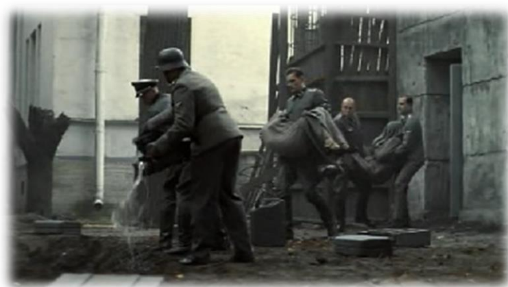
Obrázek XXXIII - Pád Třetí říše (Konec)

Poslední část byla zaměřená na Hitlerovu svatbu a úplný konec. Jelikož nám zbyla ještě chvilka času, byl prostor na diskuzi a případné otázky. Žáci se shodli na jedné věci – Adolf Hitler byl největší zlo, které nás mohlo potkat. Když jsem odcházela ze třídy, atmosféra byla napjatá. I přes respirátory jsem na žácích viděla, jak je mé dvě hodiny „zasáhly“. Pro tento pocit jsem se rozhodla žákům zprostředkovat informace o osobnosti Adolfa Hitlera.