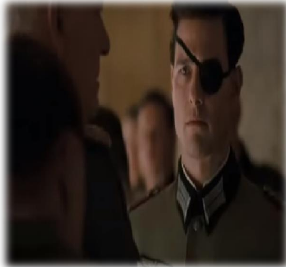
Obrázek XV - Film Valkýra (atentát)

Žákům jsem nejdříve pustila atentát na Hitlera – videoukázka je z filmu Valkýra. Část filmu, ve které je atentát ukázán, jsem žákům pustila z youtube. Tato ukázka trvala devět minut.