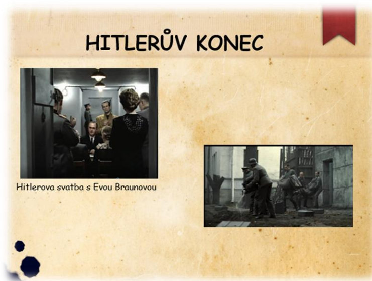
Obrázek XIV - Hitlerův konec

Pro třídu bylo naprosto nemyslitelné, že by se někdo chtěl dobrovolně odstěhovat do bunkru a navíc kvůli Hitlerovi. To jsme ale opět u jeho osobnosti. Nikdo z nás si asi nedovede představit, jaké měl charisma a jak na lidi působil.