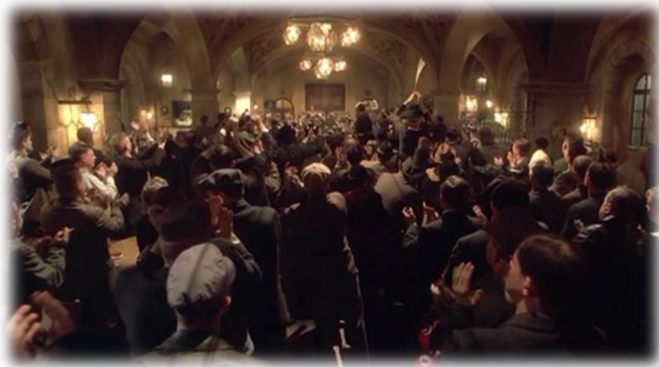
Obrázek XXI - Hitler vzestup zla (Malé úspěchy)