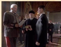
Hitler zvolen kancléřem