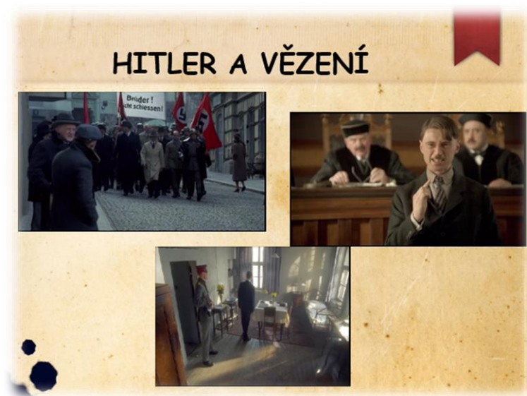
Obrázek VI - Hitlerova cesta do vězení

Jelikož se jedná o sedmý ročník, nepředpokládala jsem, že žáci budou vědět, co slovo puč vůbec znamená. Nejdříve jsem se jich zeptala, zda toto slovo někde slyšeli a zda dokáží vydedukovat význam tohoto slova. Následně jsme se pak společně dobrali k tomu, že puč je synonymem ke slovu převrat.