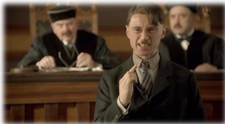
Obrázek XXIV - Hitler vzestup zla (Soud)

Jak již bylo řečeno v předchozí části, žáky jsem musela seznámit s pojmem puč. Myslím si, že díky videoukázce si to žáci lépe zafixovali.