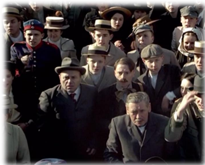
Obrázek XVIII - Hitler Vzestup zla (Fanatický Hitler)

Chtěla jsem žákům ukázat, čím se Hitler živil, když nebyl nikde zaměstnán a na Akademii výtvarných umění ho nevzali. V ukázce bylo možné vidět, jak Hitler sedí na nádraží a maluje pohledy, které následně prodával.