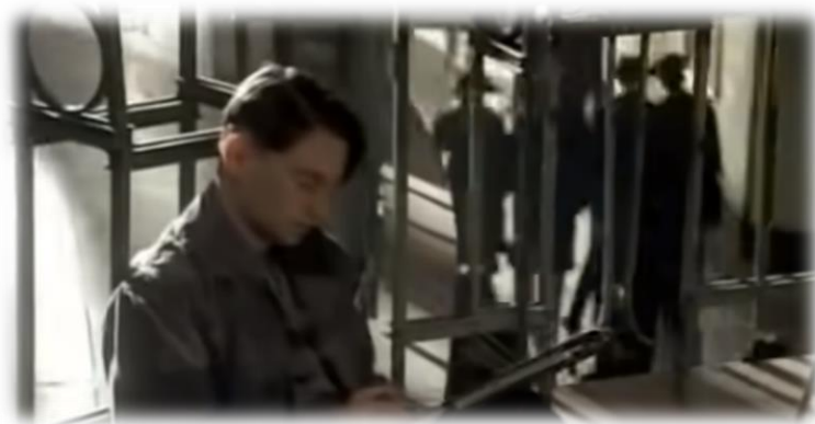
Obrázek XVII - Hitler Vzestup zla (Malba pohlednic)

Jeden žák se mě na základě videoukázky zeptal, zda není možné, aby Hitler svého otce otrávil. Teoreticky bychom mohli říci, že i taková věc je možná, ale opět se můžeme pouze dohadovat.