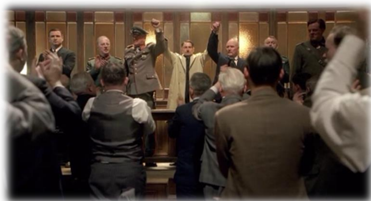
Obrázek XXIII - Hitler vzestup zla (Puč)

Při ukázce plného cirkusu Krone, několik žáků přirovnalo dav k robotům. Když jsem se jich zeptala, proč zrovna k robotům, argumentovali tím, že roboti musejí být poslušní a dělají pouze to, co se jim řekne. Někdo dokonce přirovnal Hitlera k hypnotizérovi.