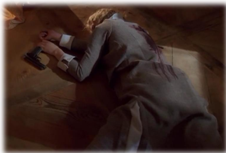
Obrázek XXVIII - Hitler vzestup zla (Sebevražda)

Žákům byla puštěna ukázka s Gelinou sebevraždou. Aby pochopili, proč tento čin udělala, pustila jsem jim ještě kousek, kde Hitler našel svou neteř se svým řidičem, jehož chtěl zastřelit. Ještě před puštěním ukázky se sebevraždou se mě žáci ptali, proč raději neutekla. Později ale viděli, že to možné nebylo.