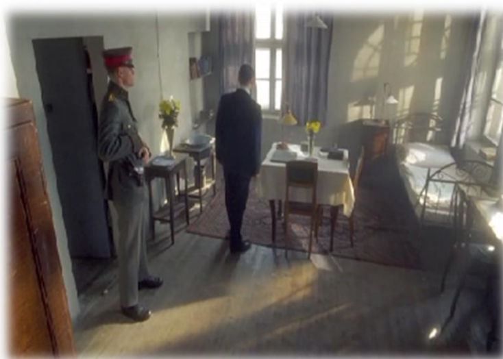
Obrázek XXV - Hitler Vzestup zla (Vězení)

Na předešlých snímcích měli žáci možnost vidět Hitlerův vliv – i u soudu Hitler uplatnil své umění řečnictví. Soudní síň mu sloužila jako náhražka publika v pivnicích. Když žáci uviděli Hitlerovu celu, byli pobouřeni nespravedlností. Do té doby bych ve třídě slyšela spadnout špendlík na zem.