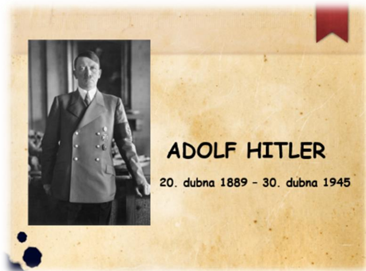
Obrázek I - Seznámení s osobností Adolfa Hitlera

První snímek prezentace zobrazuje fotografii Adolfa Hitlera. Myslím si, že by žáci měli mít povědomí o tom, jak nejnámější diktátor vypadal. Byť by jeho obličej měl znát každý (ať už ze školy nebo z televize), mohou se objevit výjimky, které jeho podobu neznají. Stejně jako je důležité znát jména, je také důležité znát obličej významných jmen naší historie.