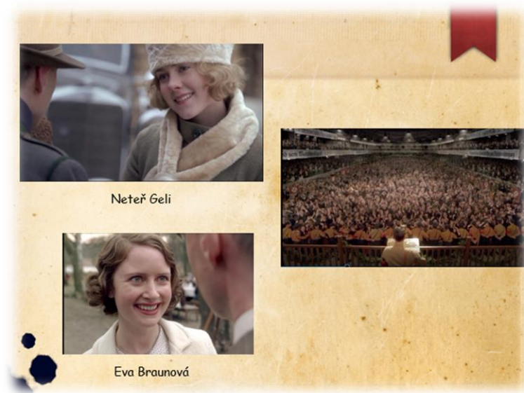
Obrázek VII - Hitlerovy důležité ženy

Je důležité žákům ukázat, že Adolf Hitler nebyl samotář, ač se na veřejnosti se ženami příliš neobjevoval. Důvodem bylo také to, že kdyby byl zadaný či ženatý, ztratil by spoustu přívrženců ženského pohlaví. Mezi nejdůležitější ženy jeho života jsem zařadila jeho neteř Geli, která s ním trávila poměrně dost času, ale Hitler ji držel jako ve zlaté kleci. Další jeho osudovou ženou byla Eva Braunová (asistentka říšského fotografa), která s ním vydržela až do konce. Ani ona to s Vůdcem neměla příliš jednoduché. Ikonický text vpravo ukazuje sílicí moc slov Adolfa Hitlera. Žáci opět mohli porovnat jeho začátky s narůstající slávou.