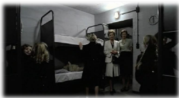
Obrázek XXXI - Pád Třetí říše (Stěhování)

Chtěla jsem žákům ukázat, jak moc byli lidé Hitlerovi oddaní, a proto jsem jim pustila část, ve které se Magda Goebbelsová i s dětmi přestěhovala do bunkru. Když se žáci poté ode mě dozvěděli, co udělala jejich dětem, byli značně pobouřeni. Nesmíme zapomenout, že i Magda Goebbelsová byla velkou přívrženkyní Adolfa Hitlera.