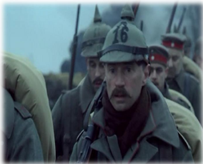
Obrázek XIX - Hitler Vzestup zla (Hitler ve světové válce)

V první hodině se žáci dozvěděli o Hitlerovo nadšení z první světové válka. V ukázce sami viděli, že byl opravdu fanatický. Další ukázka zobrazovala Hitlera v první světové válce. To dle žáků vypadal celkem „normálně“.