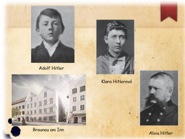
Obrázek II - Seznámení s rodinou

První snímek prezentace zobrazuje fotografii Adolfa Hitlera. Myslím si, že by žáci měli mít povědomí o tom, jak nejnámější diktátor vypadal. Byť by jeho obličej měl znát každý (ať už ze školy nebo z televize), mohou se objevit výjimky, které jeho podobu neznají. Stejně jako je důležité znát jména, je také důležité znát obličej významných jmen naší historie.