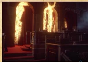
Zapálení říšského sněmu