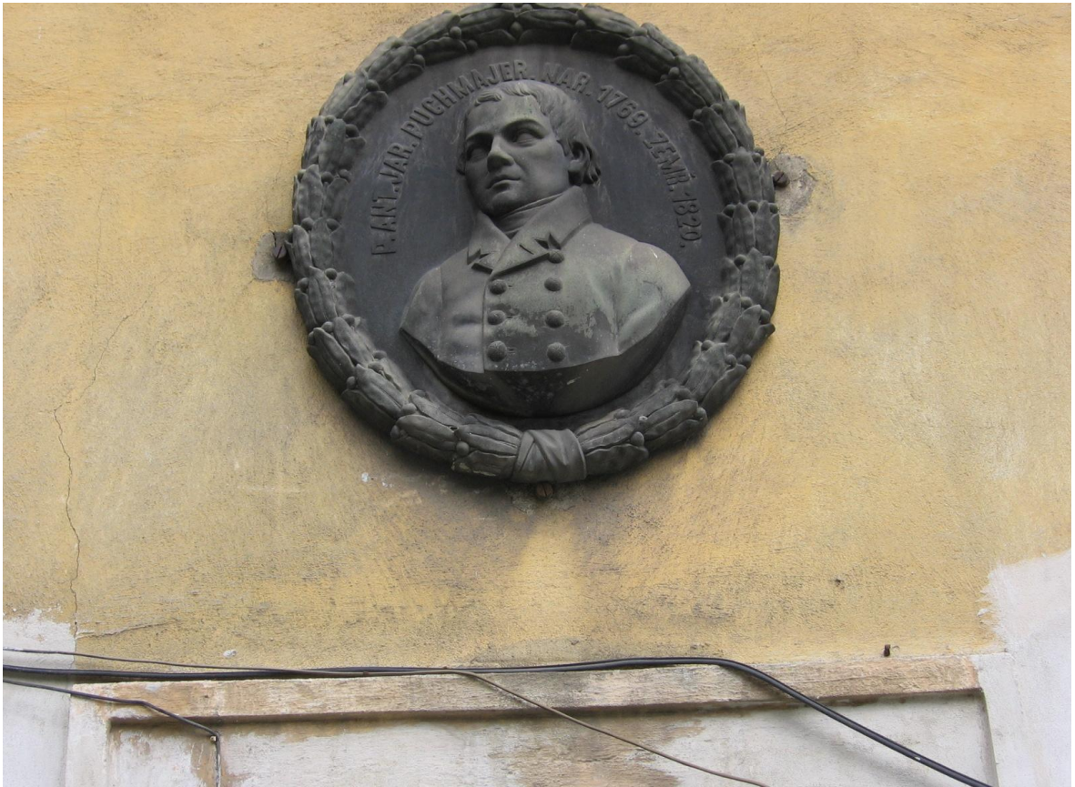
Příloha č. 1: Pamětní deska Antonína Jaroslava Puchmajera na radnické faře