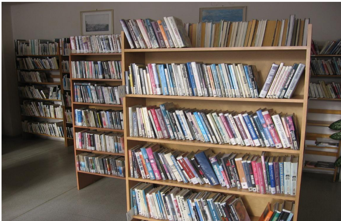
Příloha č. 6: Fotografie dětského oddělení