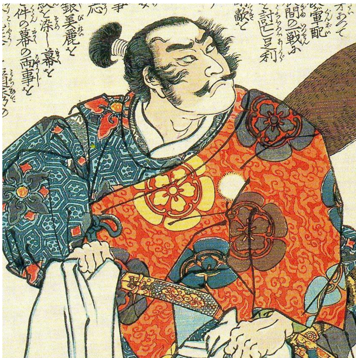
Obr. 2 – Vyobrazení Ody Nobunagy