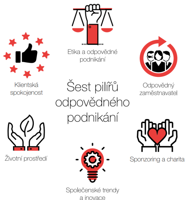
Obr. 2 Šest pilířů odpovědného podnikání