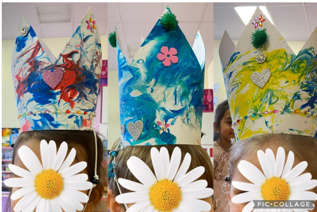
Obrázek 11 Hotové koruny