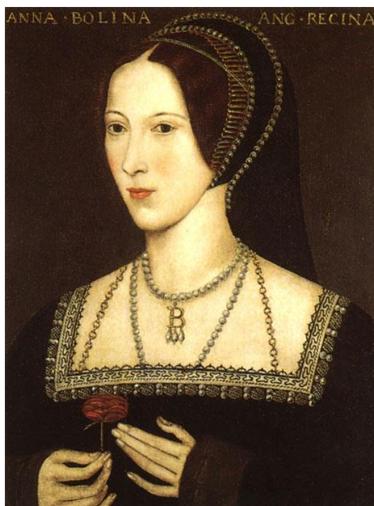
Obrázek 1 Anna Boleynová