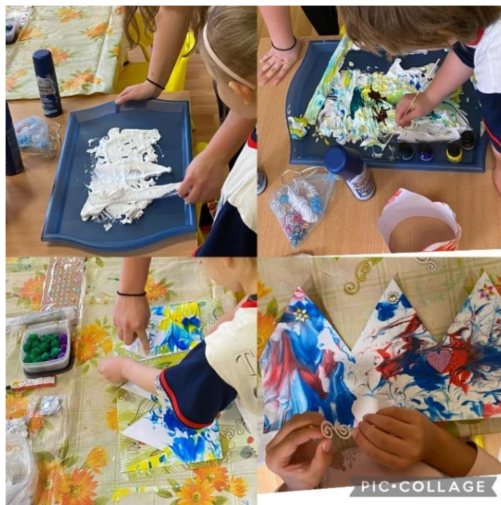
Obrázek 2 nastříkání pěny, rozprostření barev v pění, shrnutí pěny a zdobení koruny