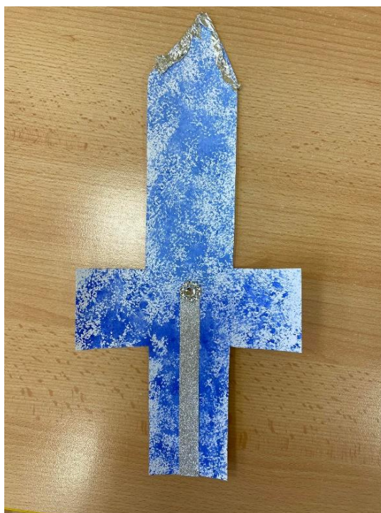
Obrázek 10 Předloha meče