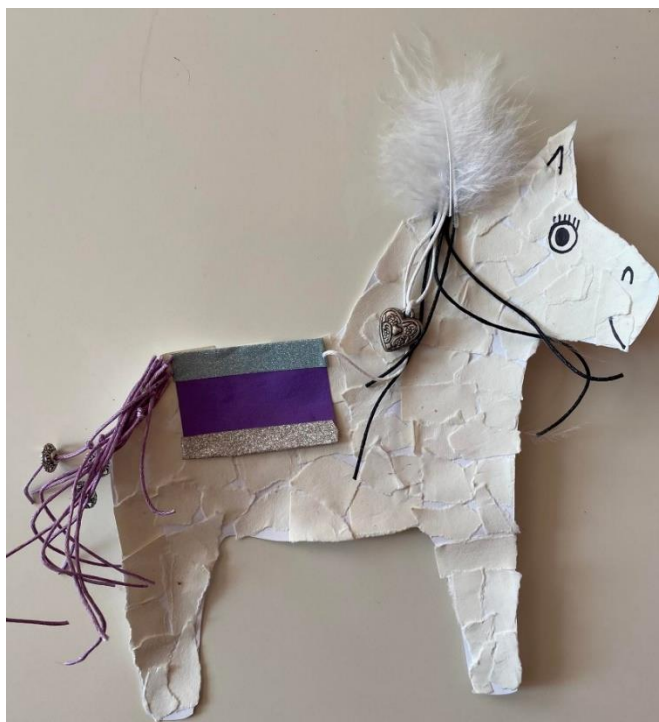
Obrázek 9 Předloha koně