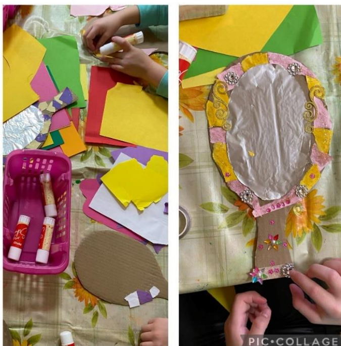
Obrázek 3 Trhání papíru, lepení papíru a zdobení zrcadla