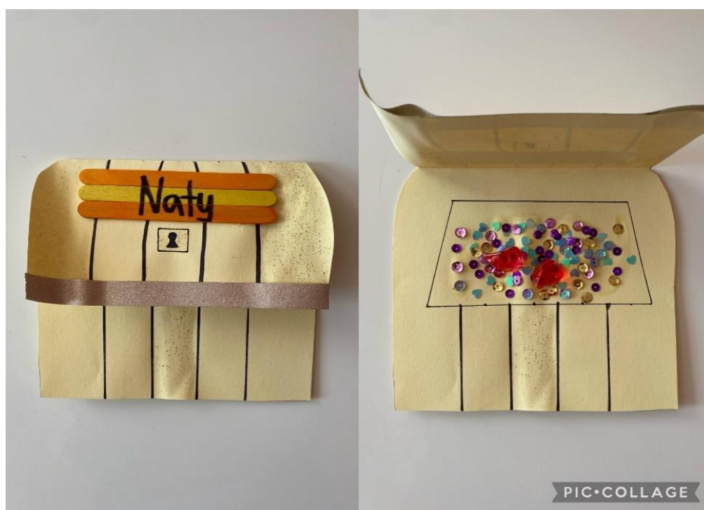
Obrázek 5 Předloha truhly