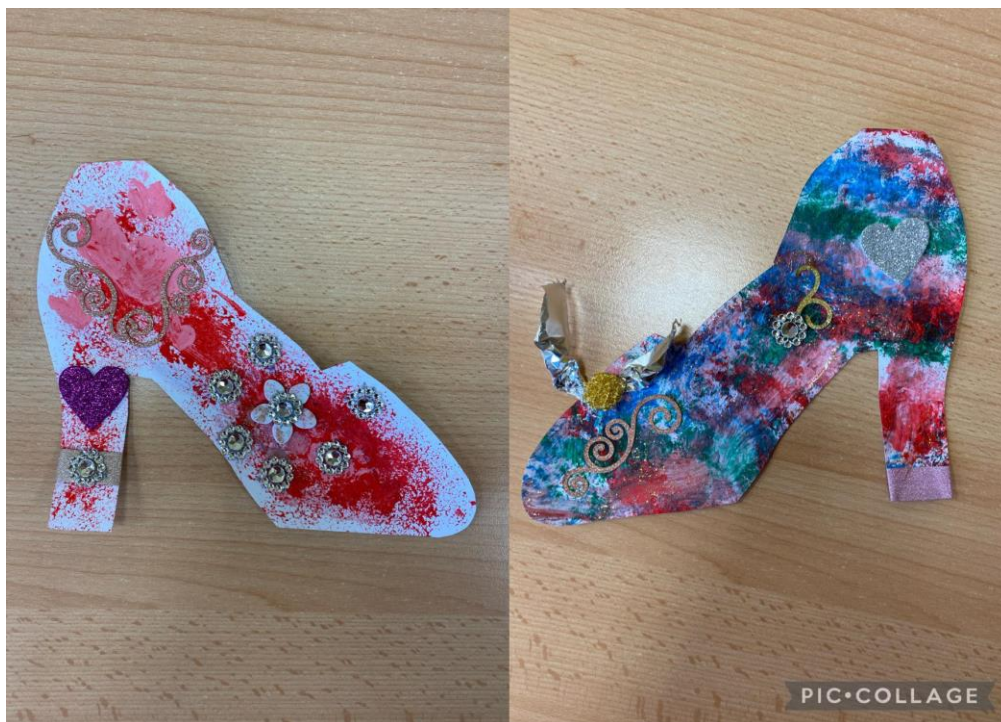
Obrázek 13 Hotové střevičky

jsem pro ně měla dostatečné množství ozdob. Pokud by bylo dětí více, potřebovala bych mít pro děti větší množství ozdob.