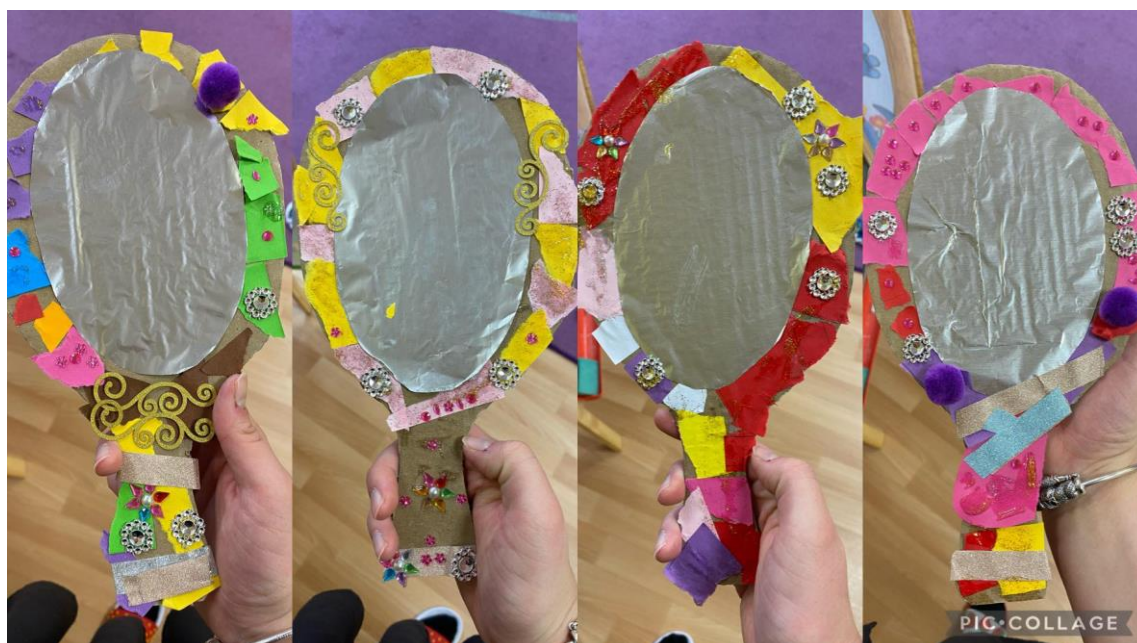
Obrázek 12 Hotová zrcadla