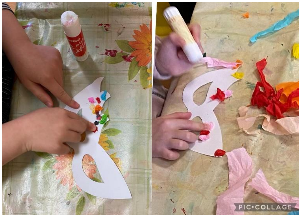
Obrázek 7 vytváření kuliček a lepení na šablonu