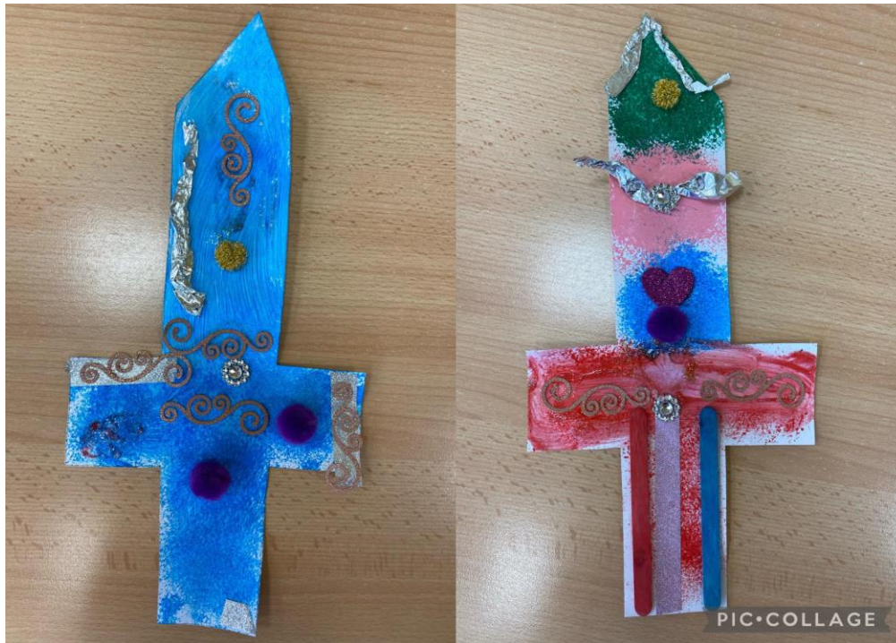
Obrázek 14 Hotové meče