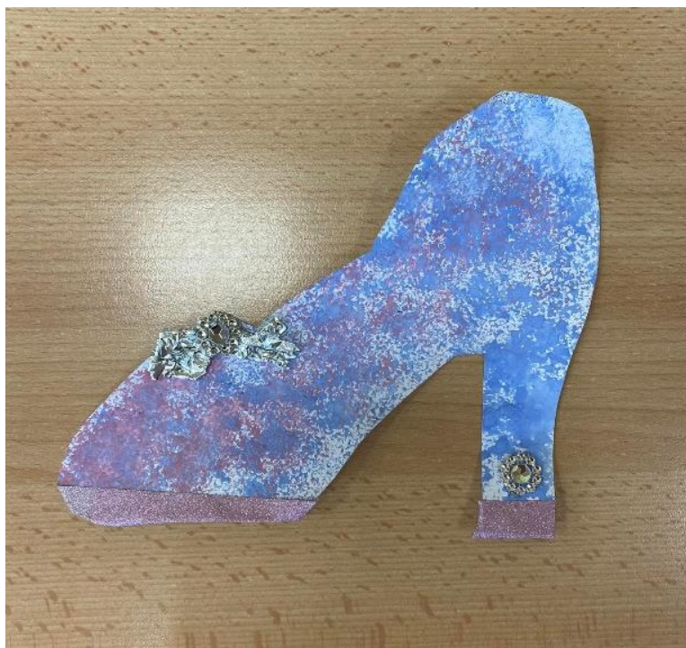
Obrázek 4 Předloha střevíčku