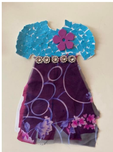
Obrázek 6 Předloha šatů