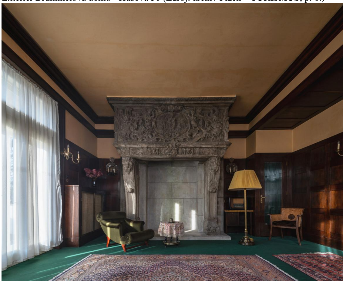
Obývací pokoj, Brummelův dům - Husova 58