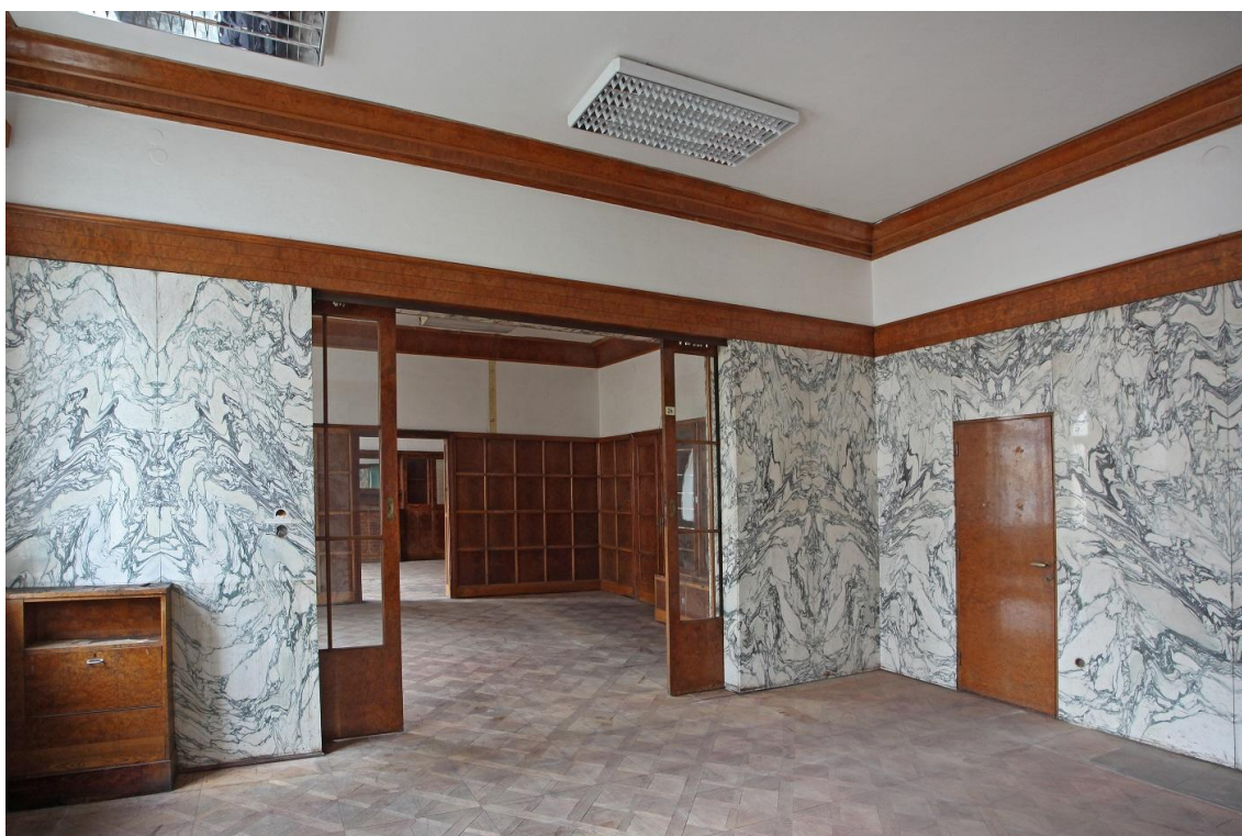
Interiér, byt Hugo Semlera - Klatovská 19