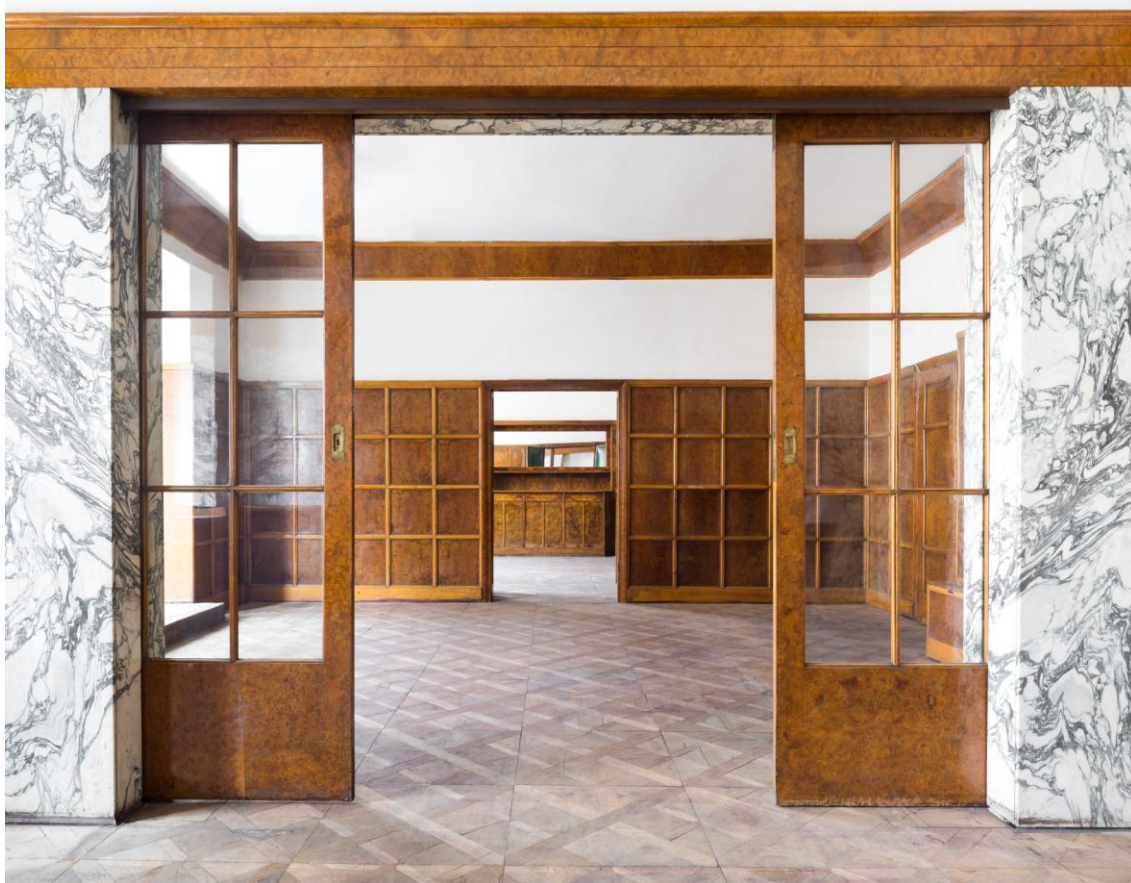
Interiér, byt Hugo Semlera - Klatovská 19