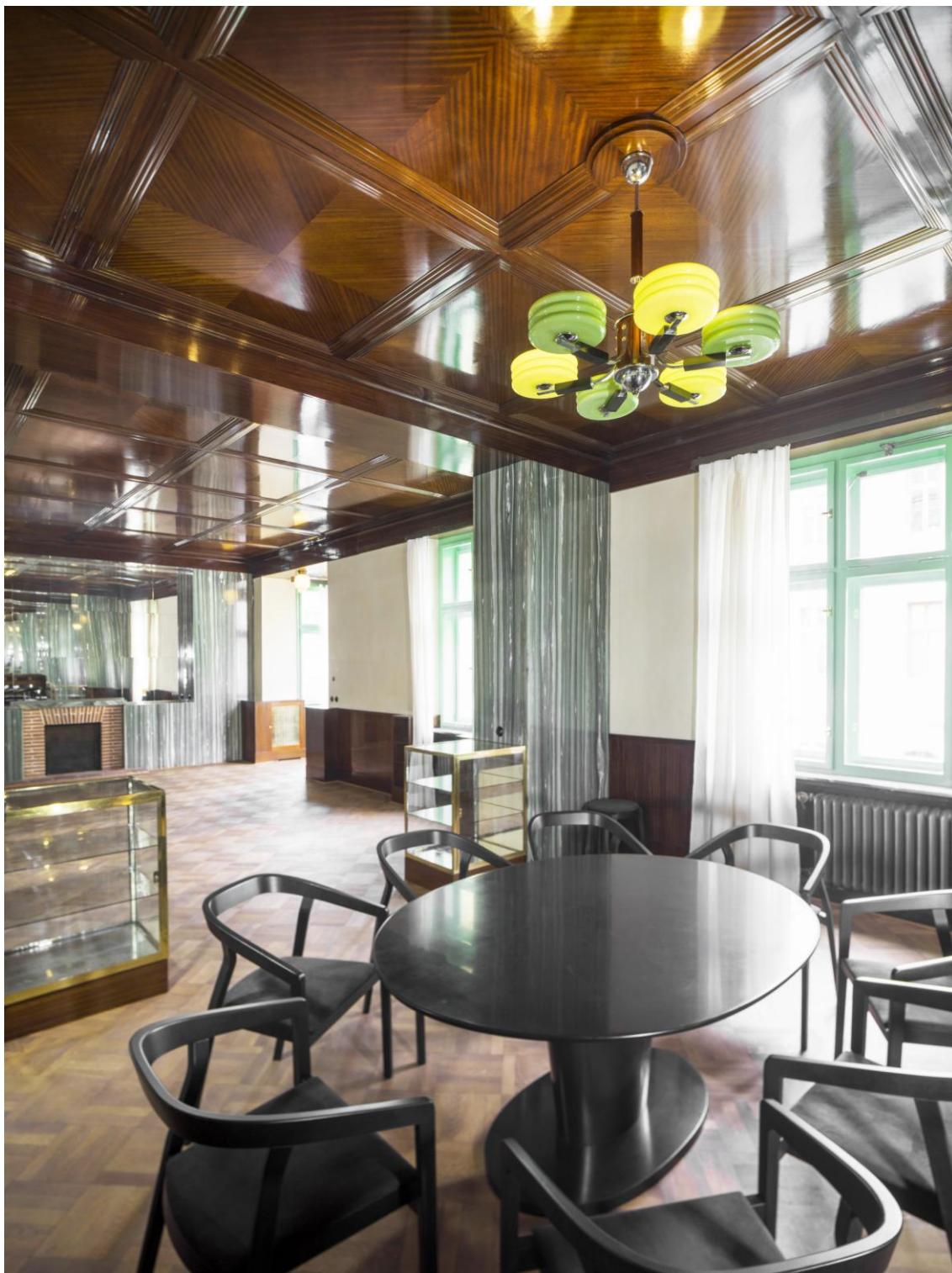
Jídelna rodiny Krausových - Bendova 10