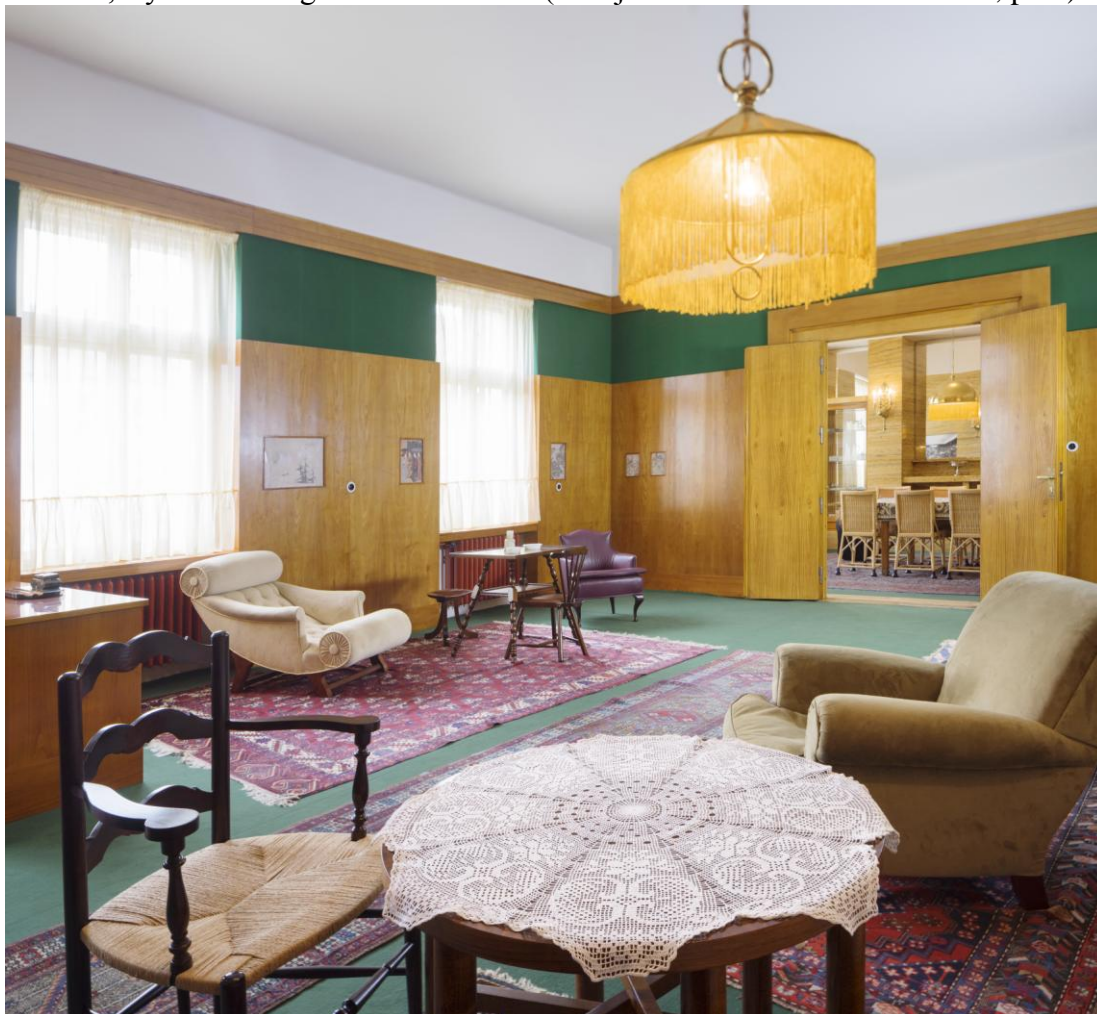
Obývací pokoj v bytě Josefa Vogla - Klatovská 12