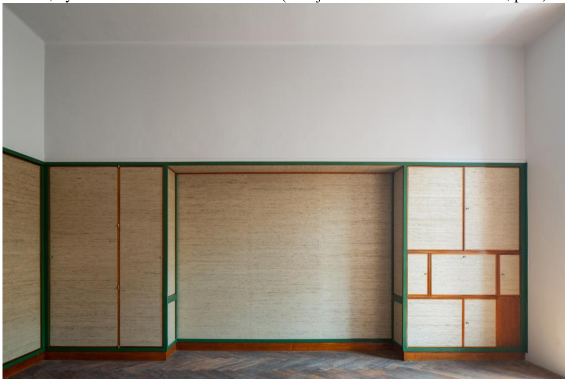
Interiér, byt Richarda Hirsche - Plachého 6