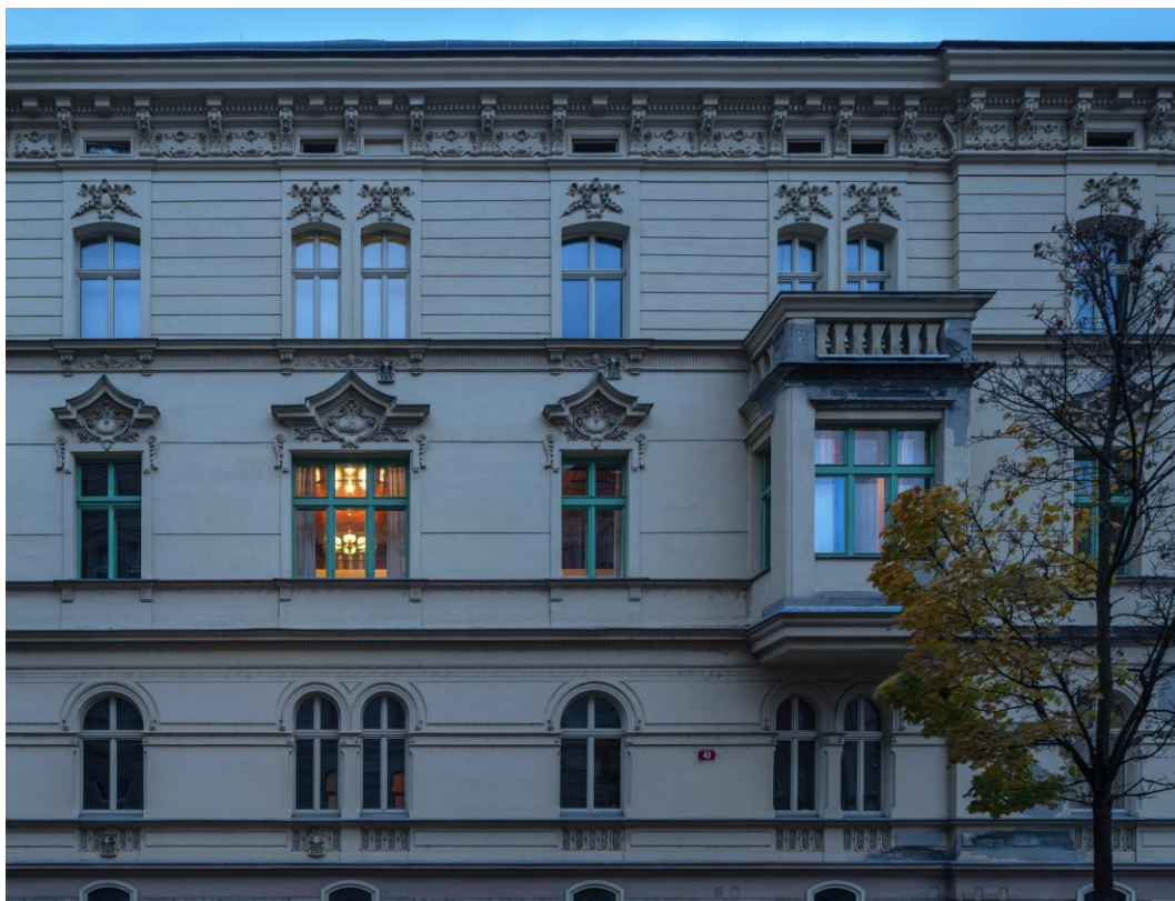
Exteriér, byt rodiny Krausových - Bendova 10