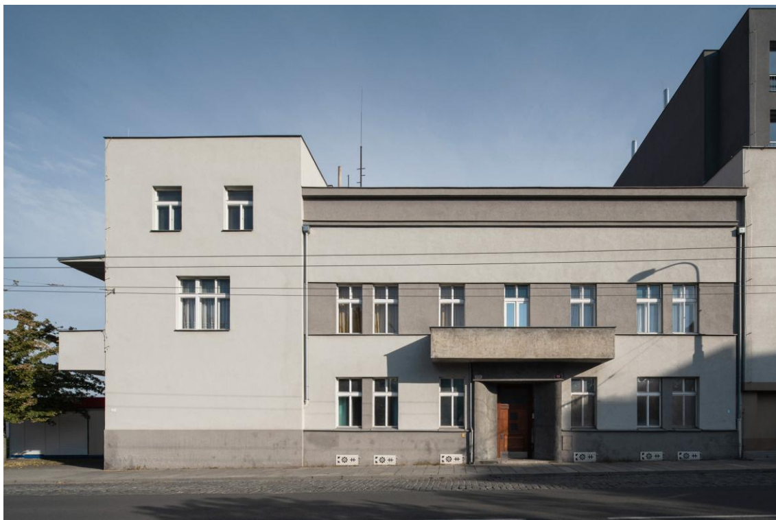
Exteriér Brummelova domu - Husova 58