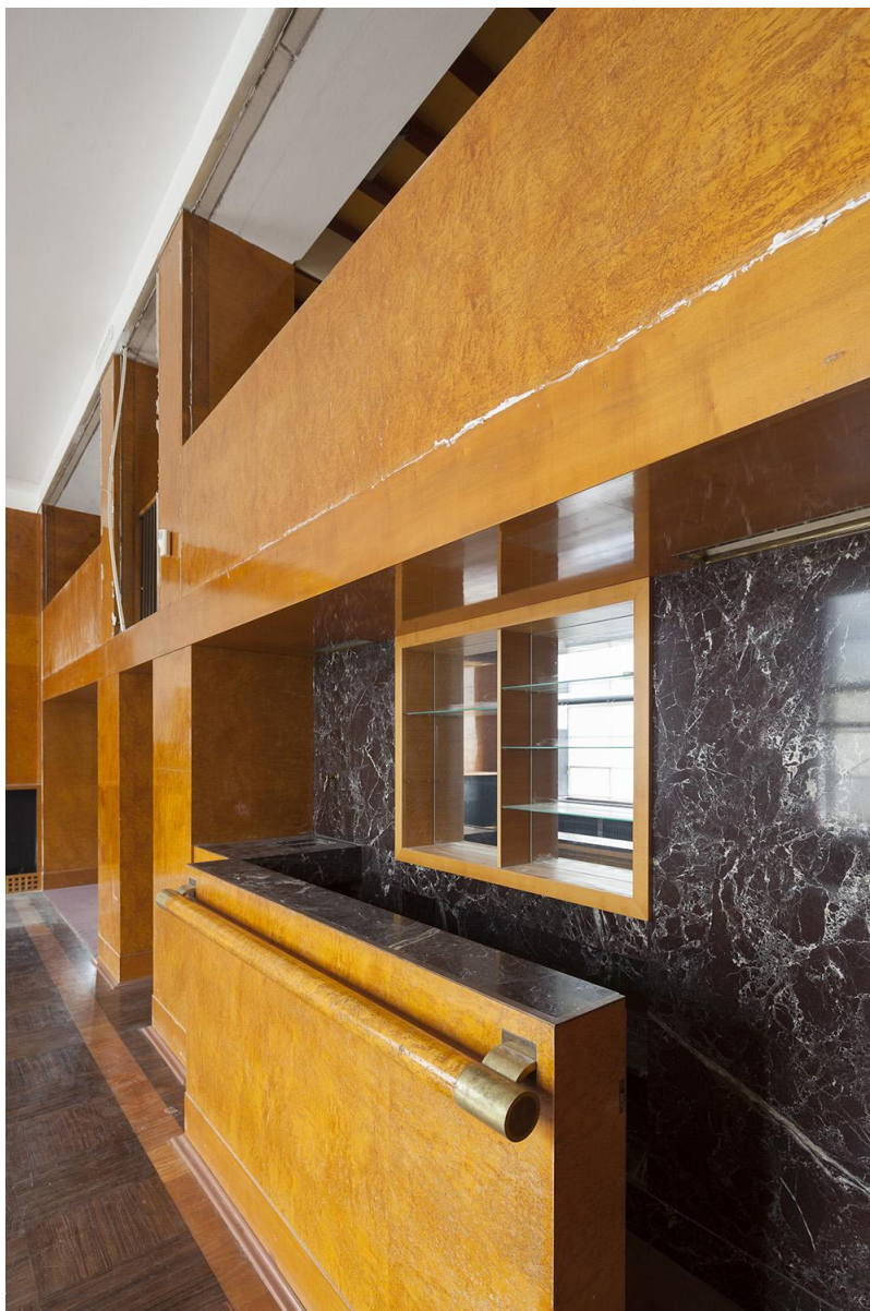
Interiér, Semlerova rezidence, Klatovská 110