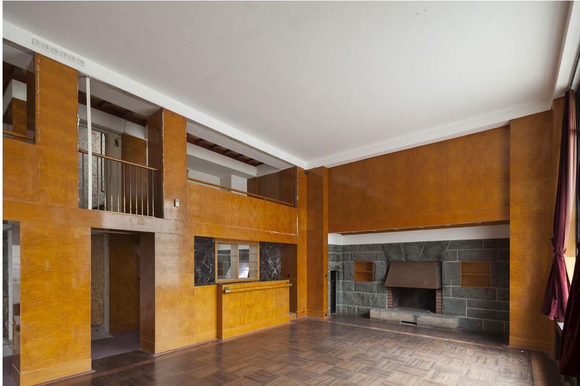
Interiér, Semlerova rezidence, Klatovská 110