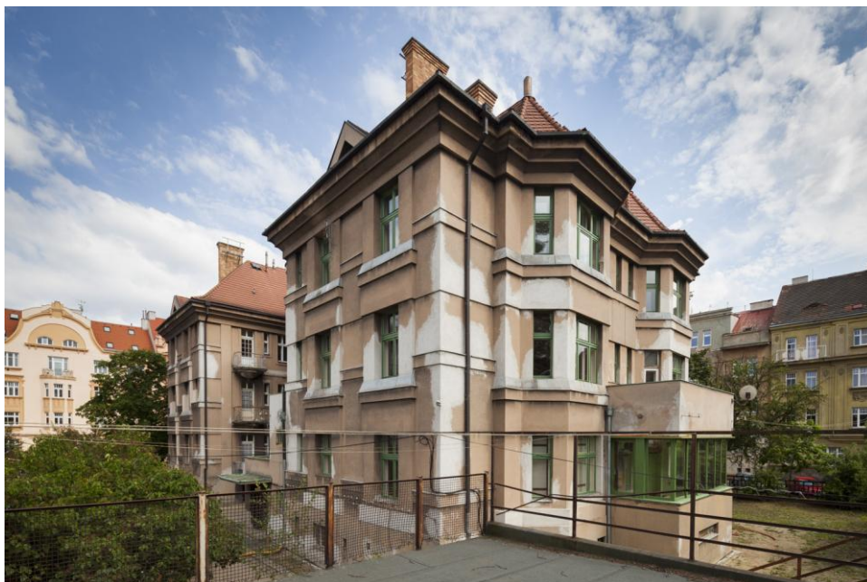
Exteriér, Semlerova rezidence, Klatovská 110