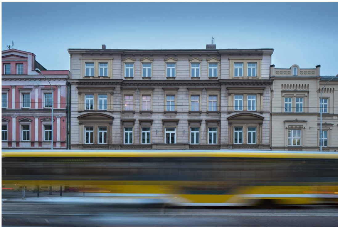
Exteriér, Byt Josefa Vogla - Klatovská 12