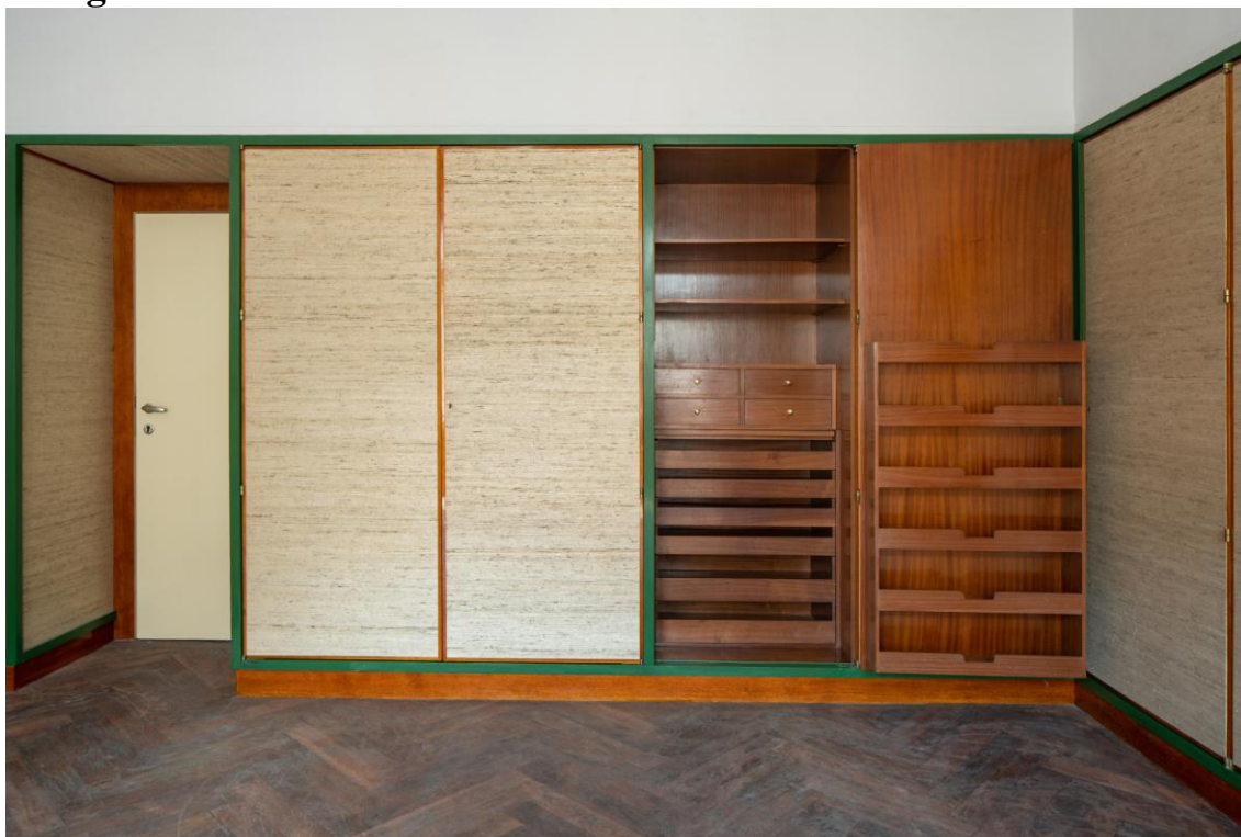
Interiér, byt Richarda Hirsche - Plachého 6