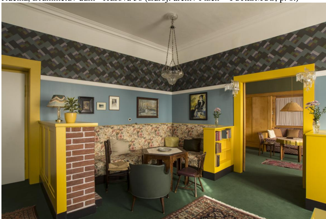
Obývací pokoj Hedviky Liebsteinové, Brummelův dům - Husova 58