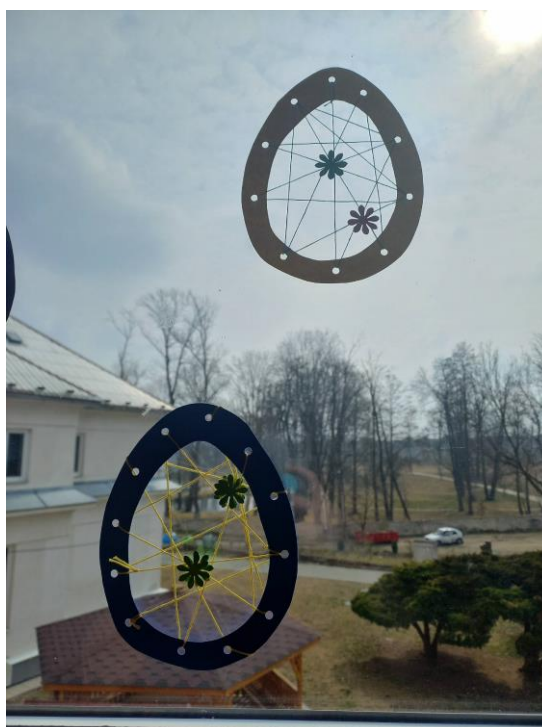
Obrázek č. 27 – Vajíčka (vlastní foto)

Přepřacováno z: https://www.pinterest.com.au/pin/823384744383212865/ , Anna Valová