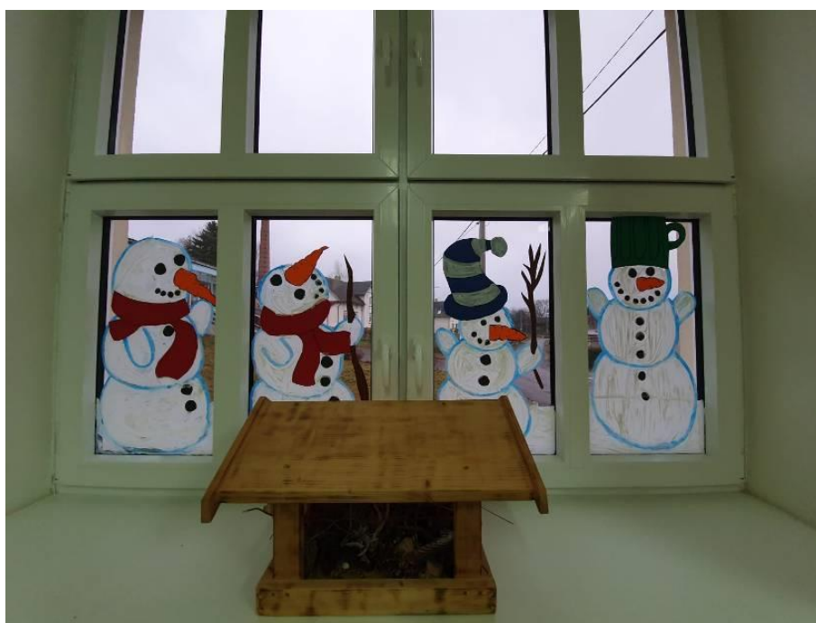
Obrázek č. 20 – Sněhuláci