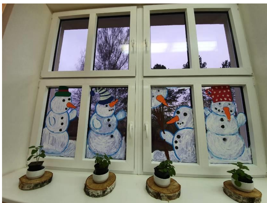
Obrázek č. 21 – Sněhuláci (vlastní foto)