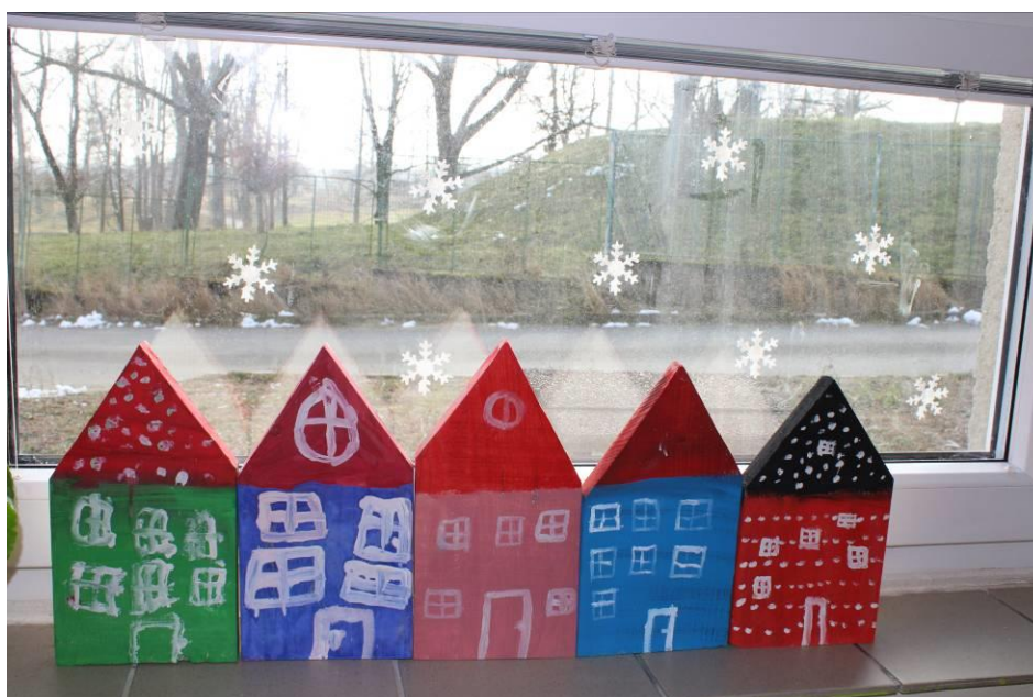
Obrázek č. 19 – Domečky