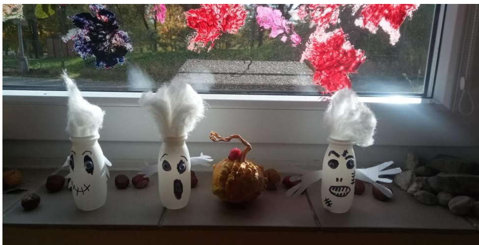
Obrázek č. 7 – Duchové