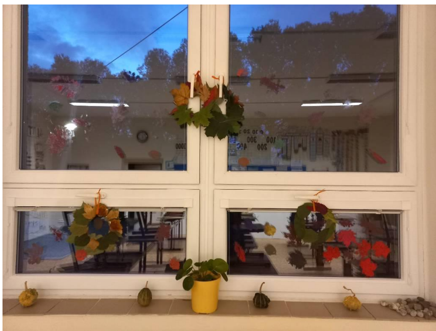
Obrázek č. 6 – Obtisk listů

Závěr hodiny: Každý žák měl za úkol obtisknout 5 různých listů. Po dokončení jsme uznali za vhodné, že někde ještě nějaké listy schází. Když jsem se zeptala pár žáků, proč dávají ze začátku listy na jedno místo, řekli, že dělají hromadu listů. Zbytek dával listy různorodě, jako když venku například fouká vítr. Tuhle činnost, kdy si mohli temperou nazdobit okno, dělali poprvé a bylo na nich vidět, že se těší, ale zároveň znejistili, jestli opravdu mohou. Následovala otázka, kdo ty okna bude mýt? Shodli jsme se na tom, že kdo si výzdobu udělá, musí si jí umýt. Těsně před svatým Martinem jsme společně okna umyli. To mi přišlo také velmi přínosné. Žáci byli velmi spokojení, když všechna práce byla na nich. Jeden z žáků měl bohužel nějaké kvalitní tempery, které z okna nešly smýt. Pozorovali jsme i různorodost temperových barev.