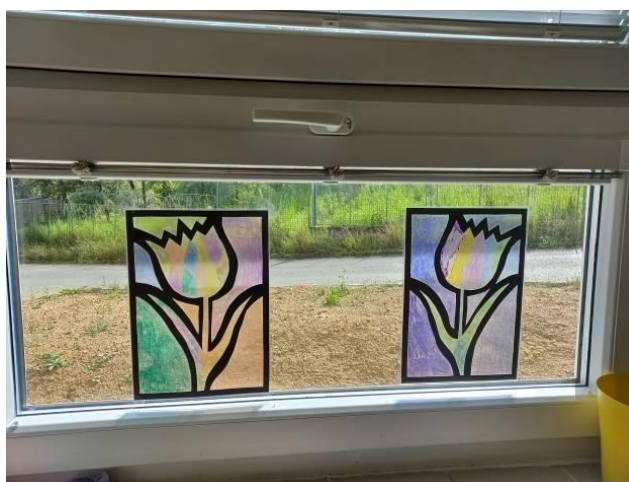
Obrázek č. 23 – Tulipány