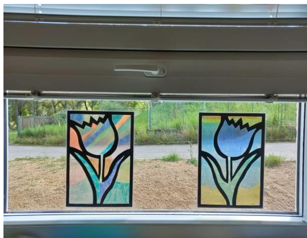
Obrázek č. 22 – Tulipány

Inspirováno z: https://www.promaminky.cz/kreativni-dilna/obrazky-pranicka-pohlednice-aj-266/jarni-vitraz-922