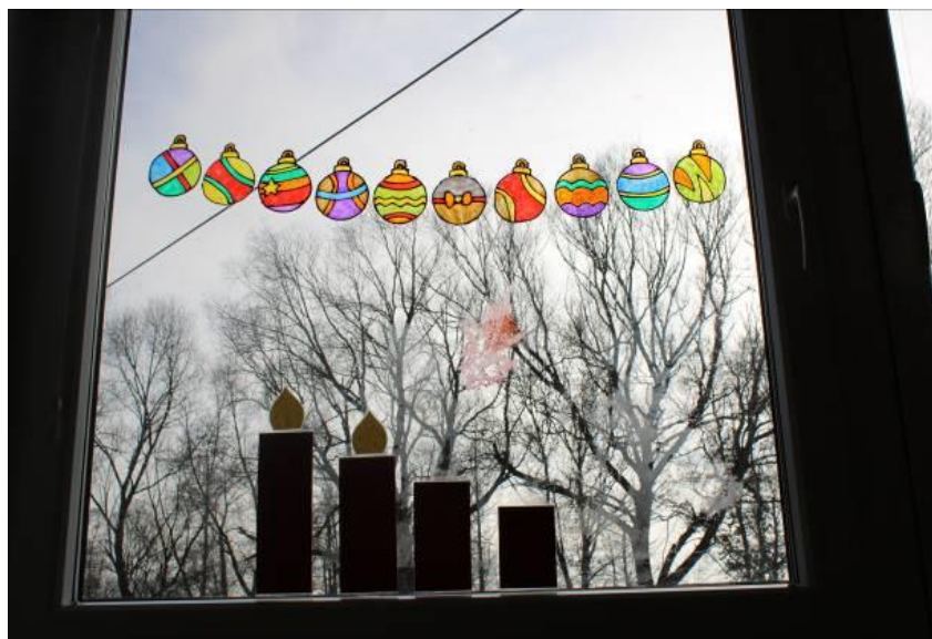
Obrázek č. 12 – Adventní kalendář 10. prosince

pokračoval dále. Každý si vyrobil svoje originální ozdoby, kterými jsme odpočítávali dny do Vánoc. Losovali jsme, v jakém pořadí budou žáci na okno lepit svoje ozdoby, aby se nehádali. Končili jsme 20. prosince v pondělí, kdy nám hořely už všechny čtyři svíčky. Na konci dne jsme dolepili poslední čtyři ozdoby (viz šablona č. 4), aby byly připravené na Štědrý den. Žáci opět ukázali svoji fantazii a následně projevíli zájem a radost celý prosinec se věnovat tomuto tématu, na který se všichni moc každý rok těšíme.