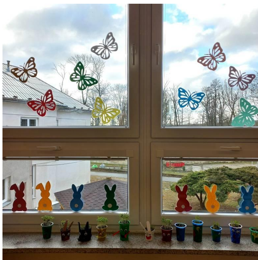
Obrázek č. 24 – Motýlci

Inspirováno z: https://www.napadyproanicku.cz/tvoreni-s-detmi/jaro/385-motyl-na-okno