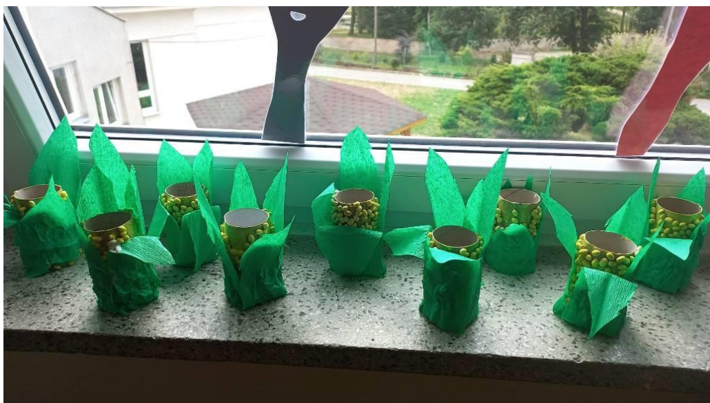
Obrázek č. 3 – Kukuřice (vlastní foto)

Přepřacováno z: https://www.preschoolactivities.us/fruit-craft-idea-for-kids-3/toilet-paper-roll-corn-craft/