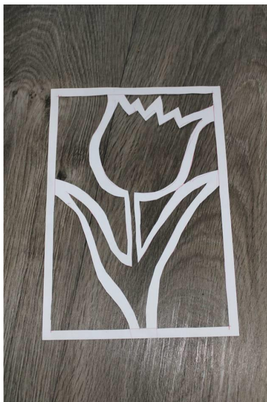
Příloha č. 6