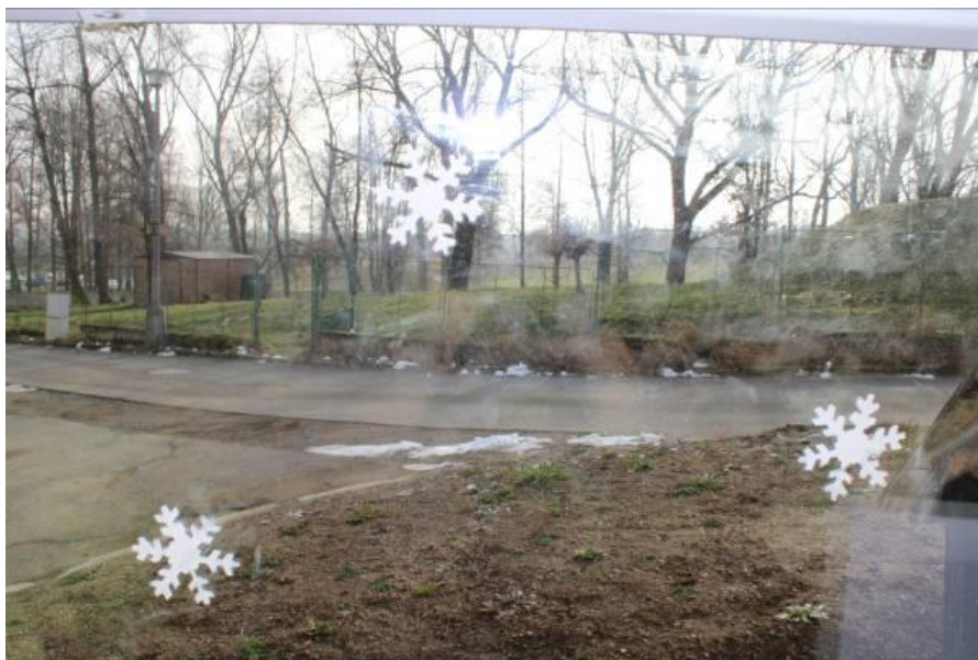
Obrázek č. 14 – Vločky

plochy a krásná struktura oproti rovným tahům se štětcem. Hlavně bychom se do vločky rovnými tahy nedostali, tupováním se pokryl každý kout vločky. K nevýhodám se jeden žák přidal s tím, že by nechtěl tupovat takhle celou místnost i větší houbičkou, také se do všeho nehodí. Zhodnotili jsme, co by se dalo zlepšit a co se nám naopak velmi povedlo. Žáci byli spokojeni se svojí prací, která nám nádherně vyzdobila zimní třídu.