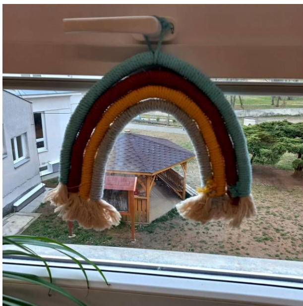
Obrázek č. 31 – Drhaná duha (vlastní foto)

Přepřacováno z: https://tchiboblog.cz/duha-do-pokojicku-diy/