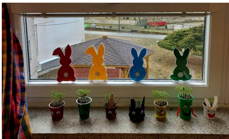
Obrázek č. 25 – Osivo 18. března 2022

Inspirováno z: https://primainspirace.cz/2021/03/14/privitejte-jaro-jiz-v-oknech-inspirace-na-krasne-dekorace-ktere-vyzdobi-vase/#.YE6DuEF85kQ .pinterest