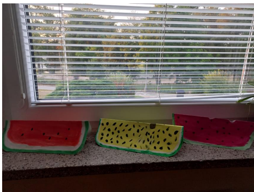
Obrázek č. 30 – Melouny