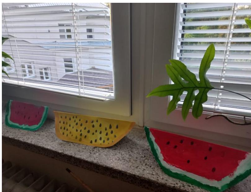
Obrázek č. 29 – Melouny