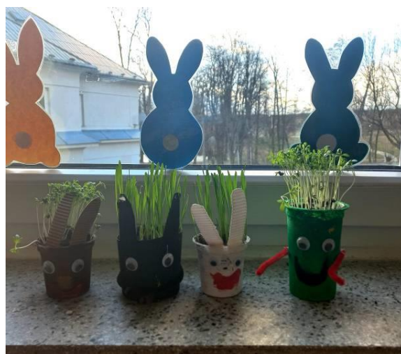
Obrázek č. 26 – Osivo 21. března 2022