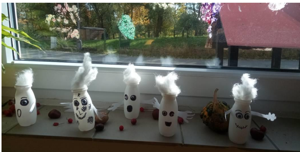
Obrázek č. 8 – Duchové