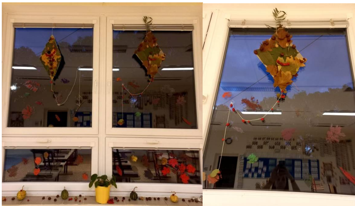
Obrázek č. 4 – Draci z přírodnin (vlastní foto) Obrázek č. 5 – Drak z přírodnin (vlastní foto)

Inspirováno z: https://www.i-creative.cz/2014/09/23/sestavovani-obrazku-z-prirodnin/