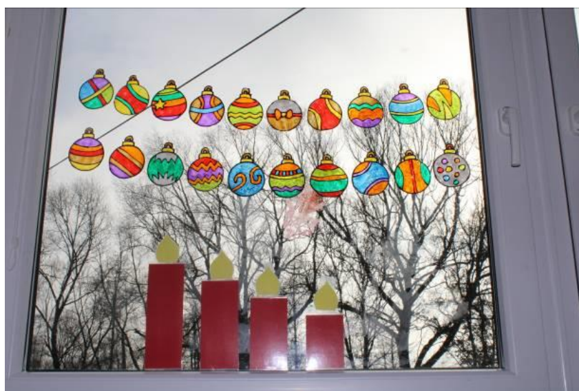
Obrázek č. 12 – Adventní kalendář 20. prosince