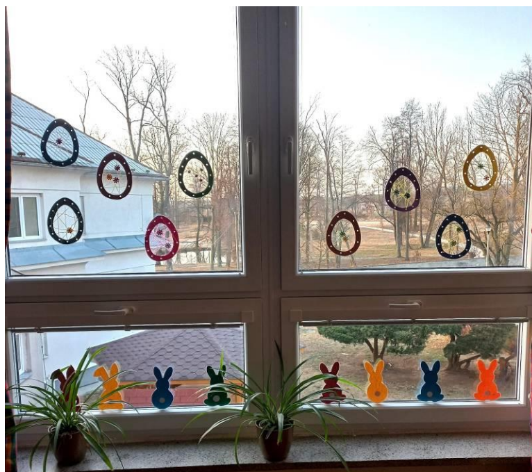
Obrázek č. 28 – Vajíčka