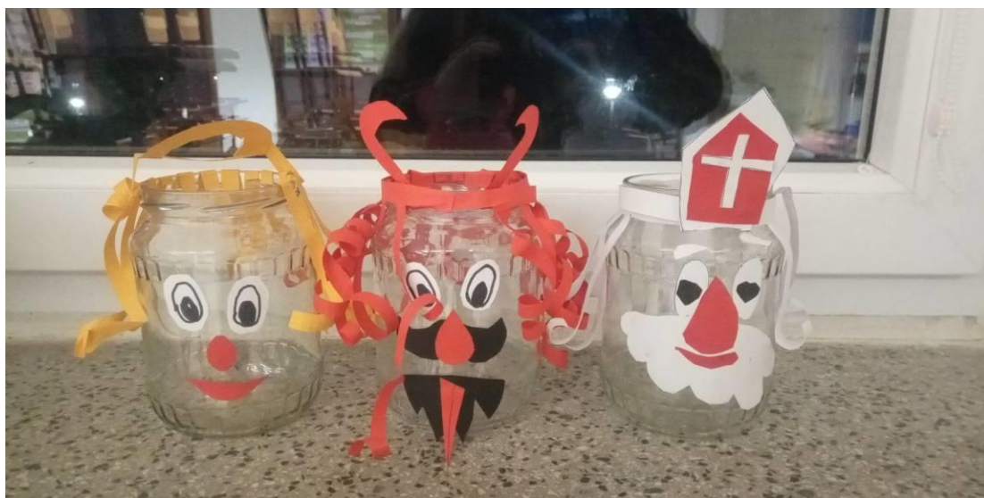
Obrázek č. 16 – Čert, Mikuláš a anděl – bez svíčky

Přepřacováno z: https://www.maxikovakuchynka.cz/vesele-svicinky/