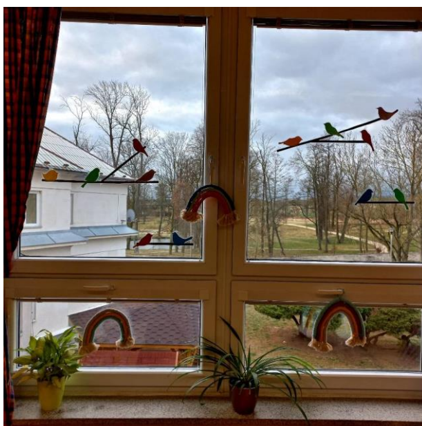
Obrázek č. 32 – Drhané duhy