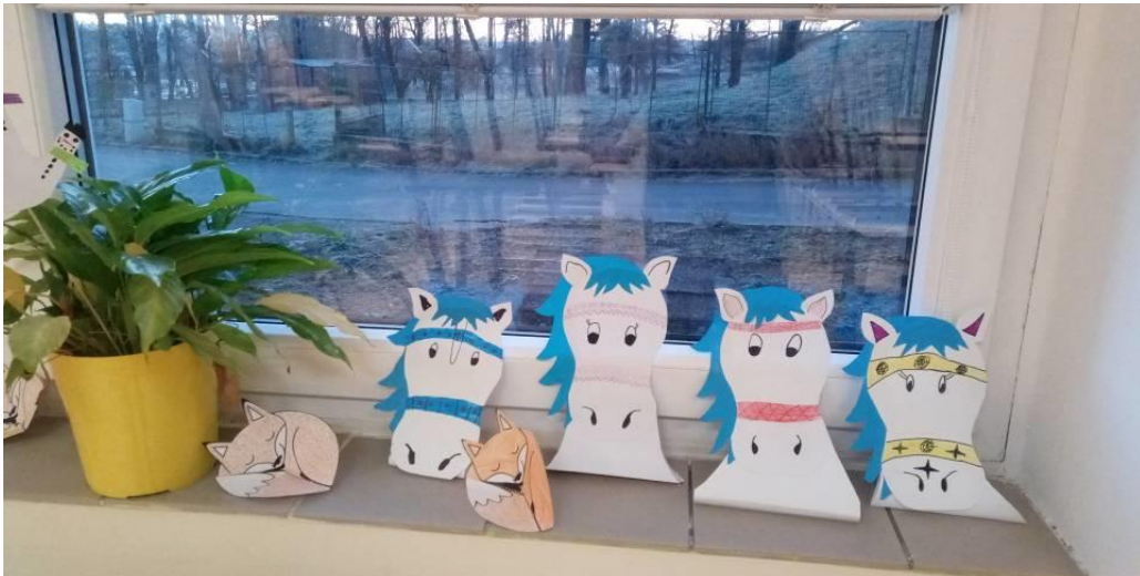
Obrázek č. 9 – Koně sv. Martina