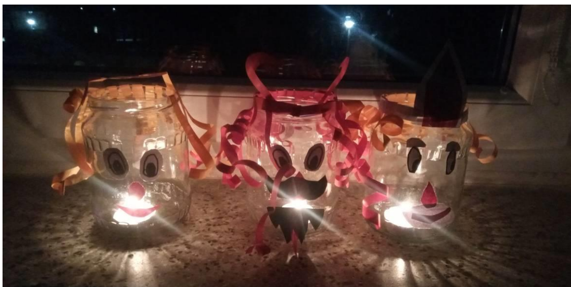
Obrázek č. 17 – Čert, Mikuláš a anděl – osvětlené svíčkou