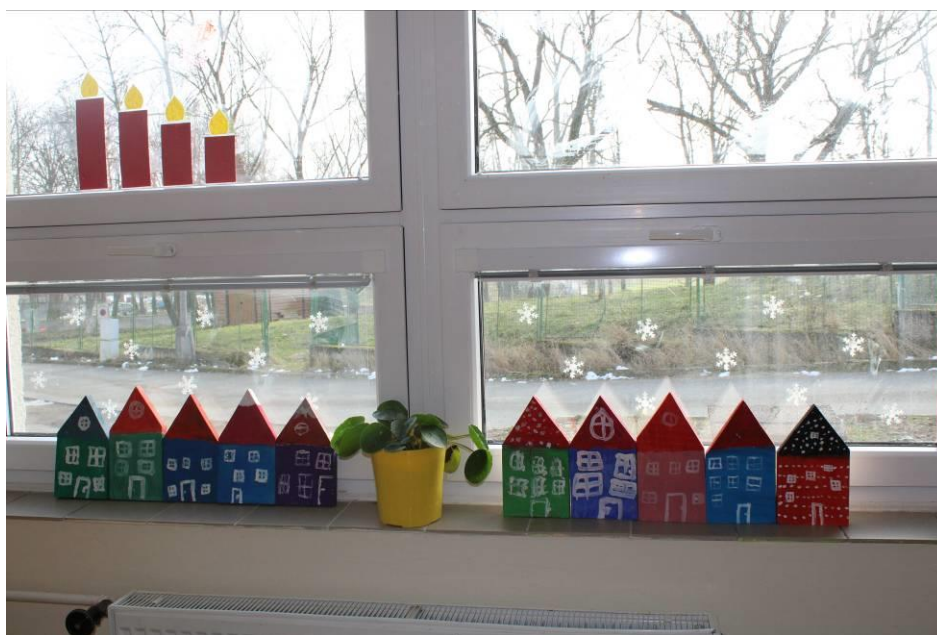
Obrázek č. 18 – Městečko Hostouňov

Inspirováno z: https://www.fynesdesigns.com/gingerbread-house-christmas-wood-ornaments/