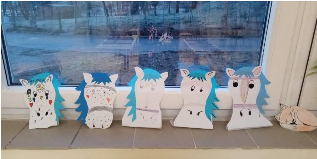
Obrázek č. 10 – Koně sv. Martina