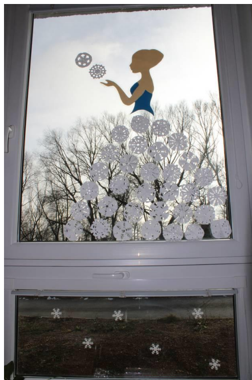
Obrázek č. 11 – Zimní víla

Inspirováno z: https://www.pinterest.com.au/pin/823384744379902269/