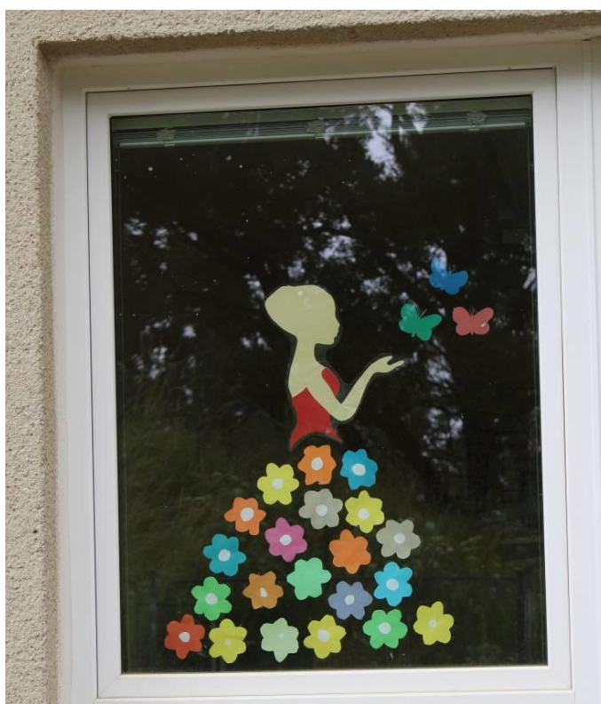
Obrázek č. 1 – Letní víla

Přepřacováno z: https://www.hikendip.com/diy-easter-window-decorations/