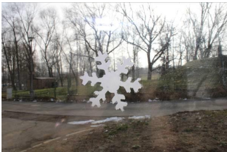
Obrázek č. 15 – Vločka