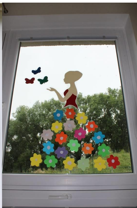
Obrázek č. 2 – Letní víla