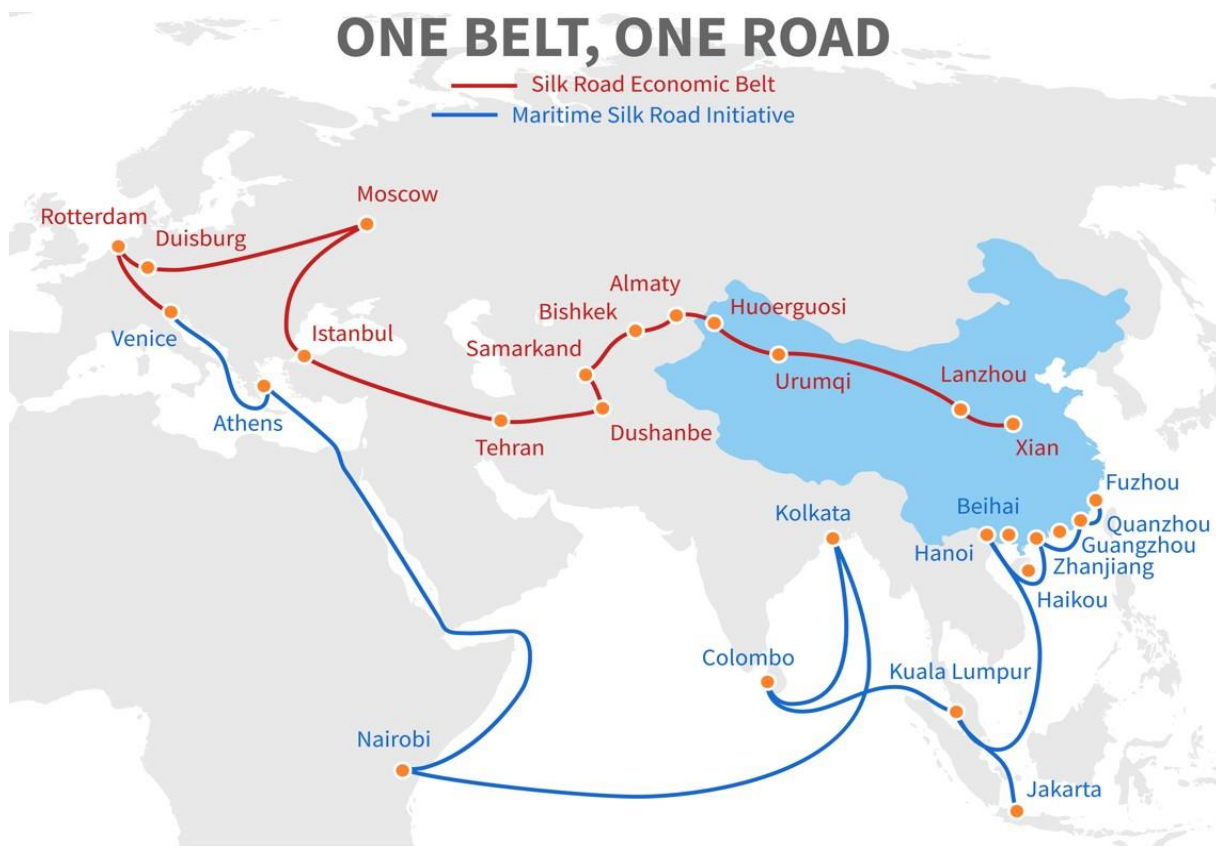
Obrázek 1: Hlavní směry BRI