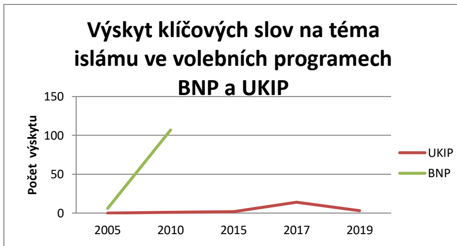
Graf č. 3: Výskyt klíčových slov na téma islámu ve volebních programech BNP a UKIP