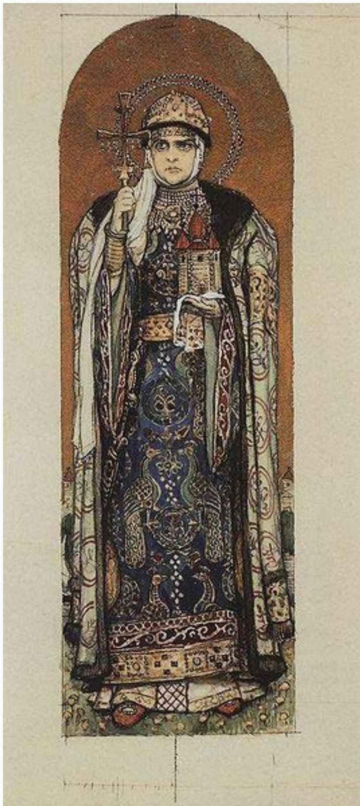
Příloha č. 2: Obrázek kněžny Olgy 115