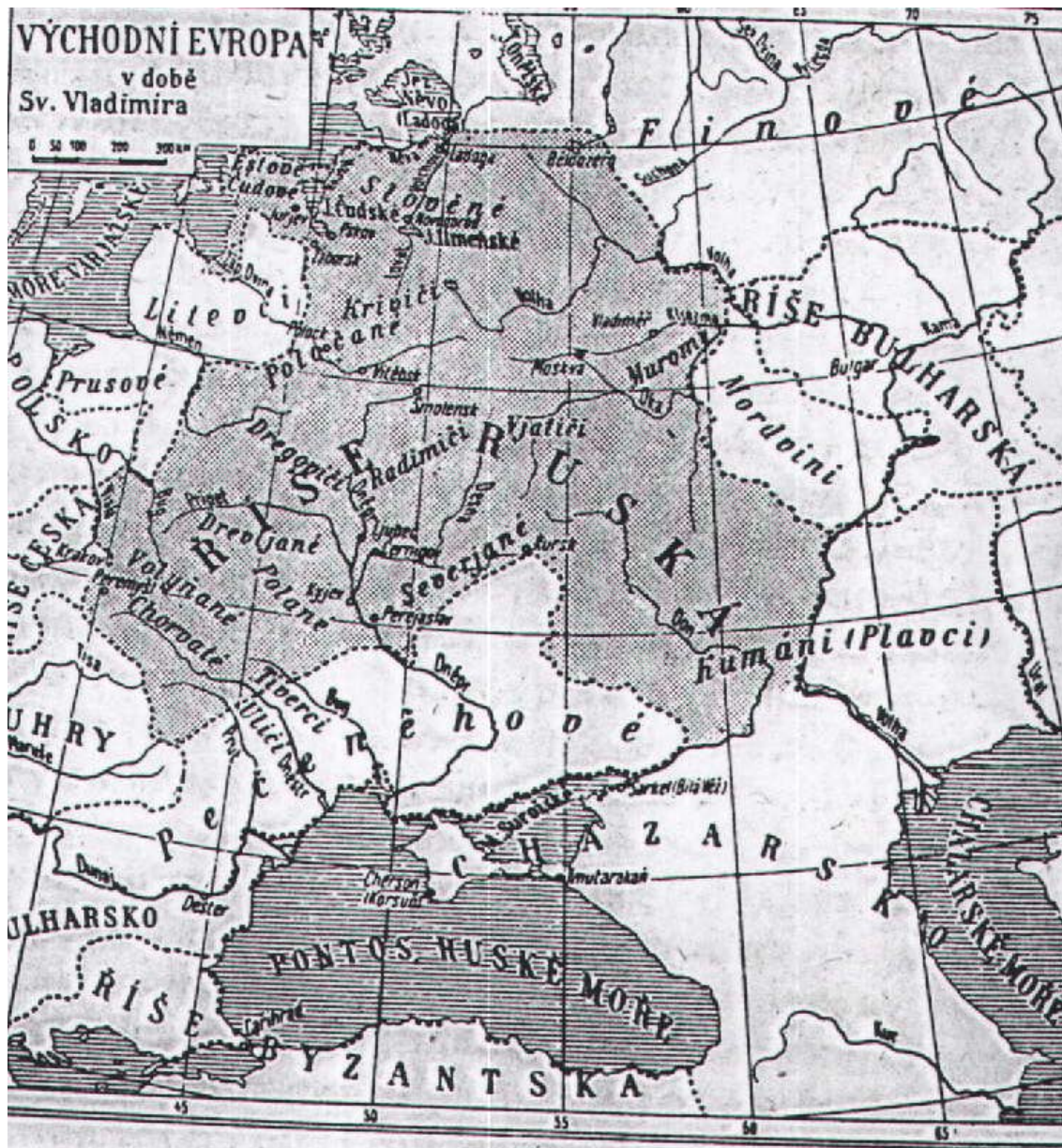
Příloha č. 4: Mapka z doby vlády Svatého Vladimíra 117