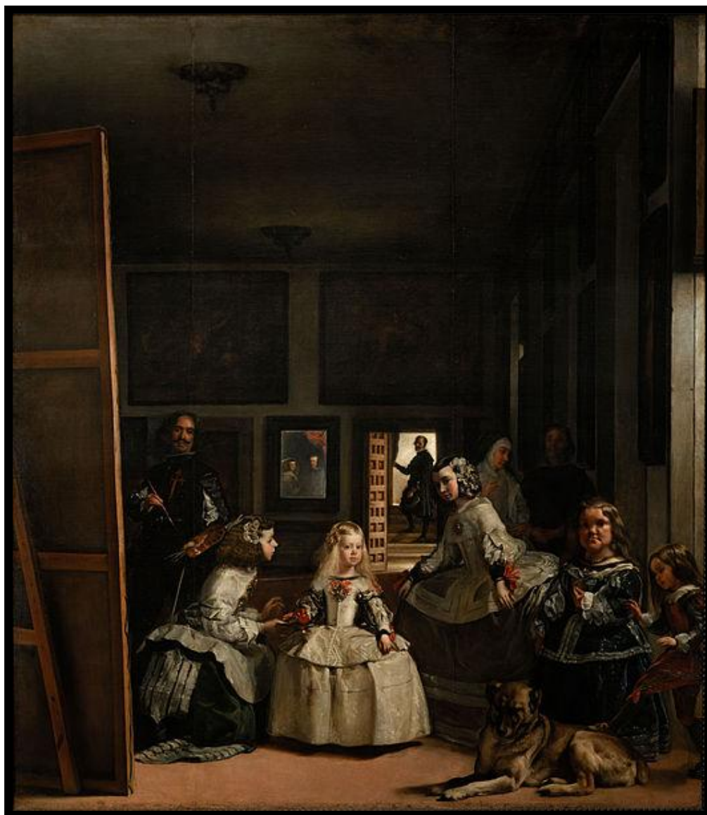
1. Diego Rodríguez de Silva y Velázquez: Dvorní dámy

zdroj: http://www.artmuseum.cz/umelec.php?art_id=670