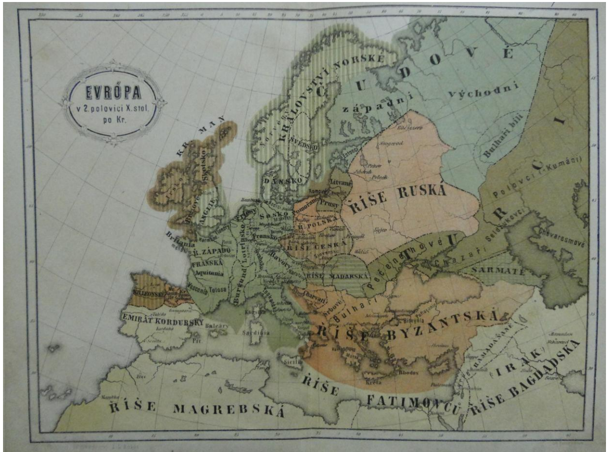
Příloha č. I. Politické uspořádání Evropy a přilehlých zemí v 2. pol. 10. století.