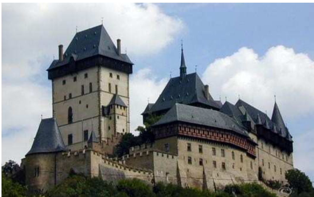
Obrázek 7 Karlštejn