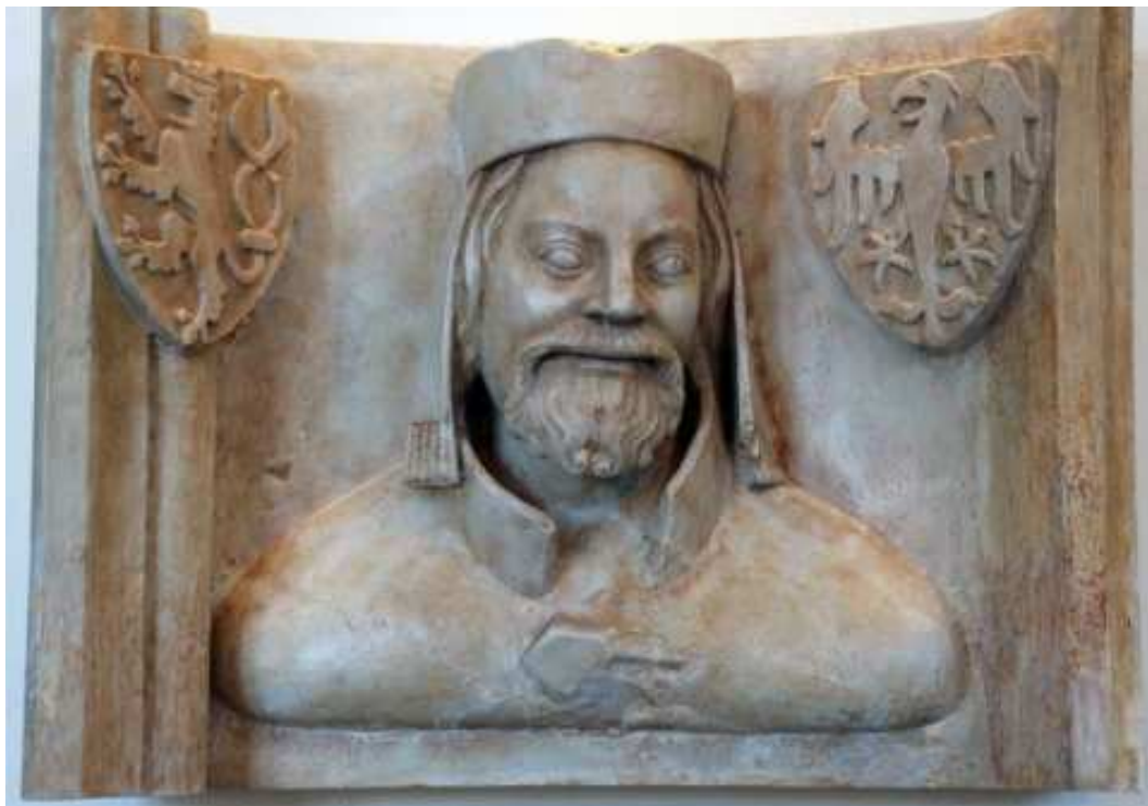
Obrázek 2 Karel IV.