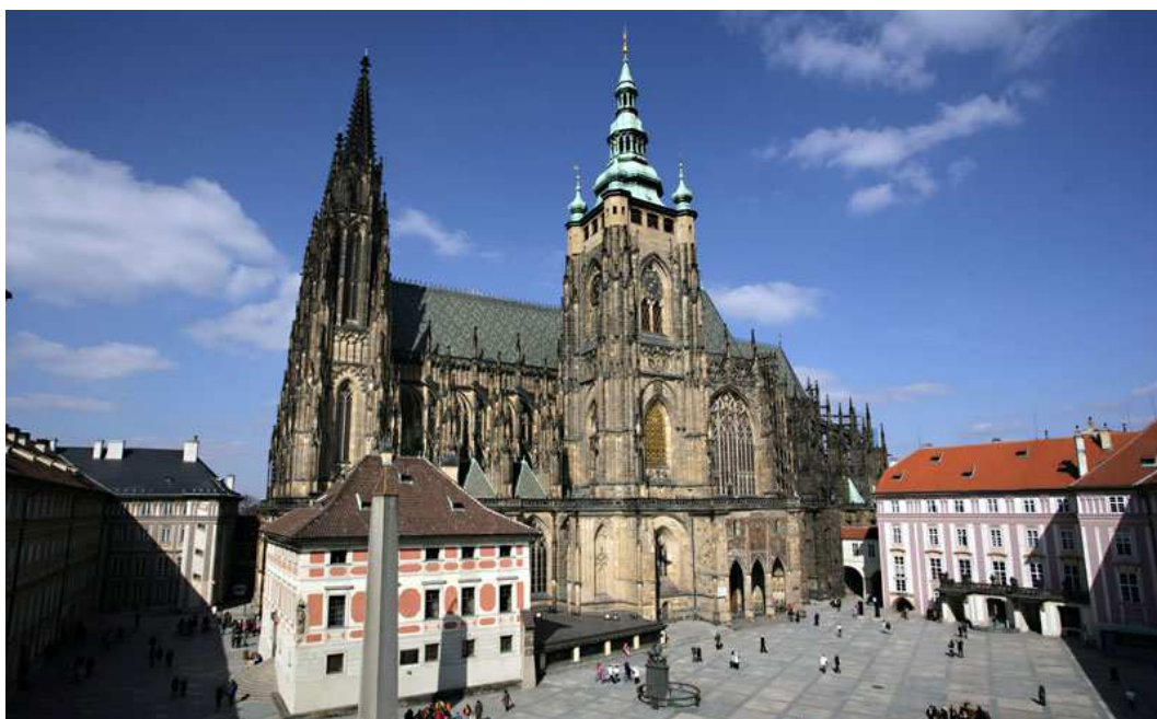
Obrázek 9 Katedrála Sv. Víta