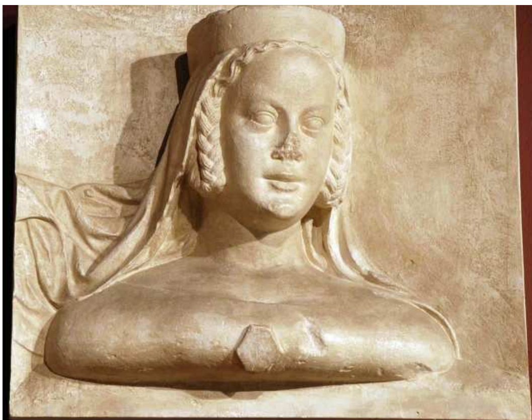
Obrázek 3 Blanka z Valois