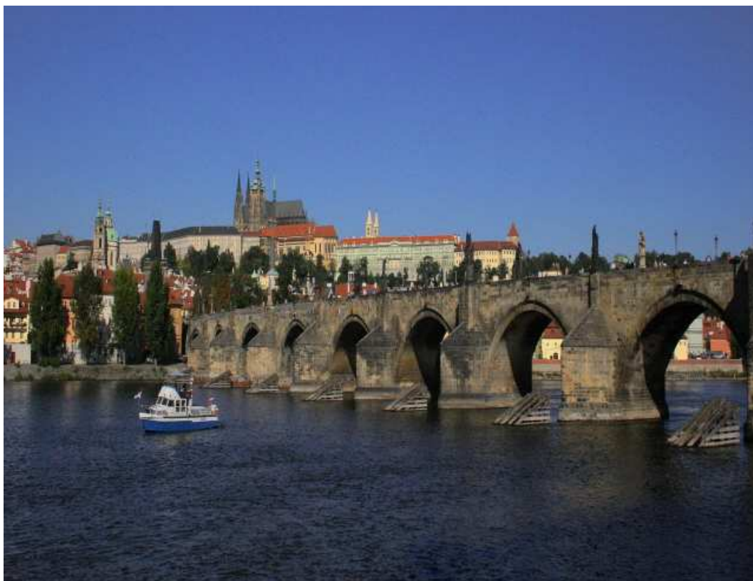
Obrázek 8 Karlův most