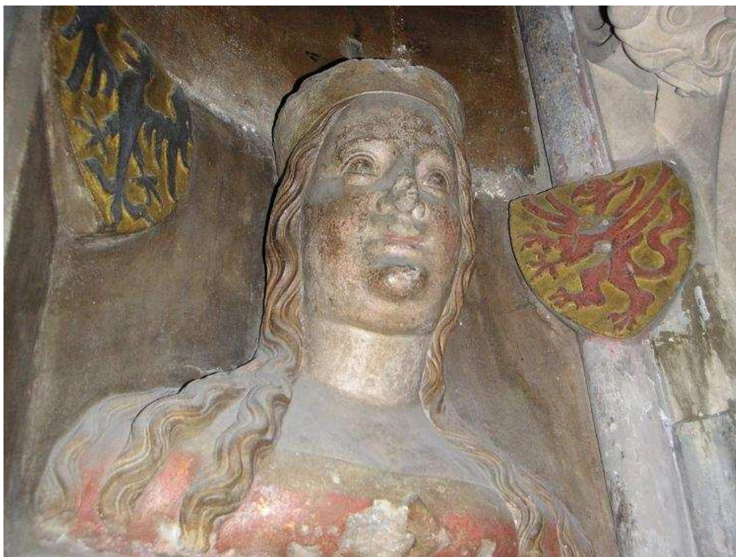
Obrázek 6 Alžběta Pomořanská