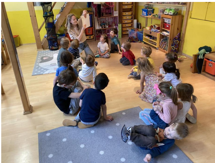
Příloha 7b: Hádání obrázků květin a jarních obrázků podle detailu