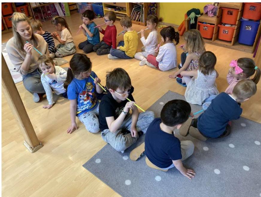
Příloha 9: Artikulační cvičení se sluníčkem