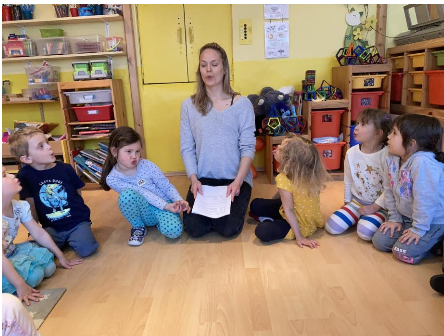
Příloha 12b: Artikulační pohádka o jazýčku