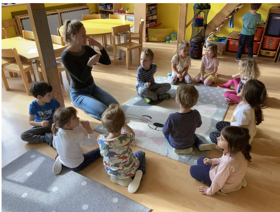
Příloha 4b: Dechové cvičení Vůně květin