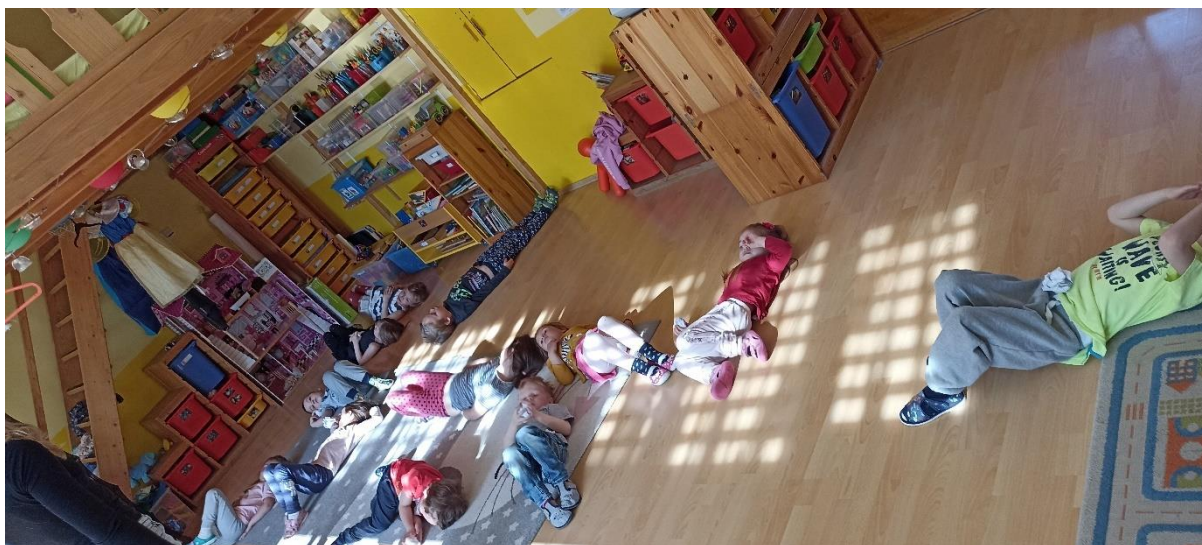
Příloha 2a: Hudebně pohybová hra Plížená