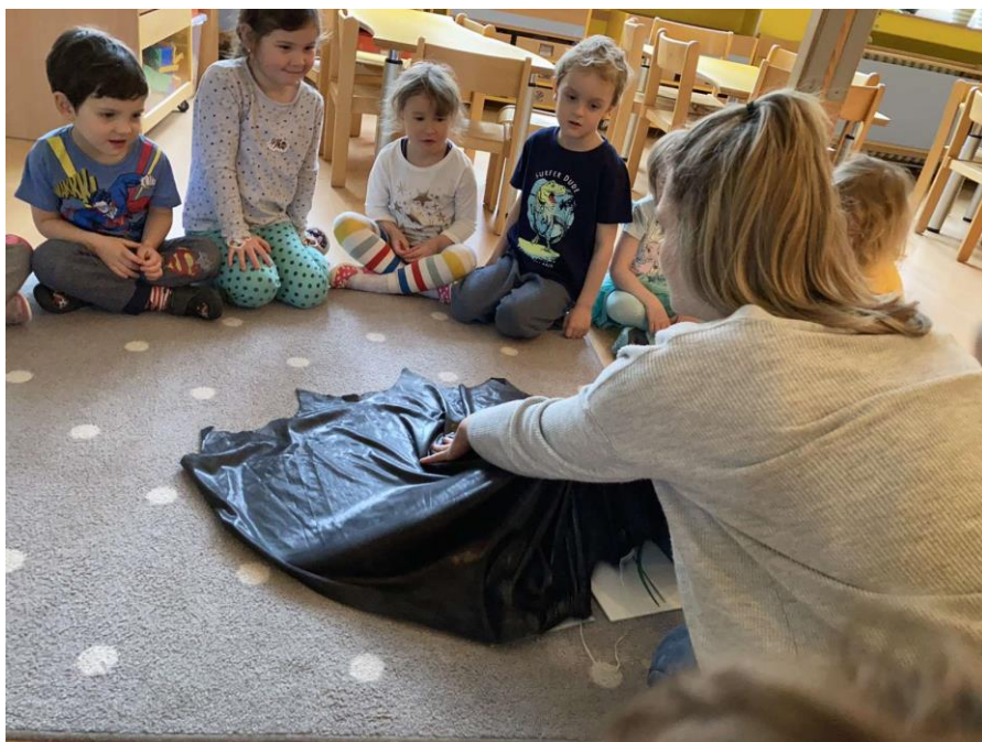
Příloha 16: Na včelky