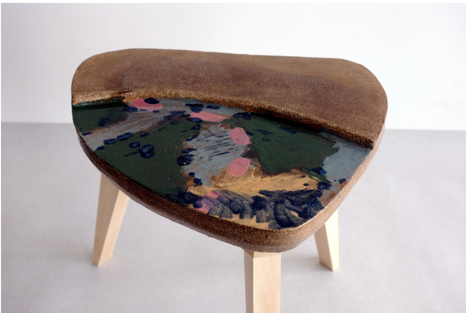
Obr. 29: Druhá varianta vyvýšeniny