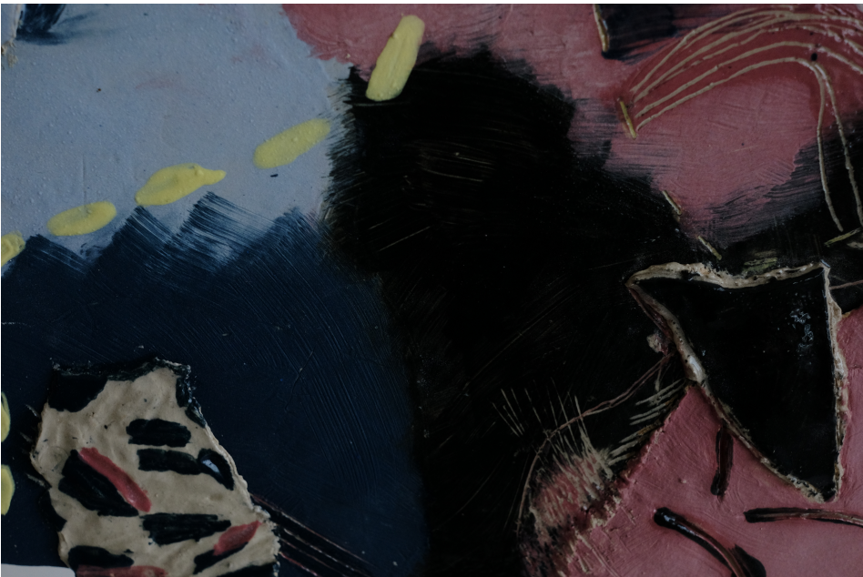
Obr. 35: Detail