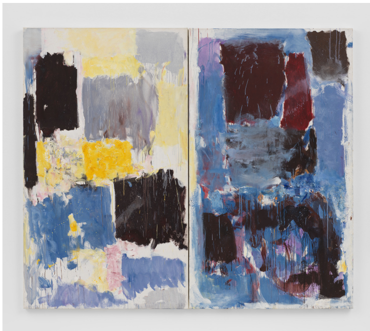
Obr. 9: Joan Mitchell - Untitled