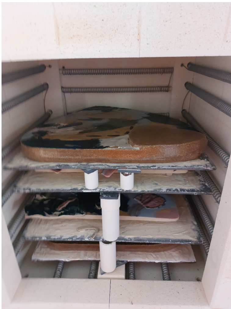
Obr. 21: Druhý výpal