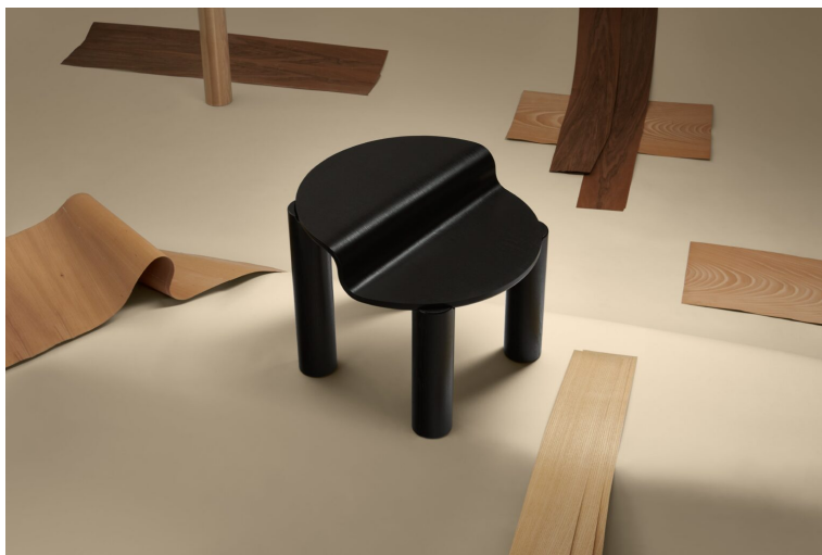
Obr. 5: Terezie Lexova a Štěpán Smetana- konferenčný stolík Swell