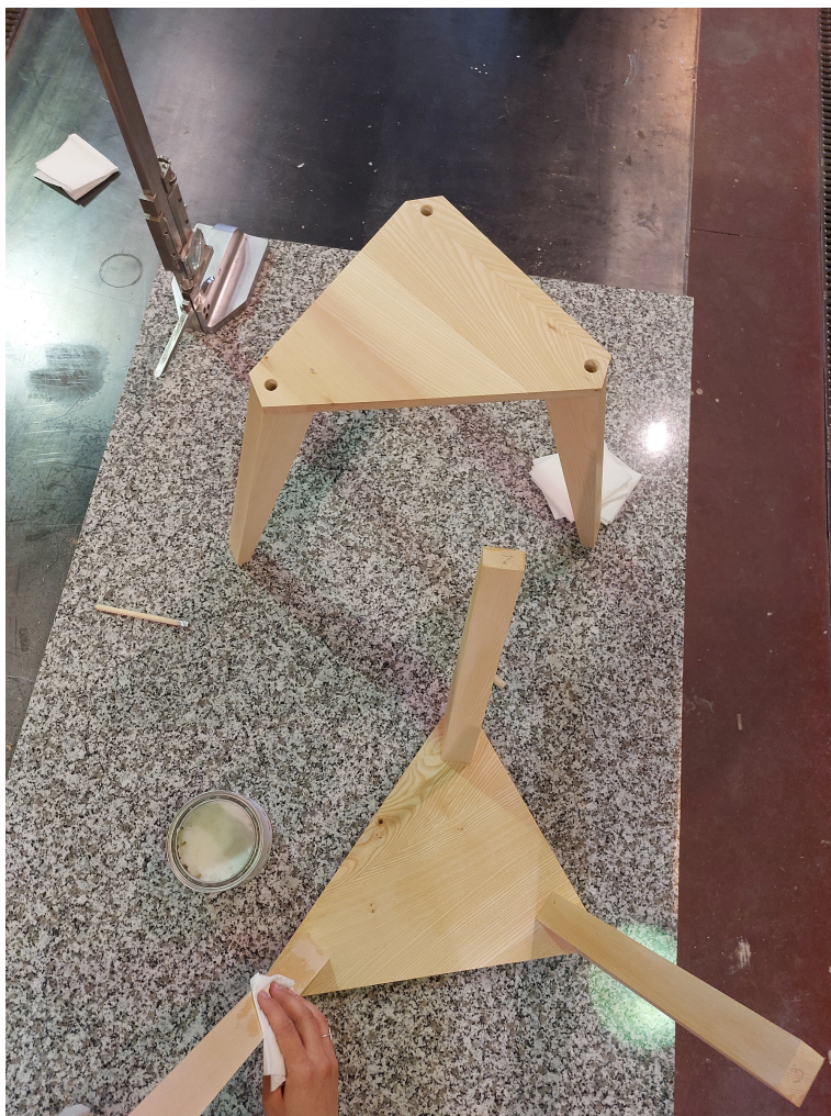
Obr. 24: Konštrukcia