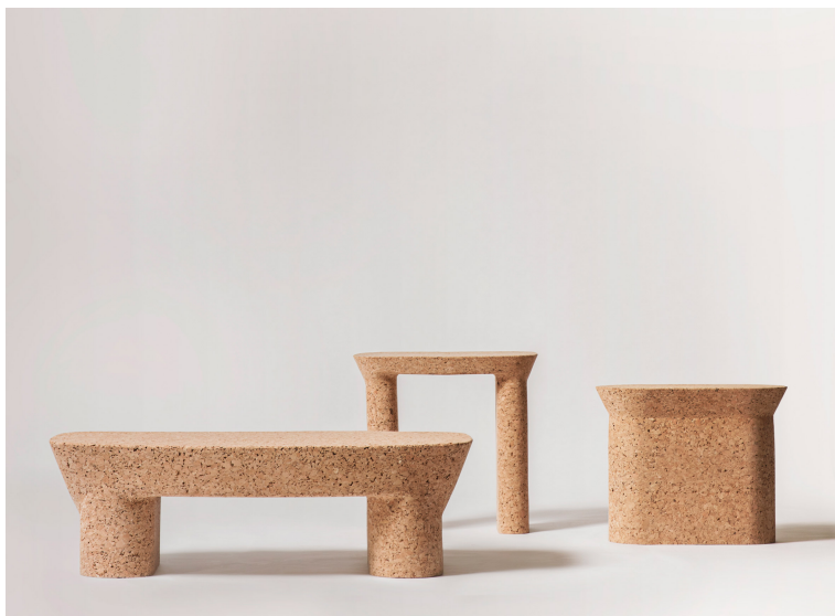
Obr. 6: Maddalena Casadei - stolík The ACCANTA