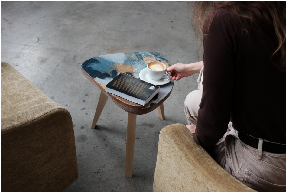
Obr. 36: Zasadenie v interiéri