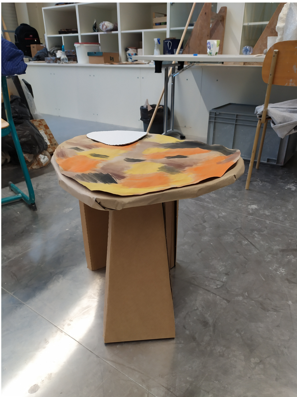
Obr. 13: Model z kartónu 1:1