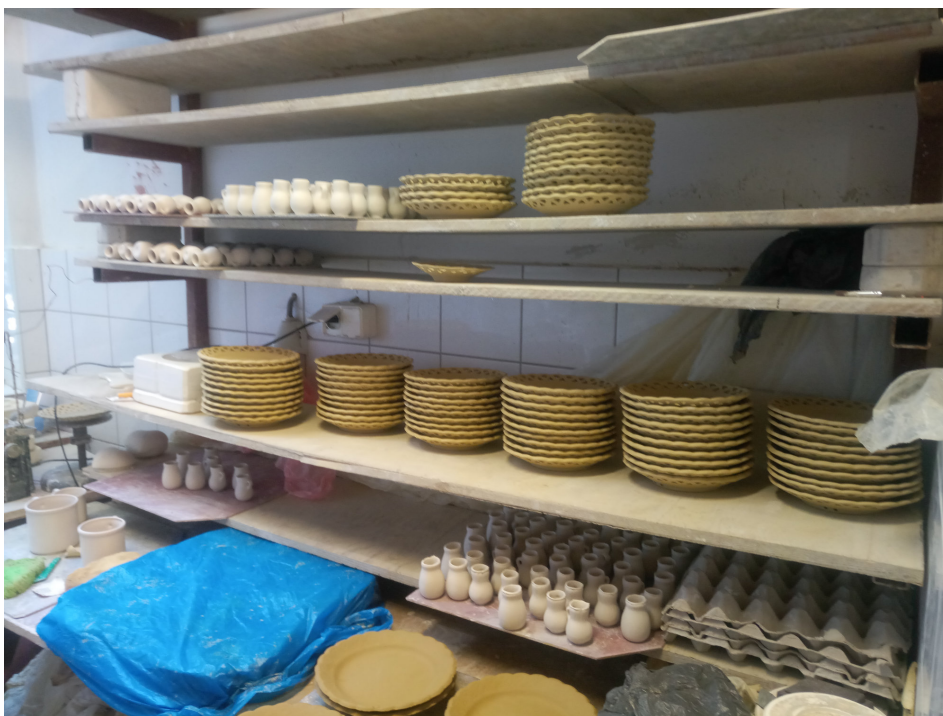
Obr. 1: Pezinok