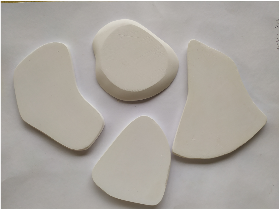
Obr. 12: Sadrové modely