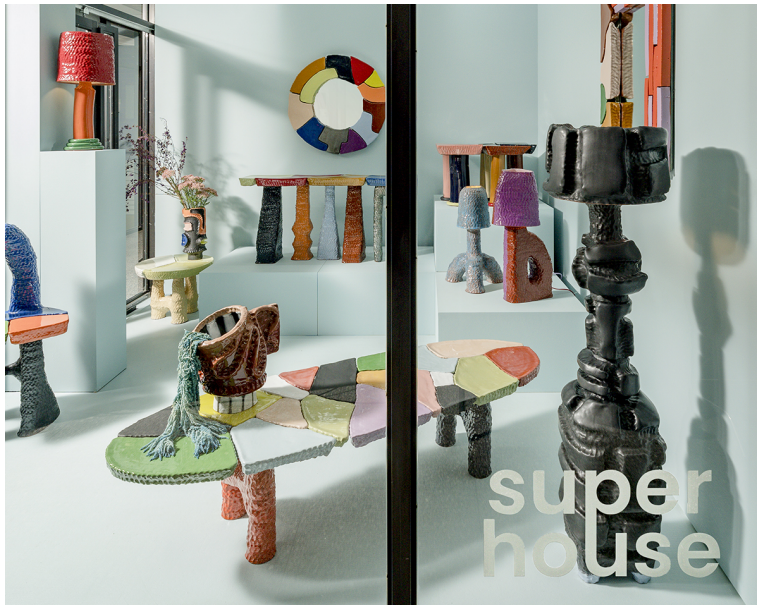
Obr. 7: Sean Gerstley - Tile block