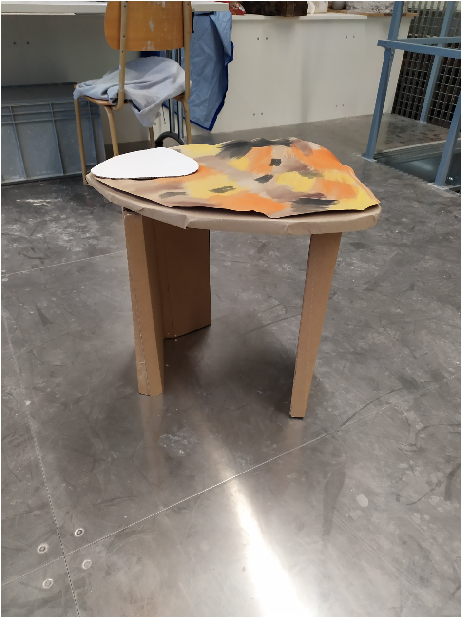
Obr. 14: Model z kartónu 1:1