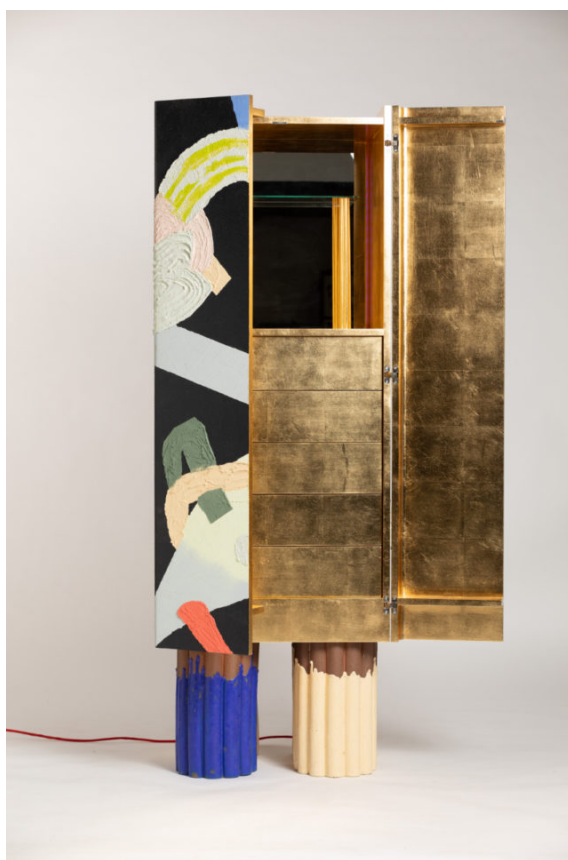
Obr. 3: Milan Pekař- Kabinet kuriozit