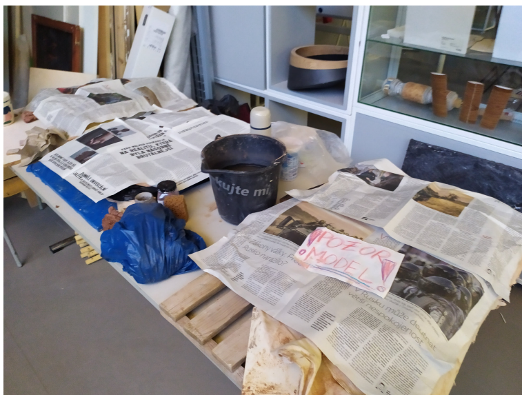
Obr. 19: Sušenie