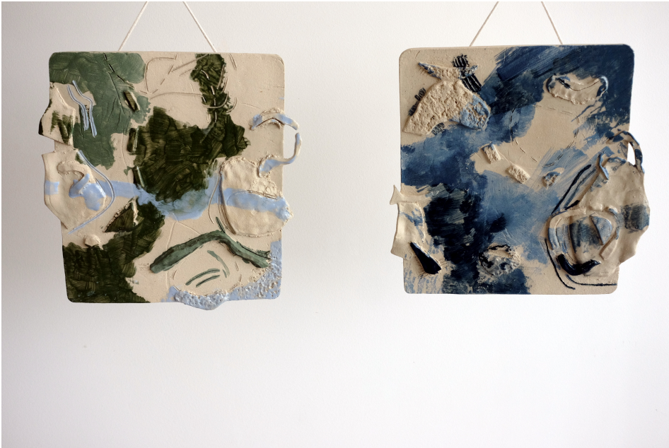
Obr. 32: Reliéfy