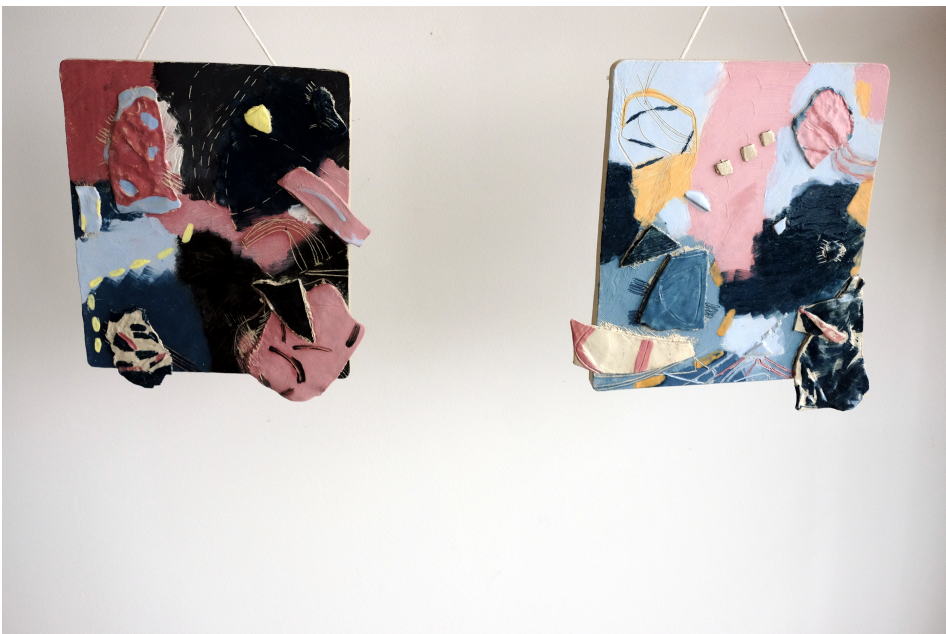
Obr. 33: Reliéfy