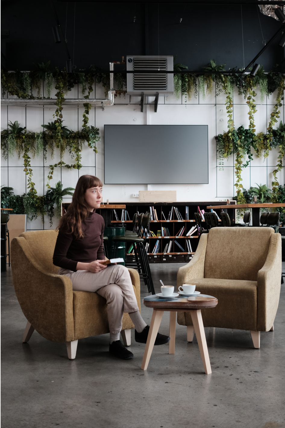
Obr. 37 52