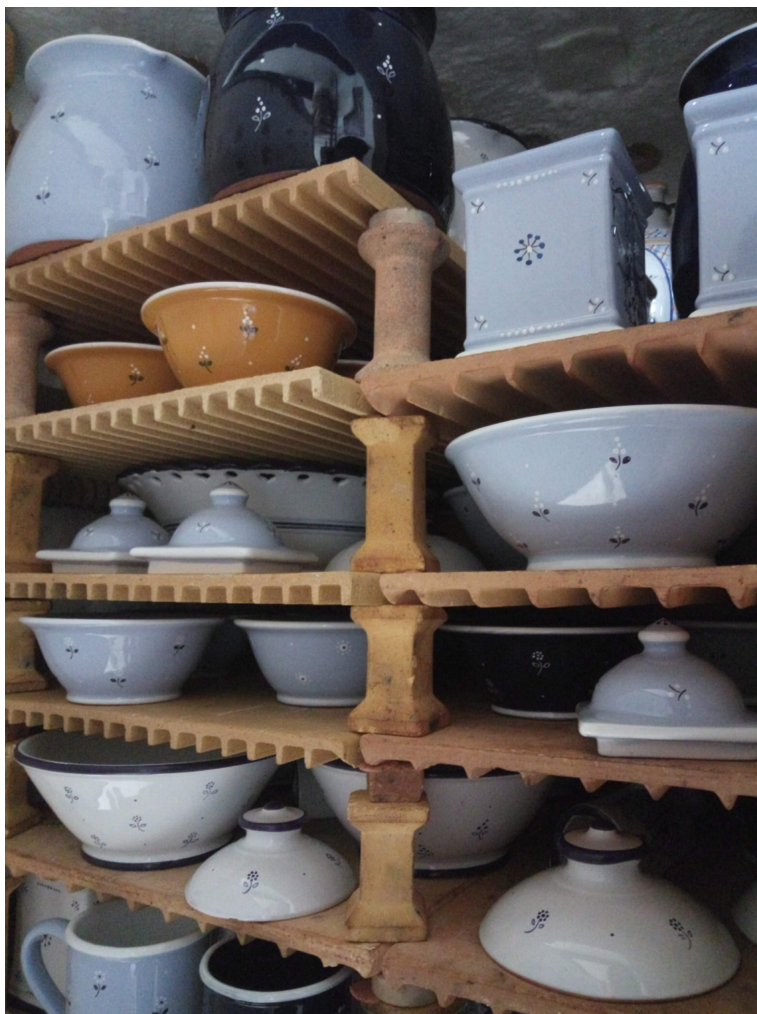
Obr. 2: Záhorská Bystrica