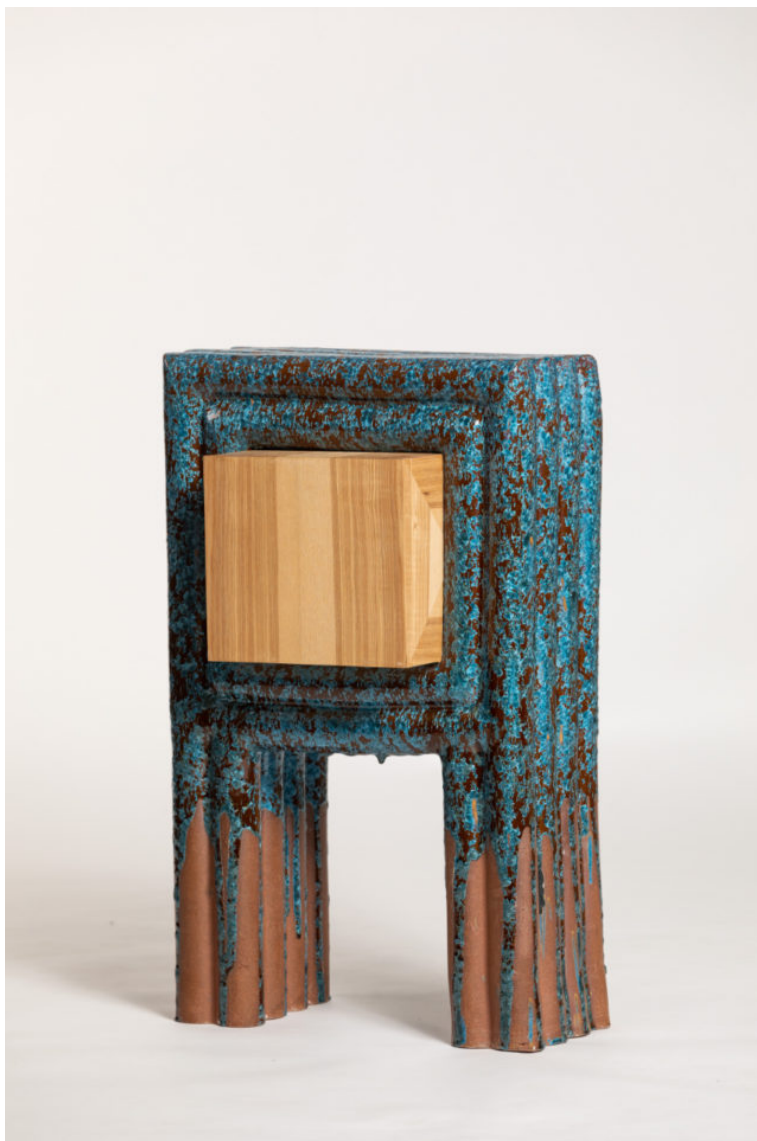
Obr. 4: Milan Pekař- Kabinet kuriozit