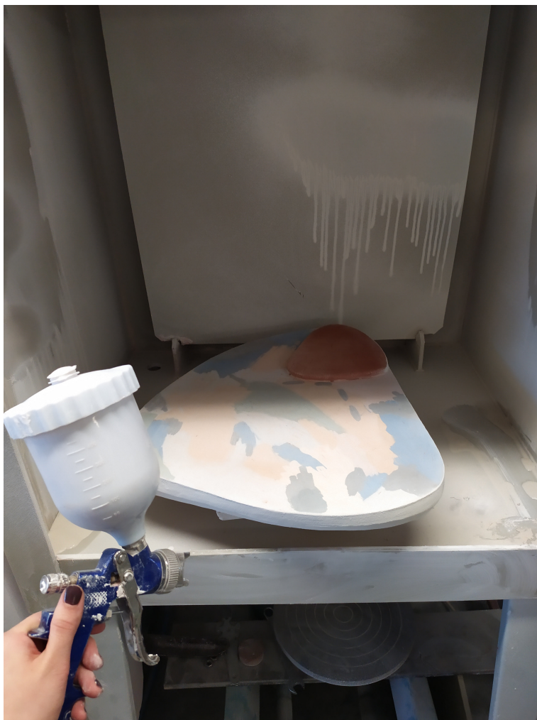
Obr. 20: Glázovanie