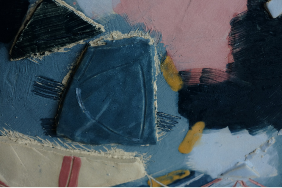
Obr. 34: Detail