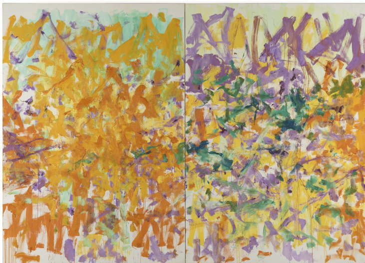
Obr. 8: Joan Mitchell - Untitled