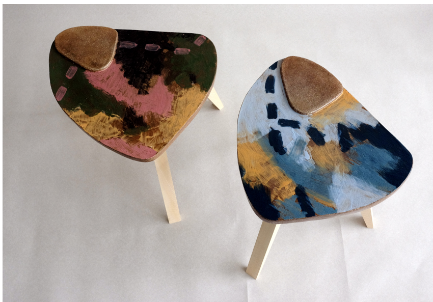
Obr. 26: Prvá varianta vyvýšeniny