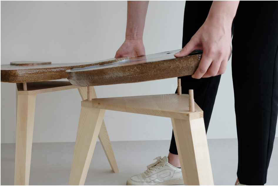
Obr. 28: Montáž