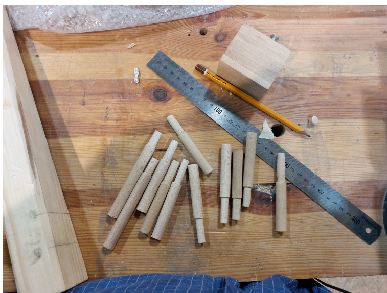
Obr. 23: Kolíky spájajúce nohy a vrch stolíka