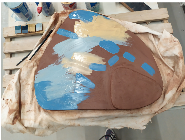
Obr. 17: Engobovanie (vrchná časť)