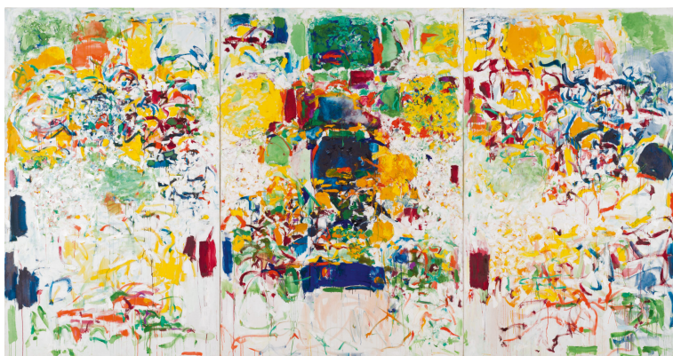
Obr. 10: Joan Mitchell - Sans Neige (Triptych)