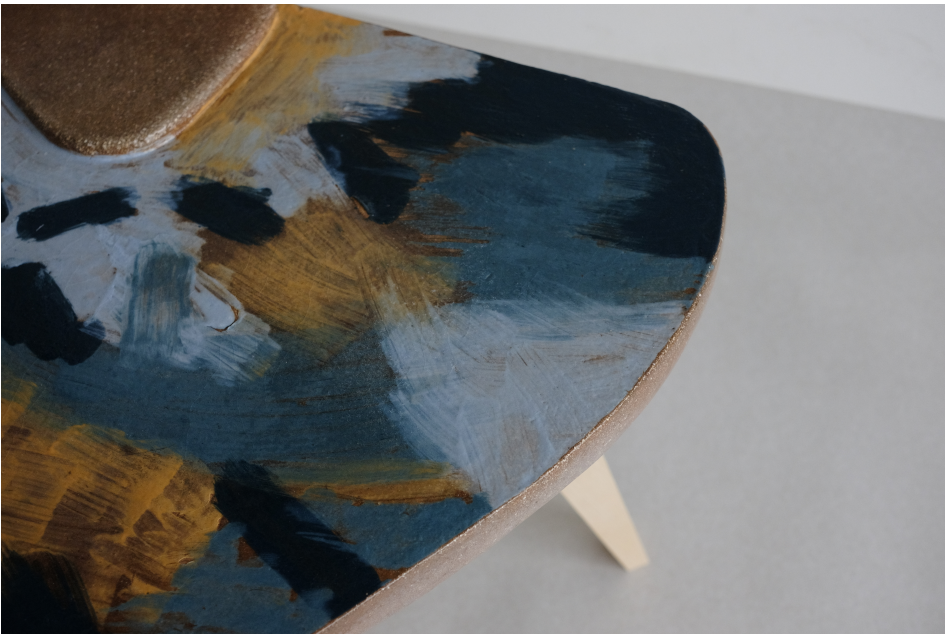
Obr. 31: Detail