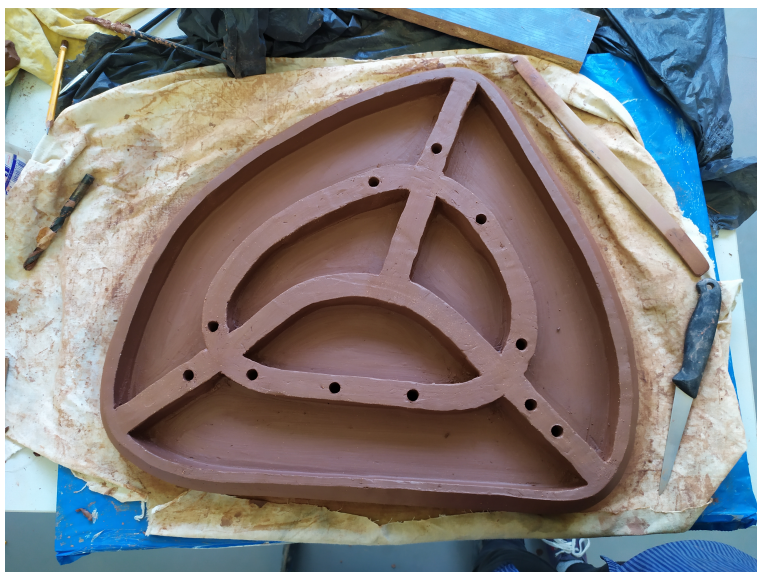
Obr. 16: Rebrá (spodná časť)