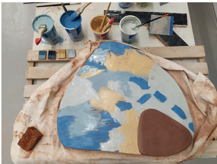
Obr. 18: Engobovanie (vrchná časť)