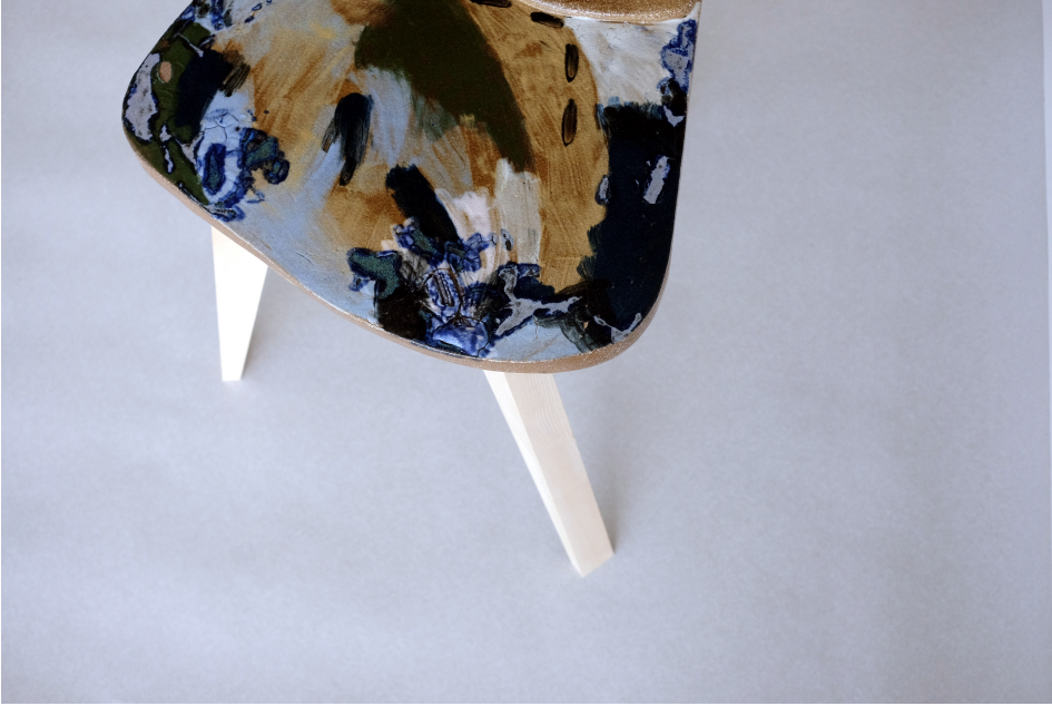
Obr. 30: Detail