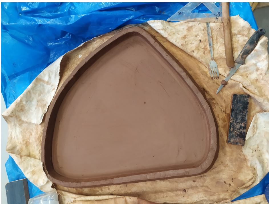
Obr. 15: Modelovanie bočnej hrany stolíka (spodná časť)