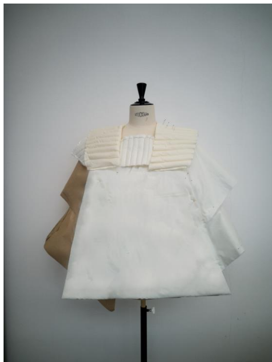
2. Model ze zkušební látky