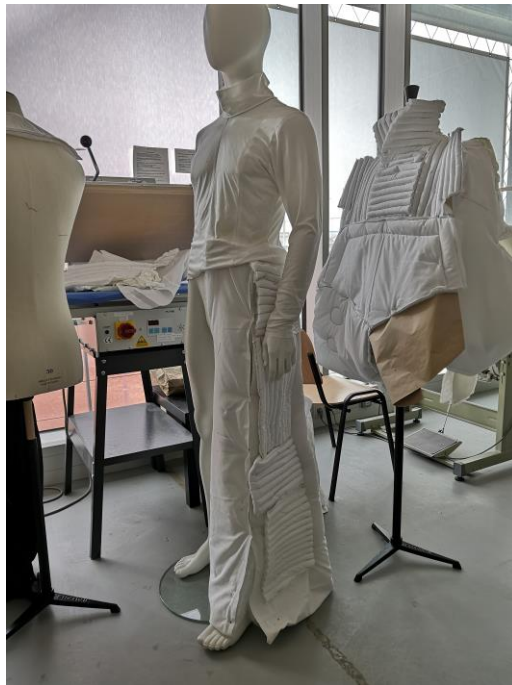
4. Model ze zkušební látky