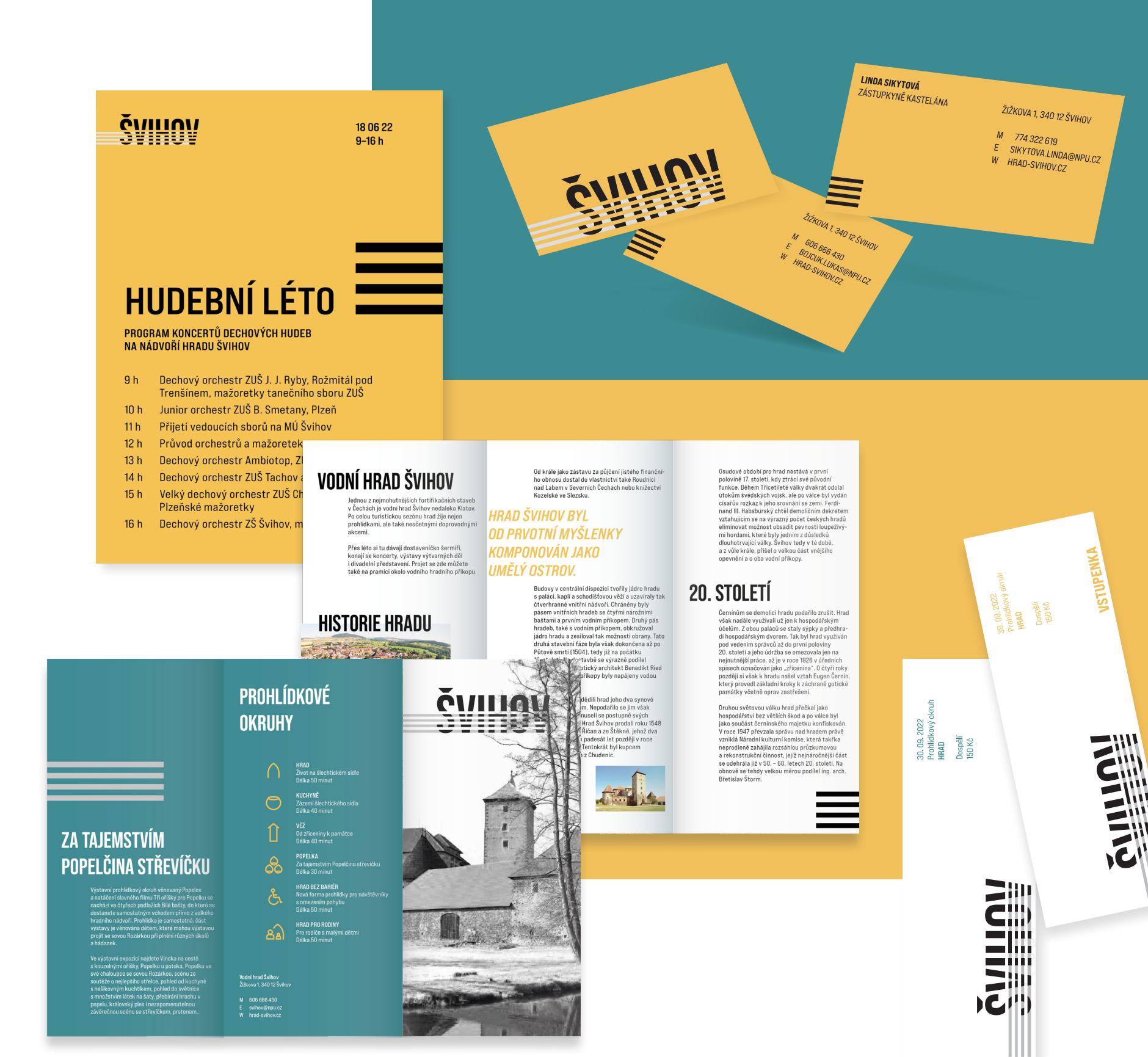
Ukázky použití písma