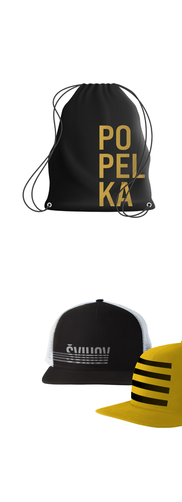
Ukázky použití vizuálního stylu

Vizuální identita je založena na logu, písmu, barevnosti a doplňkových prvcích. Zde je na několika příkladech vyobrazeno, jak s celkovou vizuální identitou pracovat, jak používat tiskovou grafiku a vizitky. Dodržování vizuální identity přispívá ke správné komunikaci společnosti a nesmí být svévolně upravováno.