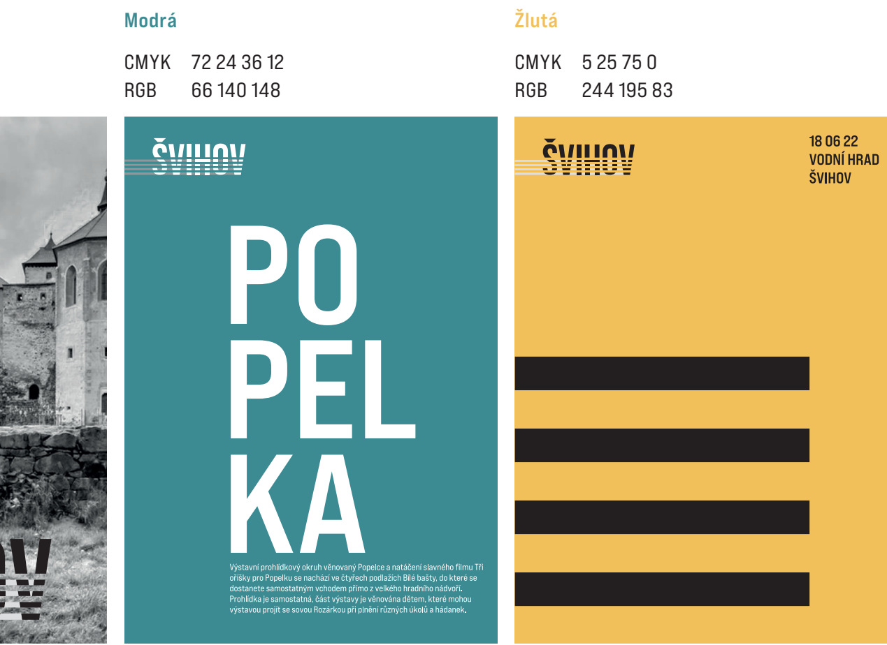
Ukázky použití barevnosti na plakátech