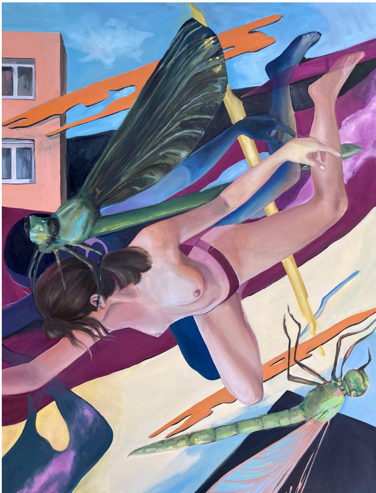
Příloha č.7, Obraz Odonata , bakalářská práce.