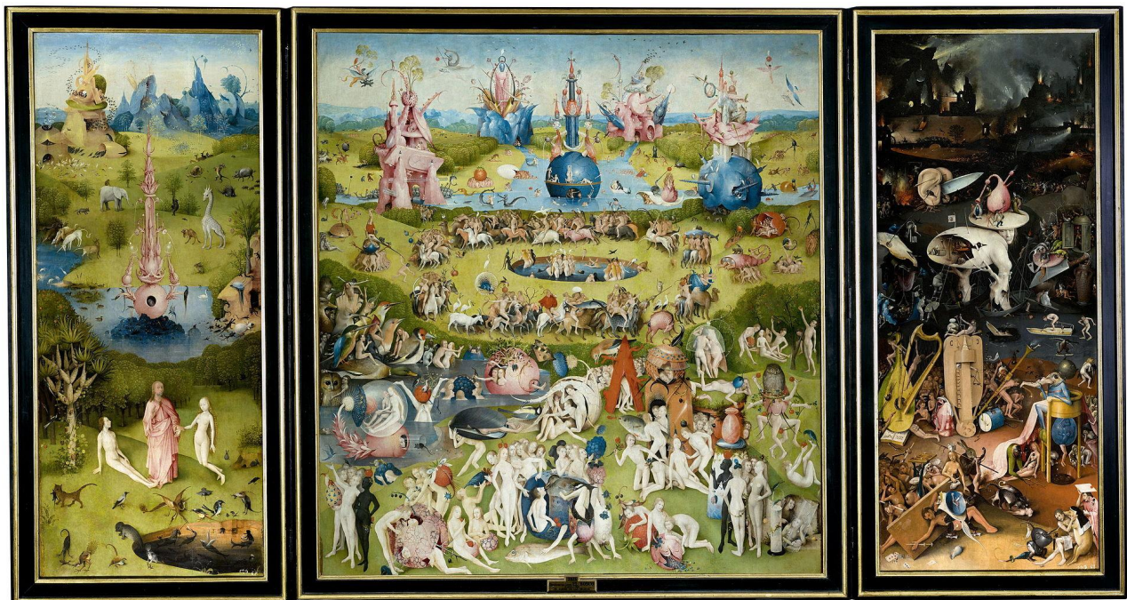
Příloha č.2 - Hieronymus Bosch, Zahrada pozemských rozkoší , 1503-1504