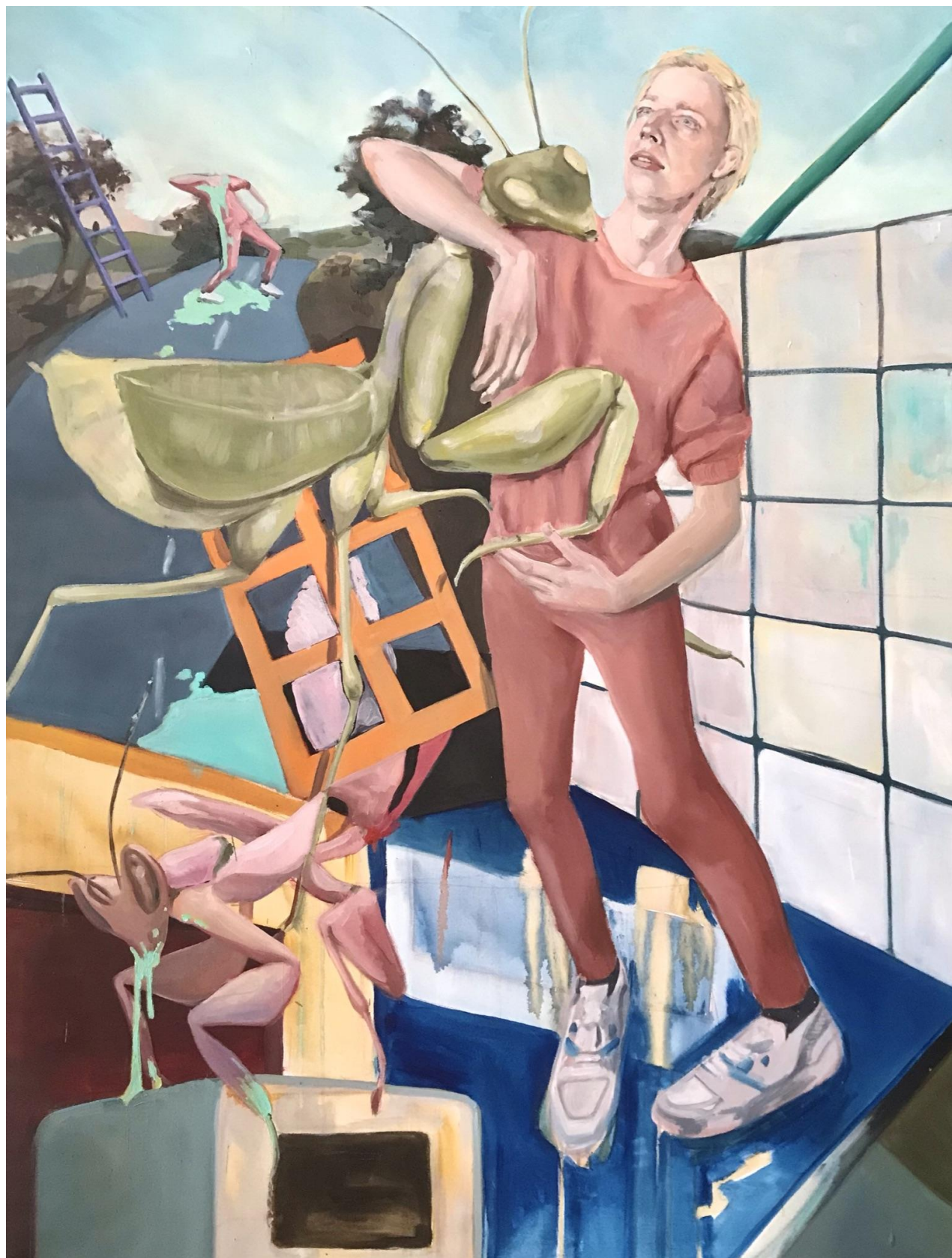
Příloha č.4 - klauzurní práce, The lovers , zimní semestr 2022. Předzvěst bakalářské práce.