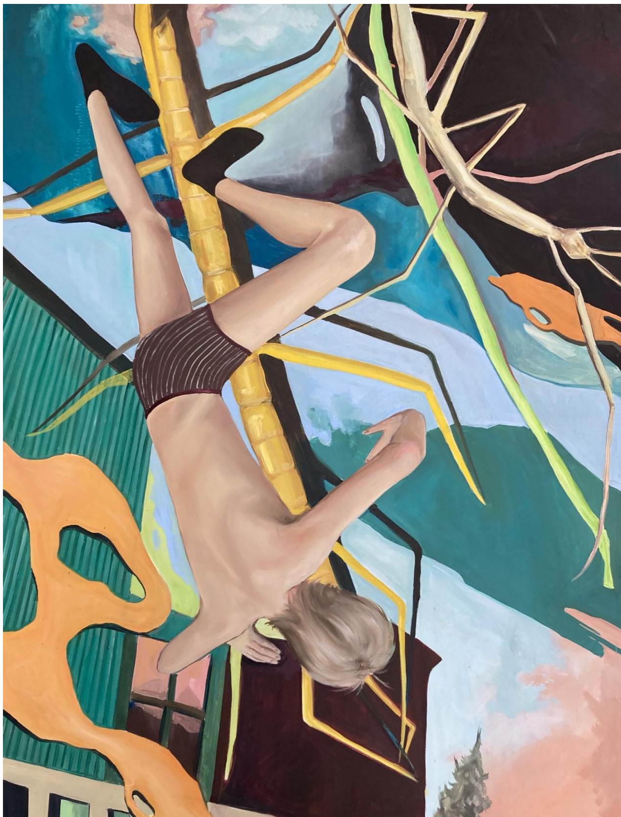
Příloha č.6, Obraz Phasmatodea - bakalářská práce.