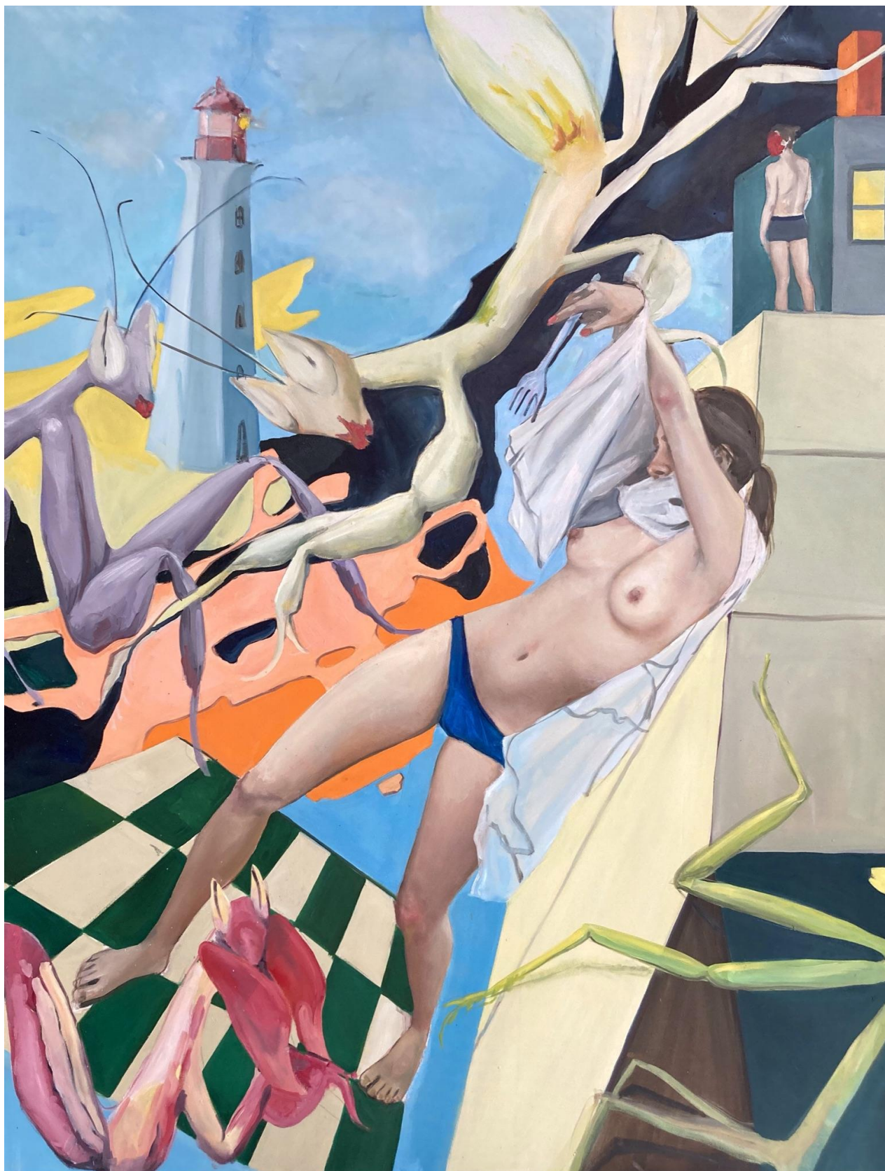
Příloha č.5, Obraz Mantodea - bakalářská práce.