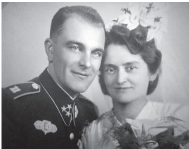
Svatební fotografie z 21. prosince 1941