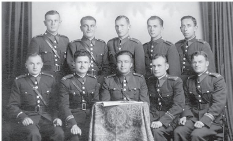
Poddůstojníkem čs. armády (horní řada, druhý zleva)