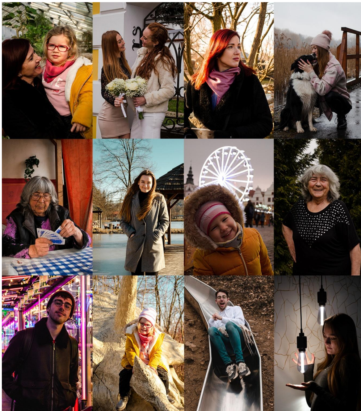
Obrázek č. 5 – Koláž finálních portrétů