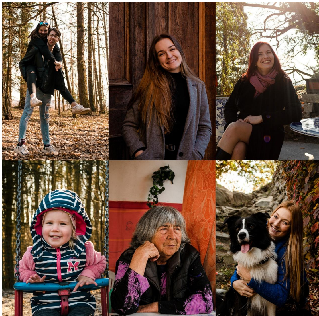
Obrázek 18 – Koláž nezvolených a pomocných fotografií