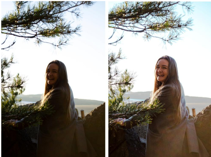
Obrázek č. 4 – Fotografie před a po úpravě

Vybrané fotografie upravuji v „Adobe Photoshop“, který je nejpoužívanější pro úpravu fotografií. Photoshop nabízí velkou škálu možností pro úpravu, od barevnosti se světelností až po retušování nechtěných skvrn štětcem a fotomontáže. Upravuji-li fotografie ve formátu „RAW“, tak se ve Photoshopu otevře podokno zvané „Camera Raw“. V tomto okně pak tvořím velkou část úprav fotografií, zde se však nachází především funkce na úpravu barevnosti a světelnosti fotografií a dále také ořez a korekce objektivu. Vždy se snažím o největší zachování původní fotografie a přidávám minimální počet čísel v úpravách, aby fotografie zůstaly reálné. V nástrojích aplikuji funkce jako je teplota, odstín, kontrast, zřetelnost, živost, křivky, směšovač barev a oříznutí obrazu. Dále následuje odstranění nedokonalostí pomocí retušovacího štětce, jako jsou skvrny či nežádoucí rušivé elementy. Upravené fotografie ukládám na disk ve formátu JPG.