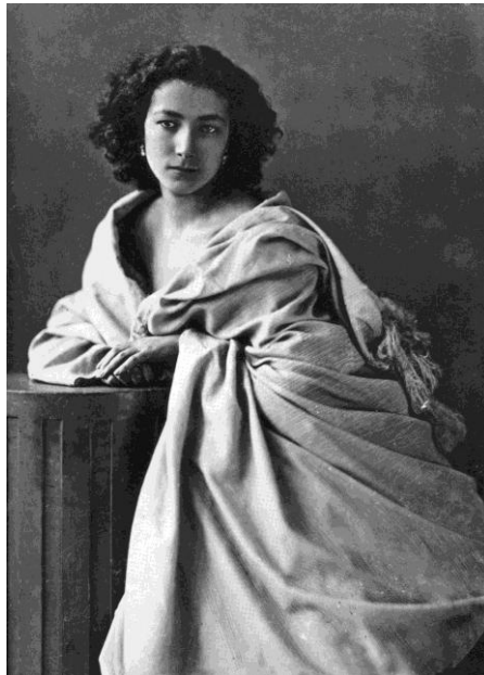
Obrázek č. 1 – Nadar, Sarah

Portrétní fotografie je považována jako nejčastější druh i v dnešní době. Dříve nebylo jednoduché ji vytvořit tak, aby neměla špatnou kvalitu či nebyla rozmazaná. Zpočátku byly fotografie pouze statické. Odvíjelo se to od fotopřístroje, kterému trvalo dlouhou dobu vytvořit jednu konkrétní fotografii. Proto osoby musely zůstat nehybné a být ve strnulé pozici, ve které museli vydržet po celou dobu focení. Portrétní fotografie si mohly dovolit pouze vyšší vrstvy, které měli dispozice a postavení na to vlastnit takovou fotografii a mít takovou fotografii bylo bráno jako privilegium. Vývoj fotografie měl stěžejní vliv na dostupnost i pro nižší vrstvy. Gaspard-Félix Tournachon, neboli Nadar je jeden z nejvýznamnějších fotografů, bohémů a letců, který využil samostatnost v obrazech a využil je do fotografie. Využíval všechny možnosti jak se zlepšovat a vymýšlel originální nápady na svou tvorbu. 5