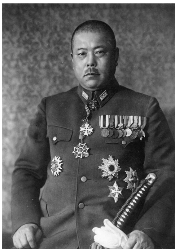
Příloha č. 6, generál Tomojuki Jamašita