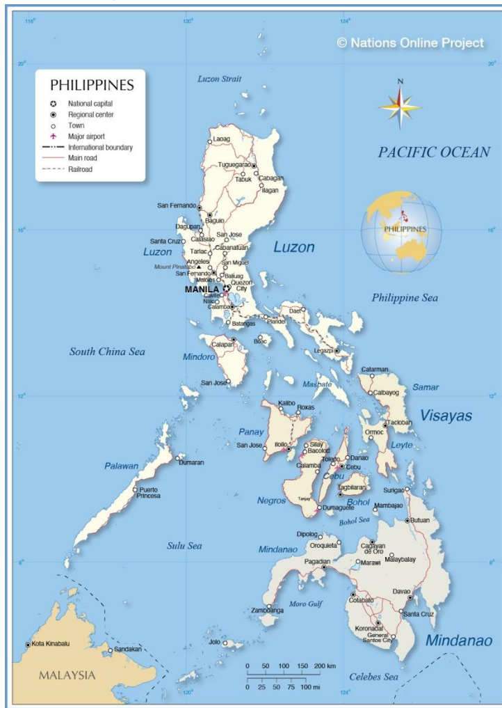
Příloha číslo 1., mapa Filipín