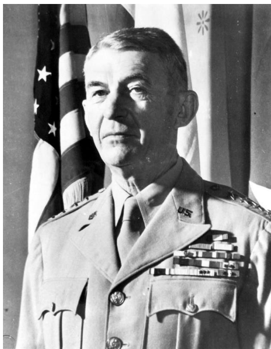
Příloha č. 5. generál Walter Krueger