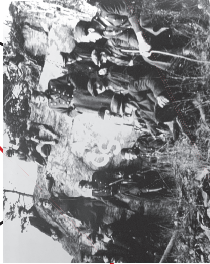
Výhled z Hrádku, 1938.

Ve vzpomínkách Václava Václavíka, rodem z Hrádku se setkáváme s dalším bývalým obyvatelem Hrádku, a rodákem z č. p. 5. Za nablých okolností v Mauthausenu zachránil hrádecký esesák Pfeifer Václavíkov život přesunutím z testního komanda na lehkou práci. Václavík se údajně Pfeifera po osvobození nikdy neviděl, ale říká, že se z východní fronty nevrátil.