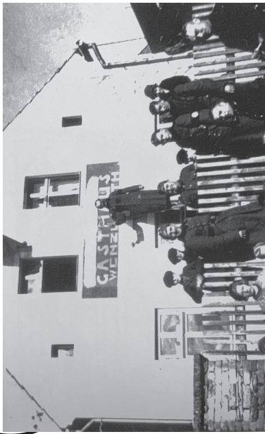
Likvidace českých náglisů na Rothově hostinci, č. p. 17, podzim 1938.