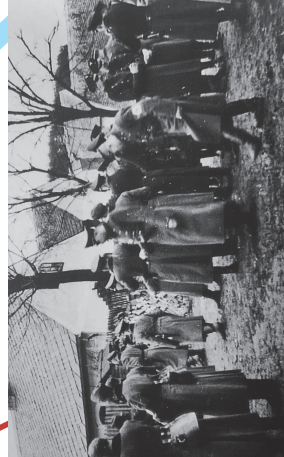
Příchod německé armády, 1938. Rodina Michlů. Dvorní skot. Seibrtů (1), u Michla (2), u Marečka (4).

Částečně roubená stavba, dnes zdomácněná a přestavěná ita moderní domácností. Dům je v blízkosti ho objektu. Fotografie nejstaršího domu v obci jsou k vidění v muzeu regionálních staveb v Mariánské Týnici. Dům sloužil i jako obecní jednotřída s místností pro ubytování učitele. Májitelé domku měli obyrnou část v podkroví. Michlovi, kteří dům obývali dodnes, jsou nejdelé usazenou rodinou v obci.