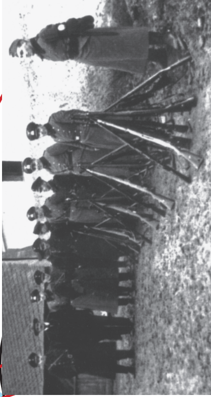
Hlidka německé jednoty a finanční stráž na dvoře č. p. 16, podzim 1938.