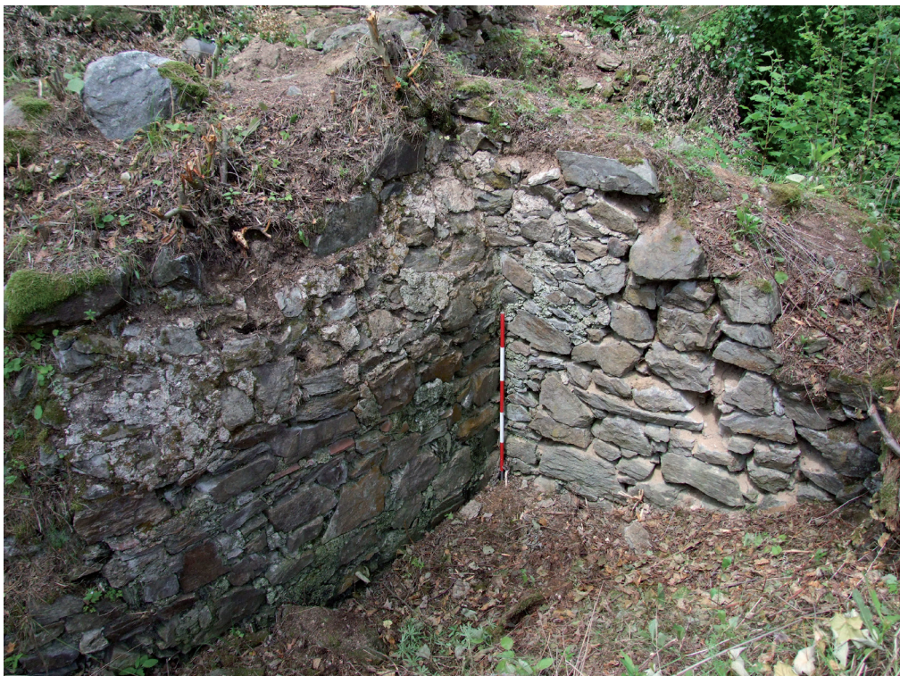
Obr. 12. Velešín hrad. Vnější líc severovýchodní části presbyteria kaple a východní líc novověkého opěrného pilíře založeného na koruně předpokládané čelní zdi severního palácového křídla. – Abb. 12. Burg Velešín. Nordöstliche Teil der Mauer des Presbyteriums der Kapelle von außen und nach Osten weisende Oberfläche eines neuzeitlichen Stützpfelers, der auf der Krone der angenommenen Stirnmauer des nördlichen Palasflügels angelegt wurde.