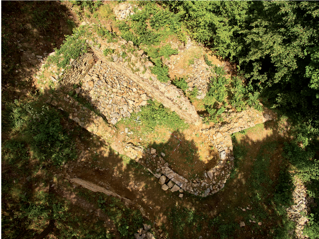
Obr. 16. Velešín hrad. Letecký pohled na kapli a nově odkryté zdivo v nádvoří jádra hradu. Foto T. Lénárd. – Abb. 16. Luftbild auf der Kapelle und freigelegtes Mauerwerks im Hof der Kernburg. Foto T. Lénárd.