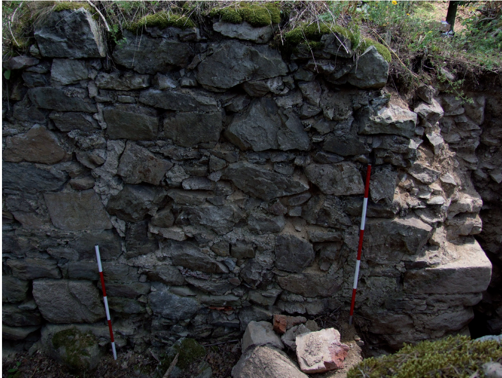
Obr. 11. Velešín hrad. Jižní část vnějšího líce západní zdi kaple. Vpravo její jihozápadní nároží. – Abb. 11. Burg Velešín. Südlicher Teil der Westmauer der Kapelle von außen. Rechts ihre südwestliche Ecke.