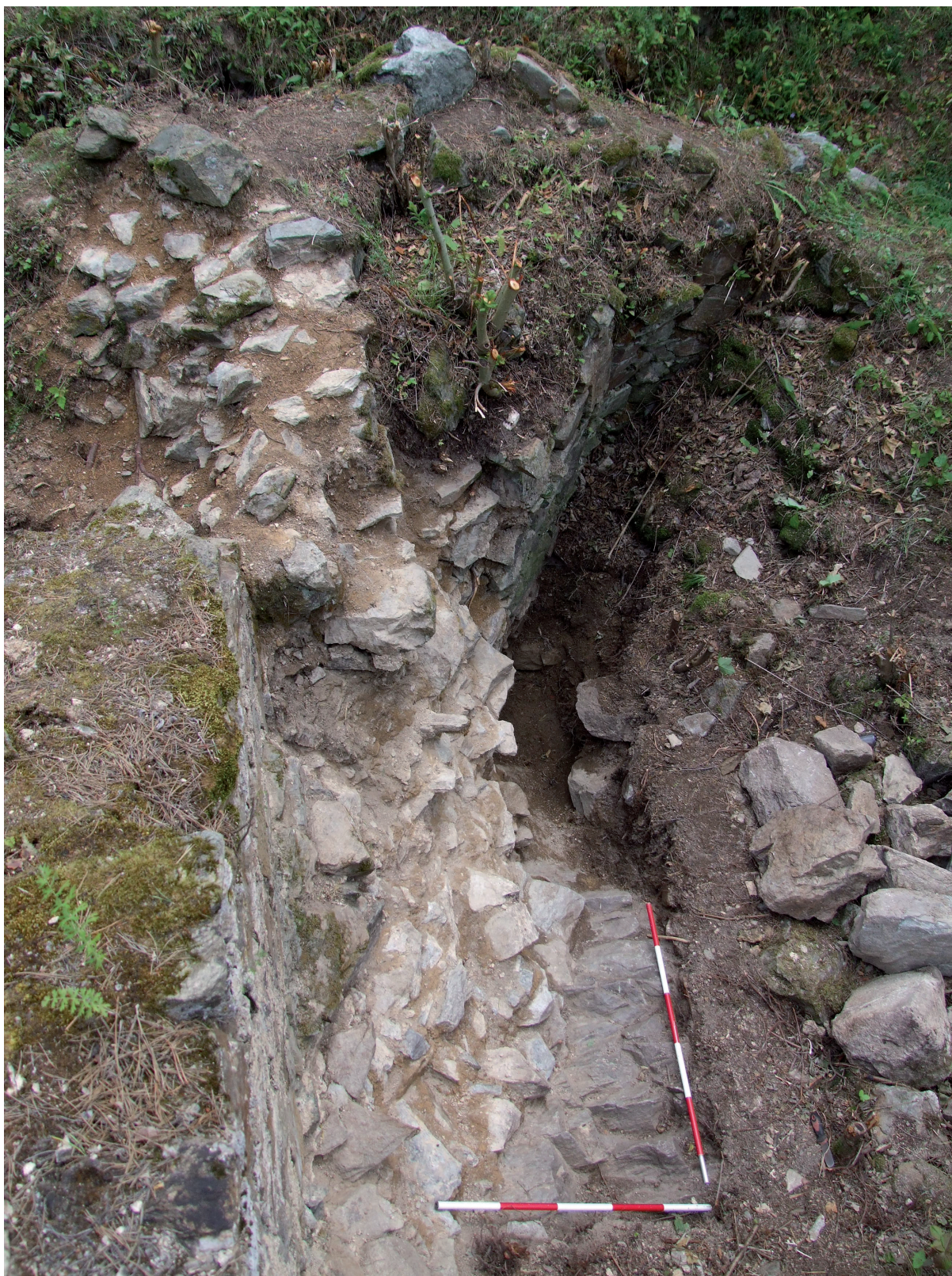
Obr. 6. Velešín hrad. Odkrytý styk severní zdi lodi kaple a presbyteria. Na skalním podloží je patrná hrana korespondující s předpokládanou hranou vnějšího líce nádvoří zdi paláce. Pohled od západu. – Abb. 6. Burg Velešín. Freigelegter Berührungspunkt der Nordmauer des Kapellenschiffs und des Presbyteriums. Auf dem Felsenuntergrund ist eine Kante sichtbar, die mit der äußere Kante der angenommenen Mauer des mittelalterlichen Palastes korrespondiert. Blick aus westlicher Richtung.