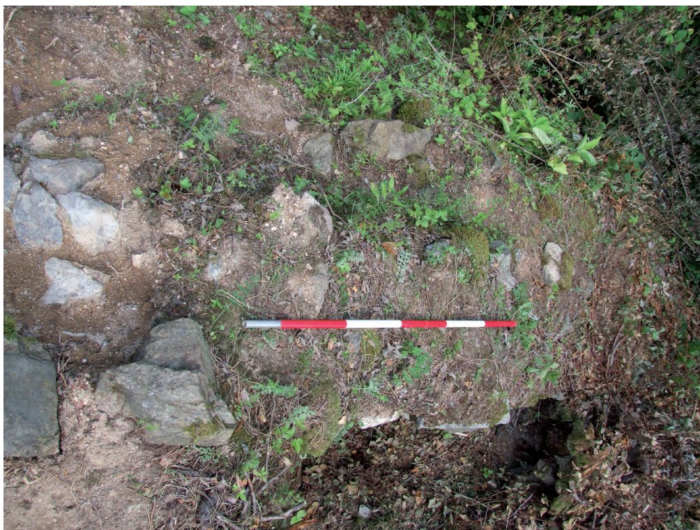
Obr. 13. Velešín hrad. Koruna předpokládané čelní zdi severního palácového křídla, na které byl v novověku založen opěrný pilíř kaple zajišťující styk lodi a presbyteria. – Abb. 13. Burg Velešín. Krone der angenommenen Stirnmauer des nördlichen Palasflügels, auf dem in der Neuzeit ein Stützpfeiler für die Kapelle angelegt wurde, welcher das Schiff mit dem Presbyteriums verband.

Jižní zeď kaple, obsahující také vstup, je dochována výrazně hůře, pouze do výšky 30–40 cm. V roce 2008 byla provedena malá sonda přiléhající k nezkoumané části vnějšího líce jižní stěny kaple (Durdík – Polcar 2009). V prostoru sondy byla pod vrstvami destrukce zachycena náleзовě víceméně sterilní vrstva z doby stavby této části kaple (obr. 1b) nasedající na pečlivě upravený skalní podklad nacházející se, dle mínění T. Durdíka, nejspíše v interiéru původní středověké kaple. V samotném neuspořádaném zdivu pojeném tvrdou šedobílou vápennou maltou se opět uplatňují úlomky cihel a prežů.