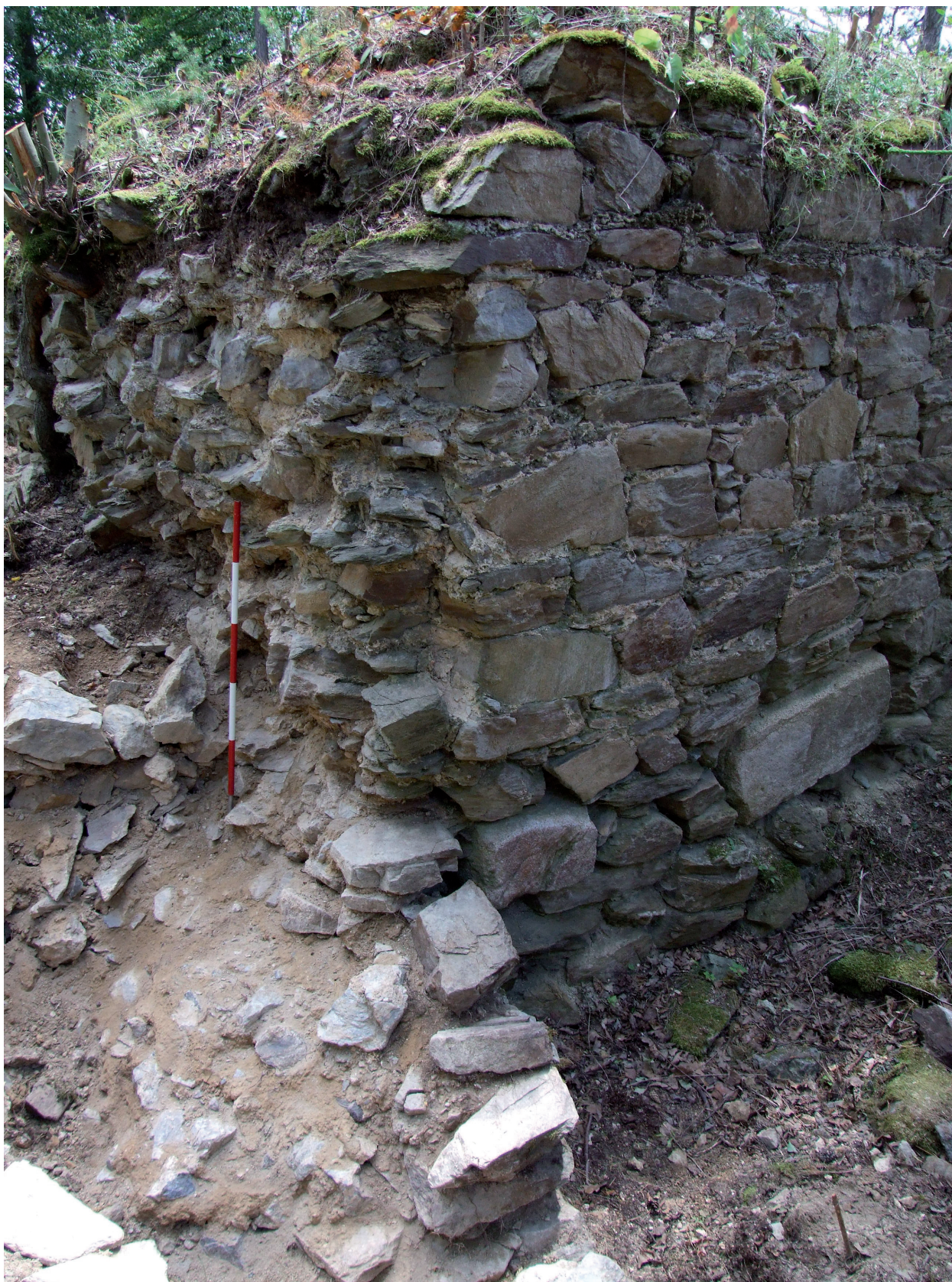
Obr. 7. Velešín hrad. Severozápadní nároží kaple založené částečně na koruně nádvorní zdi zaniklého severního palácového křídla. – Abb. 7. Burg Velešín. Nordwestliche Ecke der Kapelle, teilweise auf der Krone der Hofmauer des erloschenen Nordflügels des Palas angelegt.