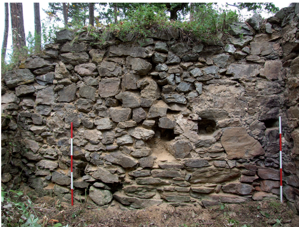
Obr. 9. Velešín hrad. Vnitřní líc západní zdi lodi kaple. – Abb. 9. Burg Velešín. Innere Oberfläche der Westmauer des Kapellenschiffs.

Výrazné úpravy vykazuje také v úplnosti okopaný vnější líc presbyteria. Vnější líc byl obezděn, zesílen a opatřen šikmým soklem provedeným v lomovém kameni (obr. 12). V líci zdiva se nashodile vyskytují zlomky prežzů a fragmenty tvrdé exteriérové omítky. K severovýchodnímu průběhu líce presbyteria je přiložena šikmo směřující zeď (obr. 12 a 13). Její mladší východní líc je vyzděn z téhož materiálu jako sokl presbytáře a je místy překryt totožnou hrubou exteriérovou omítkou. Zeď však dosahuje značné mocnosti, ve spodních partiích minimálně 160 cm. Na korunu tohoto zdiva nasedá slabší zdivo o síle 80 cm, korespondující s předpokládaným opěrným pilířem odkrytým A. Hejnou (obr. 2A/B, 13), založeným na starším mohutnějším zdivu. Tento pilíř tak s největší pravděpodobností v poslední stavební etapě kaple, zajistil exponovaný styk presbyteria a lodi kaple. V líci je zdivo provázáno s obezdívkou presbyteria. S ohledem na založení mohutnější zdi na hraně k východu ukloněného skalního podloží, její severovýchodní orientaci a víceméně rovnoběžný průběh s předpokládanou interiérovou příčkou paláce (viz obr. 1A/B) by ji bylo možné, s velkou opatrností, považovat za čelo zaniklého severovýchodního paláce. Za tohoto předpokladu by presbytář kaple, vystavěný za zlomem klesajícího skalního podloží, předstupoval před čelo severního paláce a byl by tak vystaven pohledu příchozího, vstupujícího do nádvoří hradního jádra.