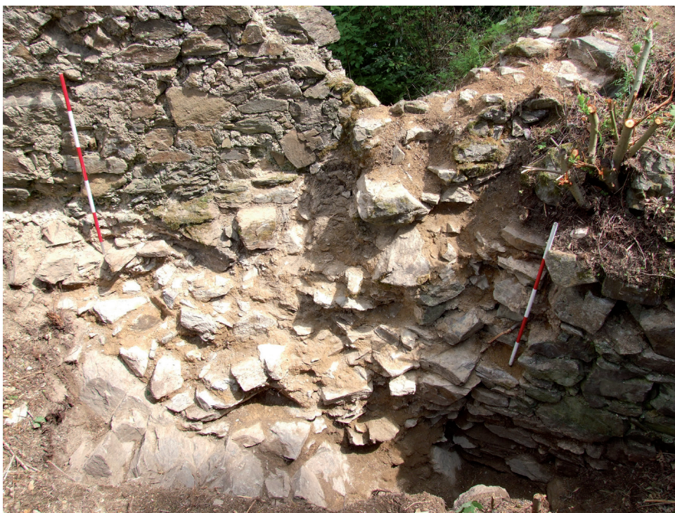
Obr. 4. Velešín hrad. Odkrytý styk severní zdi lodi kaple a presbyteria. Nahoře zdivo starší novověké stavební fáze kaple, dole zdivo středověké. – Abb. 4. Burg Velešín. Freigelegter Berührungspunkt der Nordmauer des Kapellenschiffs und des Presbyteriums. Oben Mauerwerk aus der älteren neuzeitlichen Bauphase der Kapelle, unten mittelalterliches Mauerwerk.