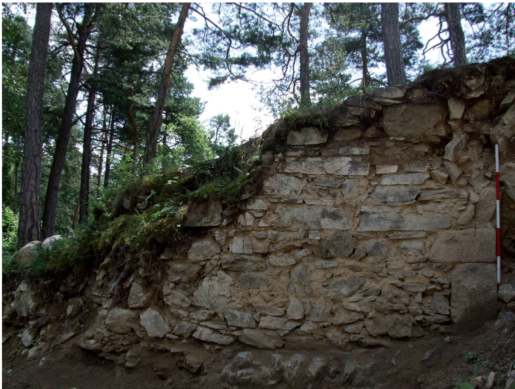
Obr. 15. Severní líc nově odkryté novověké zdi v jižní části hradního jádra. – Abb. 15. Nordseite neu freigelegtes neuzeitliches Mauerwerks im südlichen Teil der Kernburg.