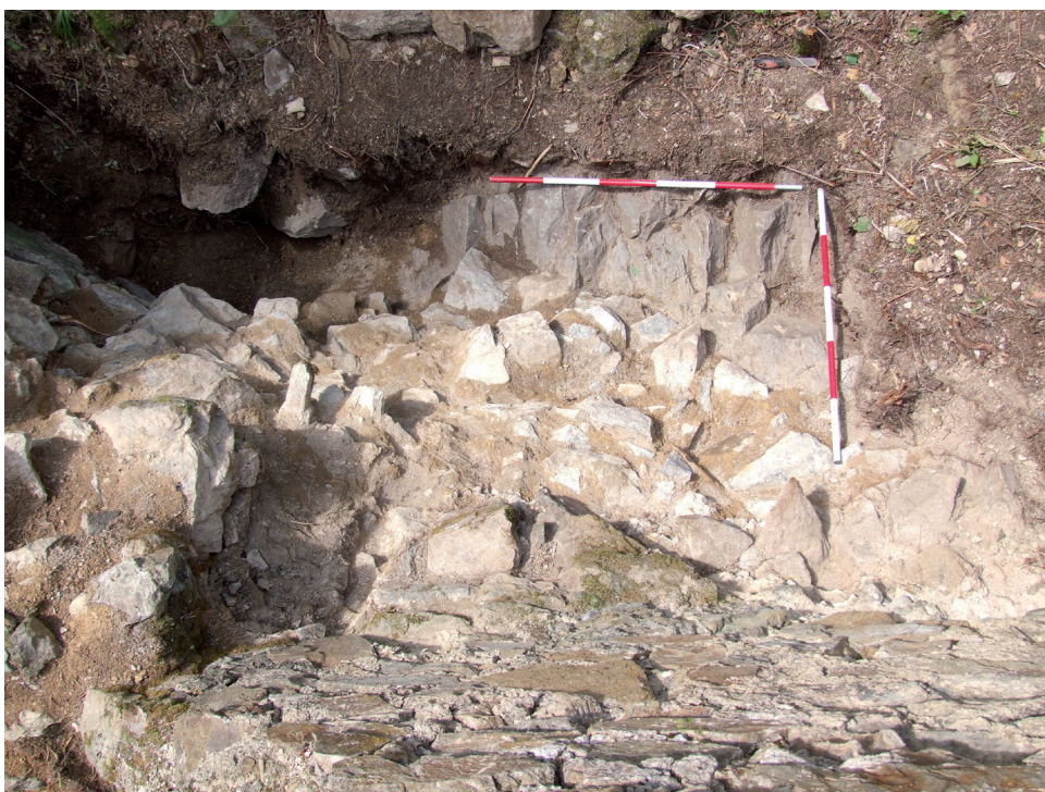
Obr. 5. Velešín hrad. Odkrytý styk severní zdi lodi kaple a presbyteria. Na skalním podloží je patrná hrana korespondující s předpokládanou hranou vnitřního líce severní zdi středověké kaple. – Abb. 5. Burg Velešín. Freigelegter Berührungspunkt der Nordmauer des Kapellenschiffs und des Presbyteriums. Auf dem Felsenuntergrund ist eine Kante sichtbar, die mit der inneren Kante der angenommenen Nordmauer der mittelalterlichen Kapelle korrespondiert.