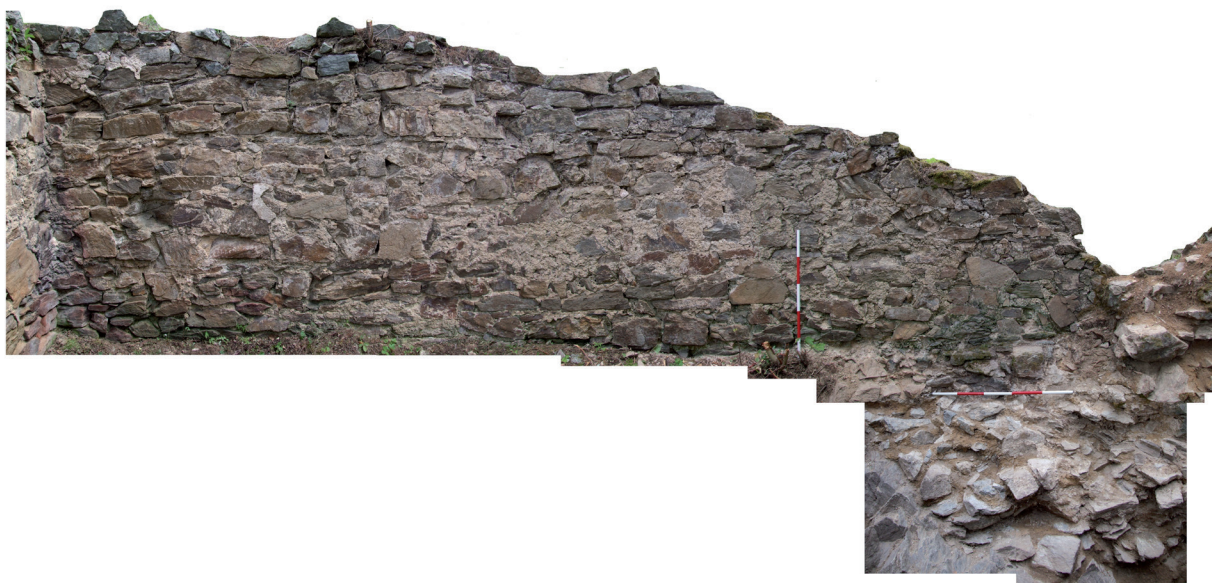
Obr. 3. Velešín hrad. Fotoplán vnitřního líce severní zdi kaple. – Abb. 3. Burg Velešín. Fotografischer Plan der inneren Oberfläche der Nordmauer der Kapelle.