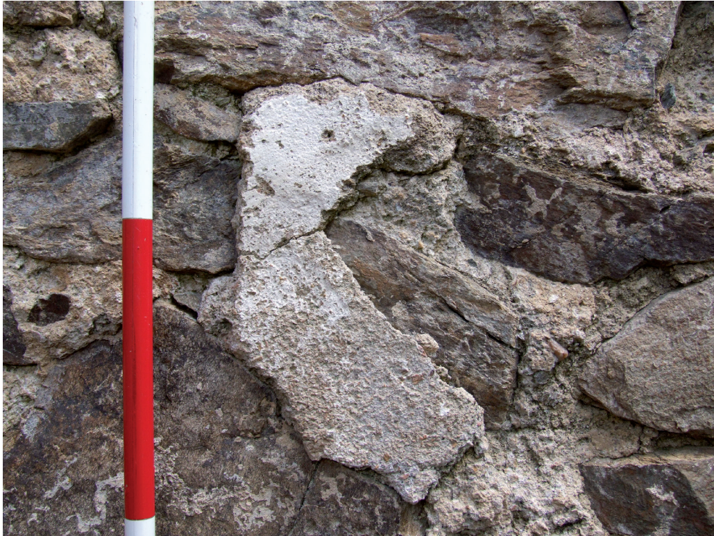
Obr. 14. Velešín hrad. Fragment interiérové omítky dochovaný v západní části vnitřního líce severní zdi lodi kaple. – Abb. 14. Burg Velešín. Fragment des Innenputzes, das an der inneren Oberfläche im westlichen Teil der Nordmauer des Kapellenschiffs erhalten ist.