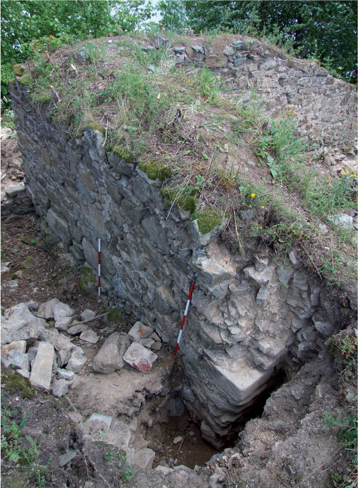
Obr. 10. Velešín hrad. Jihozápadní nároží a vnější líc západní zdi kaple. – Abb. 10. Burg Velešín. Südwestliche Ecke und Westmauer der Kapelle von außen.