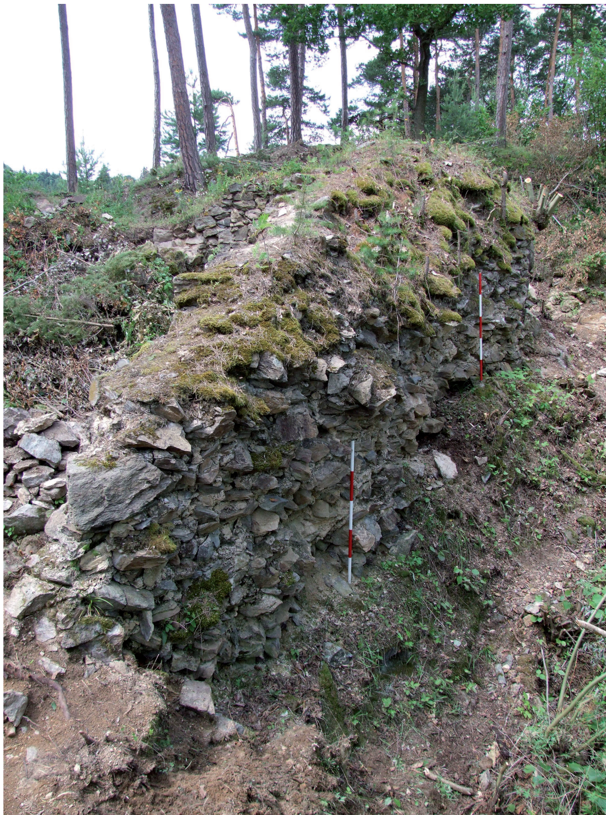
Obr. 8. Velešín hrad. Vnější (severní partie) severní zdi lodi kaple s odpadnutým lícem po očištění od náletové vegetace. – Abb. 8. Burg Velešín. Äußere nördliche Mauer (nördlicher Teil) des Kapellenschiffs mit abgebröckelter Maueroberfläche nach der Entfernung angeflogener Vegetation.