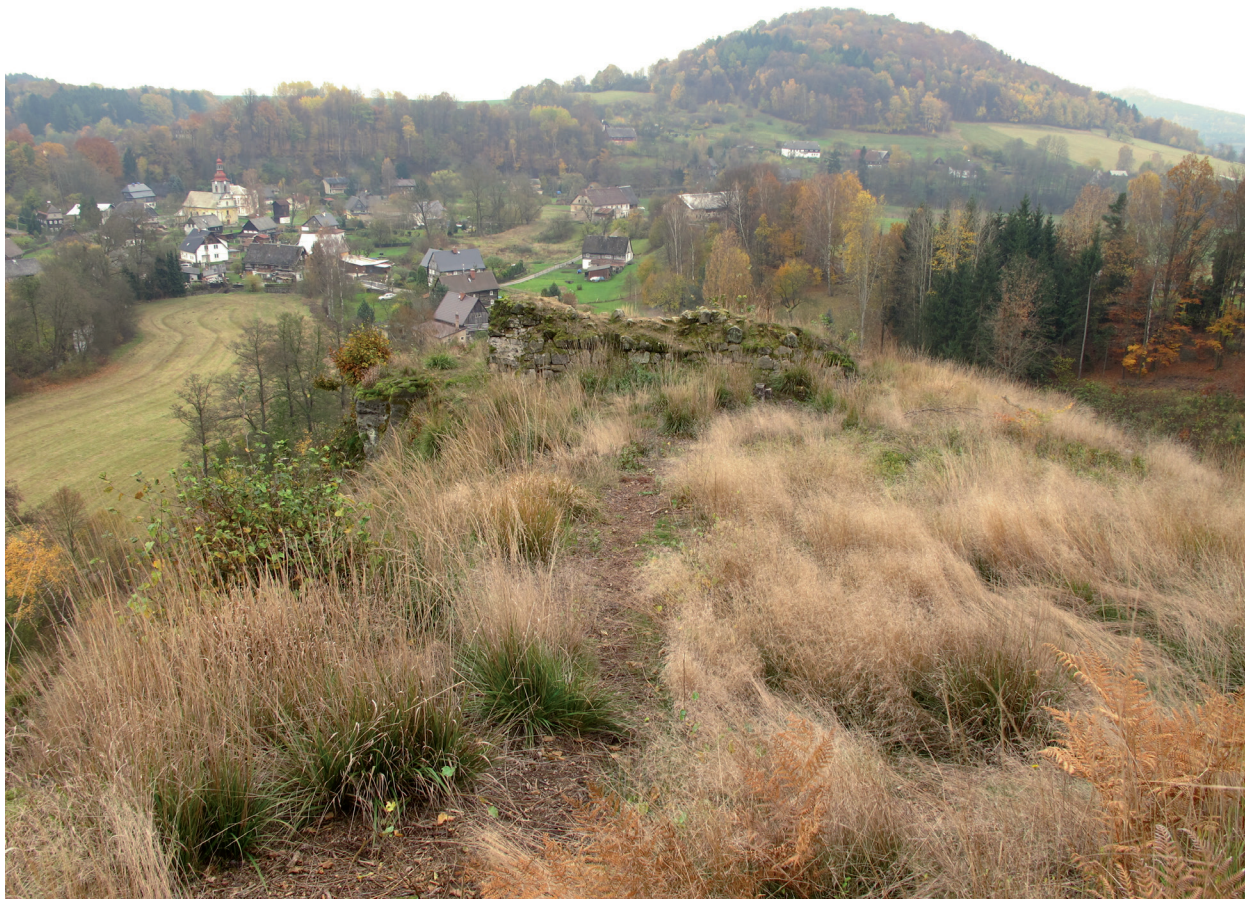
Obr. 4. Velenice. Pohled k jihovýchodu na torzo věžové stavby, v pozadí ves Velenice s kostelem. – Abb. 4. Blick Richtung Südosten auf den Torso des Turmgebäudes, im Hintergrund das Dorf Velenice mit Kirche.