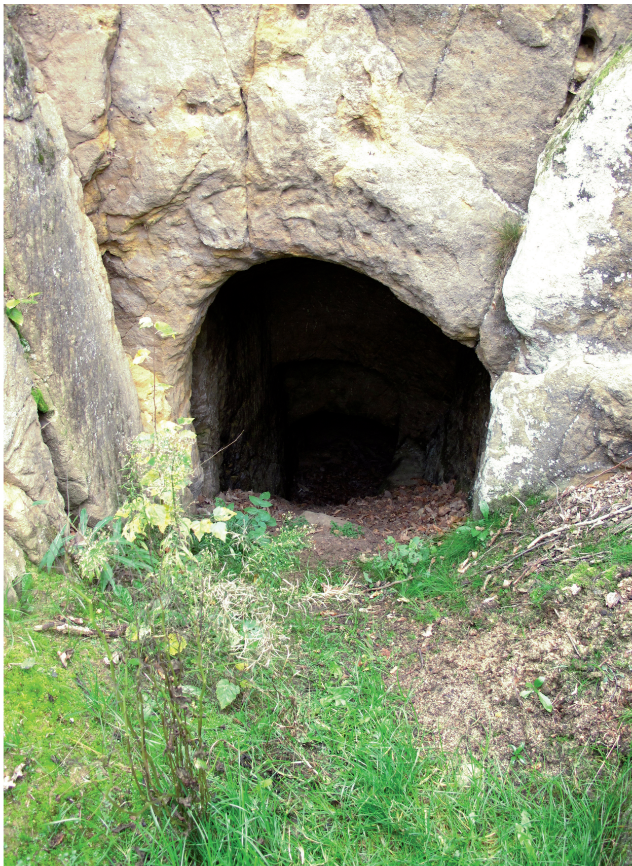
Obr. 3. Velenice. Vchod do vstupní šíje sklípku pod přední částí lokality. Foto autor 2016. – Abb. 3. Eingang in den Durchgang zum Keller unter dem vorderen Teil der Anlage. Foto Autor 2016.