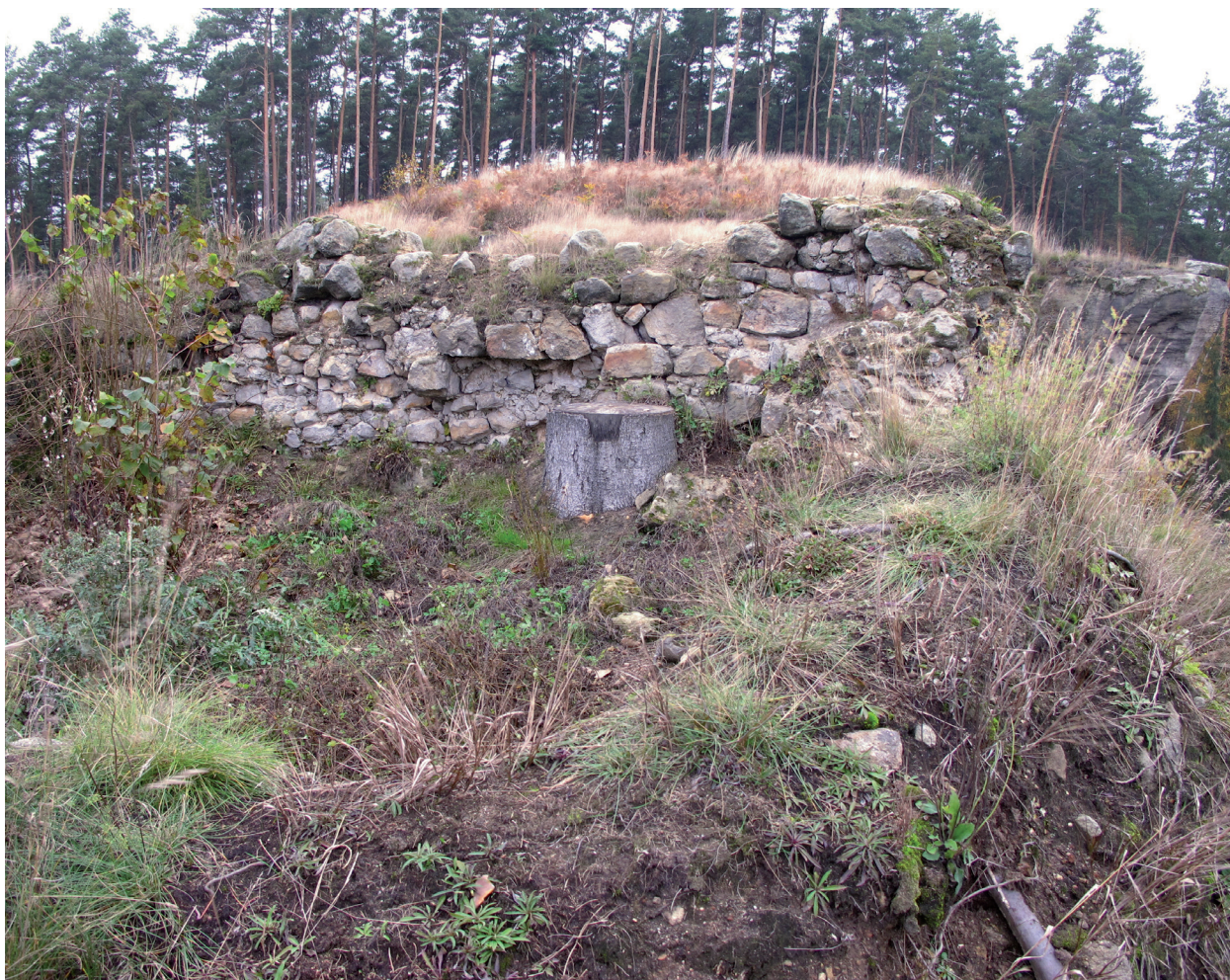
Obr. 2. Velenice. Pohled přes zbytky věžové stavby směrem k severozápadu na převýšenou první část lokality. – Abb. 2. Blick Richtung Nordwesten über die Reste des Turmgebäudes auf den höher gelegenen ersten Teil der Anlage.

terénu po nich. Jak dokládá zápis, výkopy se soustředily „v horní části bývalého zámku“. Při průzkumu a zaměřování v roce 1987 byly již na plošině za příkopem zjištěny pouze nerovnosti a deprese spolu s množstvím mazanice, které dokládaly existenci jakési roubené či hrázděné stavby. Dnes je tato část odlesněné lokality pokryta hustým porostem kapradí, který znemožňuje poznání morfologie terénu (obr. 2). Sklípek, přístupný dlouhou šjí (obr. 3) a směřující k severozápadu pod zmíněný objekt, je ve své poslední části zanesen listím. Z druhého objektu směrem k jihovýchodu (obr. 4) již dnes zůstávají pouze rozpadající se zdi vysoké od 0,5 do 2 m a v okolí je možné nalézt množství propálené mazanice, která svědčí pravděpodobně o zániku roubené či hrázděné nástavby požárem. Pouze archeologický výzkum by tak mohl potvrdit existenci prvního objektu za „příkopem“ a objasnit skutečnou podobu sídla.