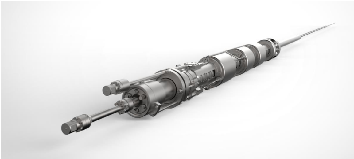
Obr. 2: Pohon LKP-M/4