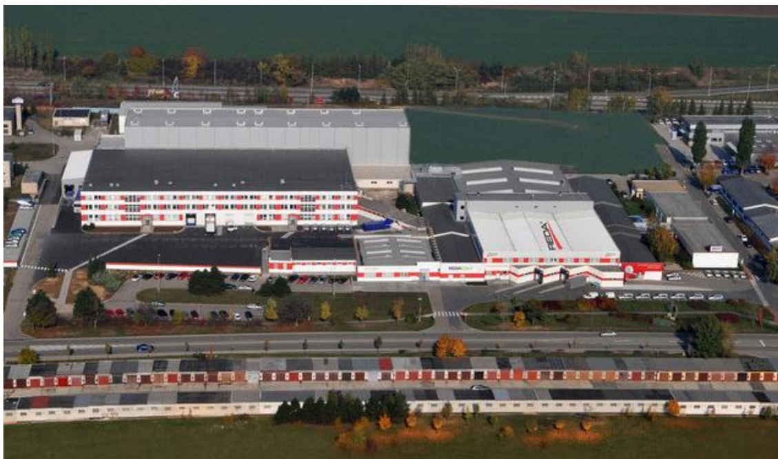
Příloha C: Letecký snímek areálu Reda Brno