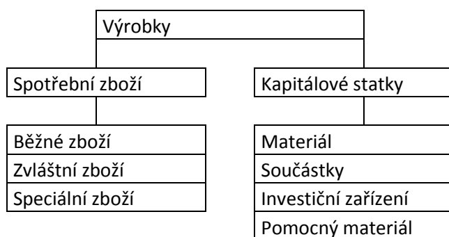
Obr. 1: Rozdělení výrobků