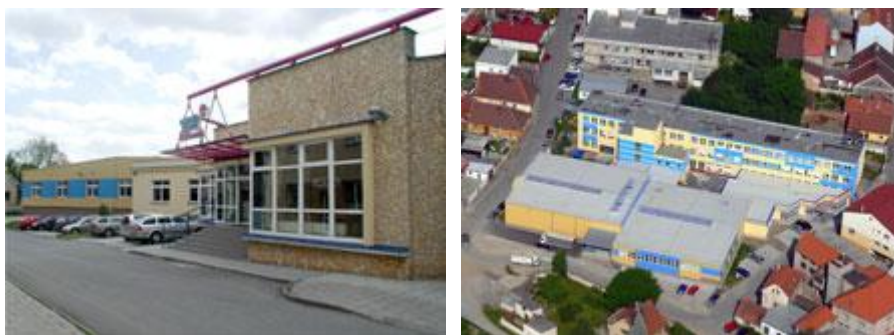
Příloha B: Letecký snímek areálu Elasto form s. r. o. Přeštice