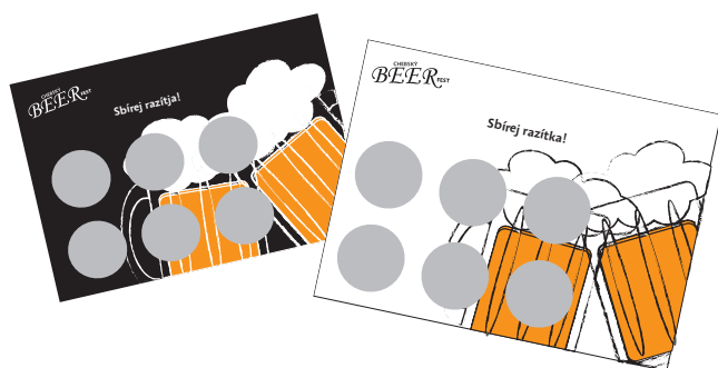
1.2 kartičky na razítka