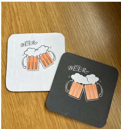
1.1 pivní podtácky