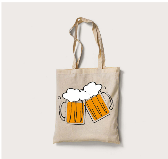
1.2 taška bílá

Dále pak k bakalářské práci dodávám, festivalový hrnek (mock up nevytvořen), nálepky.