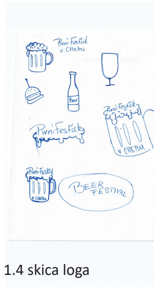
1.4 skica loga