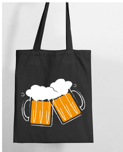
1.3 taška černá