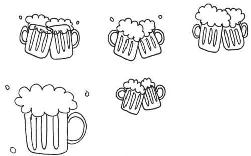
1.2 skica sklenic