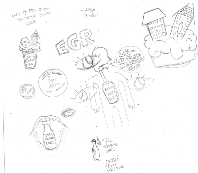
1.3 náčrt hlavního motivu vizuálu