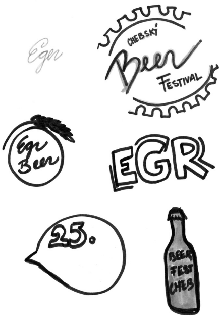
1.1 náčrtky loga