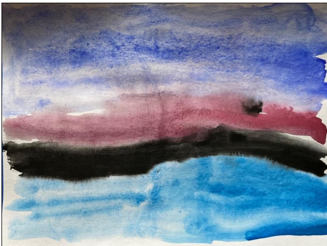
Obr. č. 4.

Dílo se proti všem ostatním liší dlouhými jednoduchými vodorovnými liniemi, které jsou po celém papíru. Žádný jiný obrázek nebyl proveden tímto způsobem. Autor začínal horní tmavě modrou barvou a pokračoval dolů. V hudbě slyšel vodu, a přestože je skladba smutná, byla pro něj velmi uklidňující.