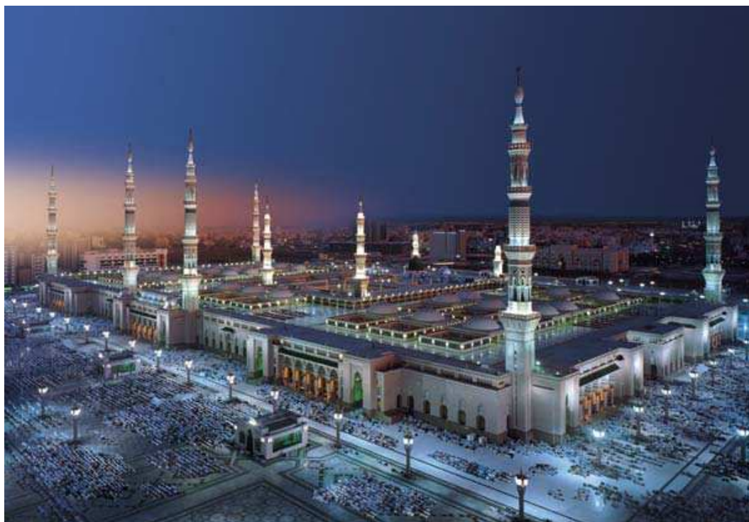
Obr. č. 1: Město Medína

Medína (arabsky al-Madína al-munawwara, مَدِينَةُ الْمُنَوَّارَاتِ ) je město, které se nachází v západní části Saúdské Arábie. V městské oblasti Medína dnes žije asi 1,3 milionu obyvatel. 5