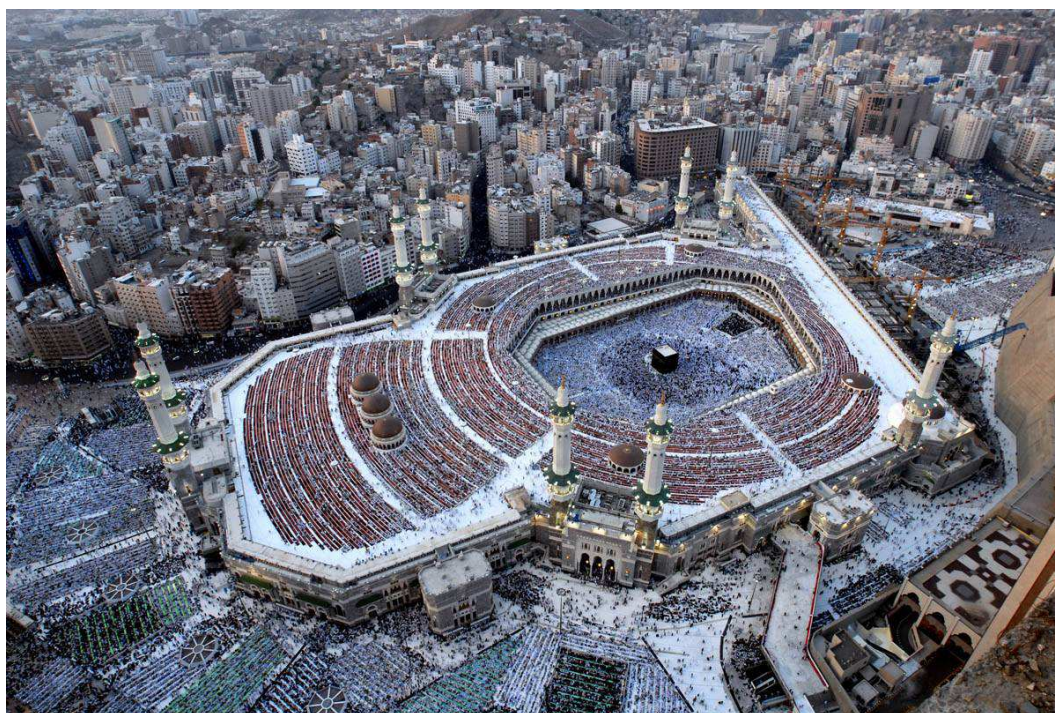
Obr. č. 2: Ka'ba

Ka'ba (arabsky الكعبة) je stavba, která se nachází ve městě Mekka, uprostřed velké mešity Masdžid al-Haram. Ka'ba je nejposvátnějším místem islámu. Muslimové věří, že ji zde na svém putování postavil sám Abraham, který byl pověřen Bohem, aby na své cestě vystavěl oltář. Už v dobách, kdy na Arabském poloostrově panoval polyteismus, byla Ka'ba významným poutním cílem. Jedním z pilířů dnešního moderního islámu je pouť do Mekky, při které věřící obcházejí sedmkrát tuto stavbu a doufají, že budou schopni dotknout se kamene, který je umístěn v jednom z jejích rohů. 7