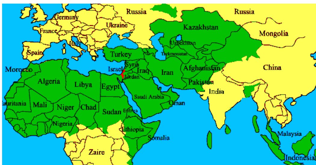
Obr. č. 3: Muslimské státy ve světě.