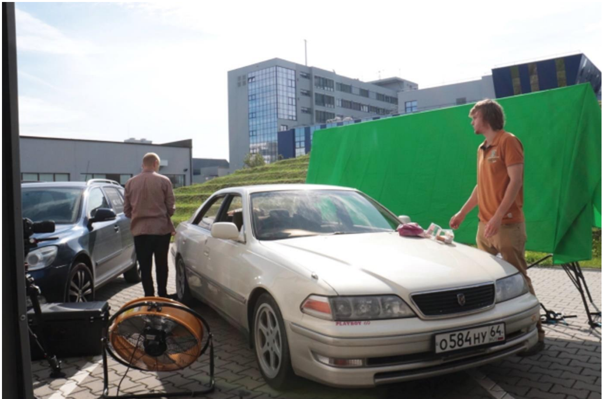
Příloha č. 13 fotodokumentace z natáčení – Comfortable Guy vs El Soko Loco