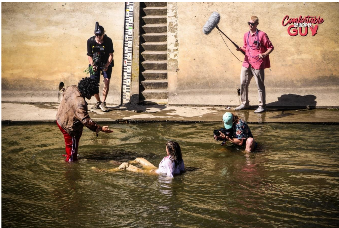
Příloha č. 14 fotodokumentace z natáčení – Výbuch letiště