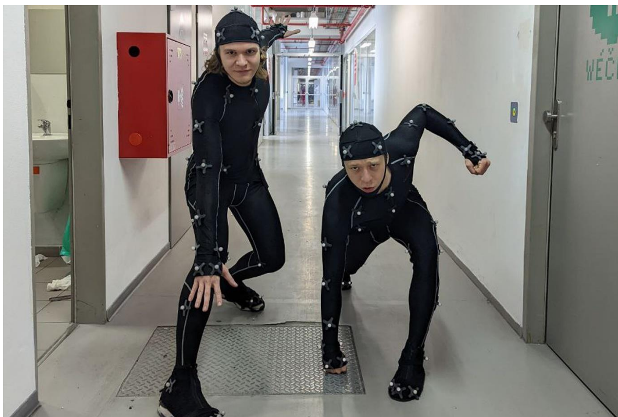
Příloha č. 11 fotodokumentace z natáčení – Green screen, létající Comfortable Guy