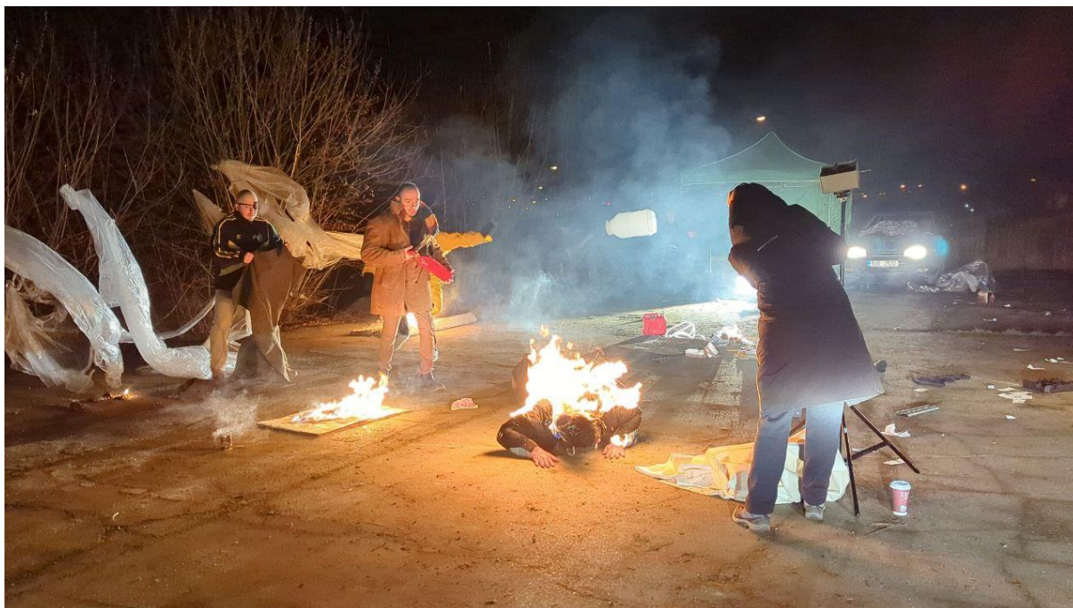
Příloha č. 16 fotodokumentace z natáčení