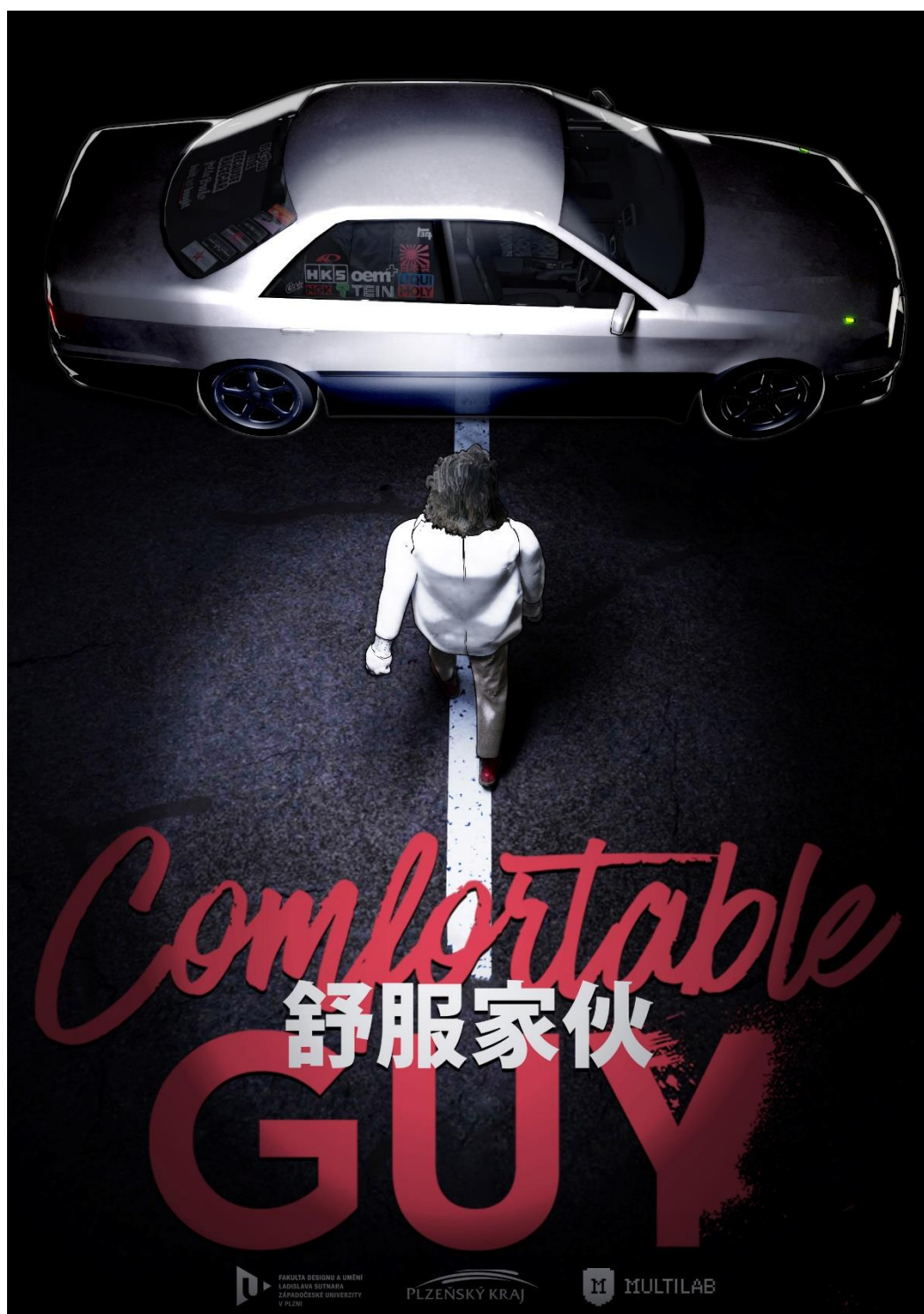
Příloha č.1 plakát Comfortable Guy