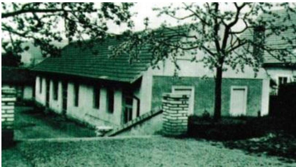
Příloha č. 5: Fotografie plaské sokolovny z 30. let 20. století.