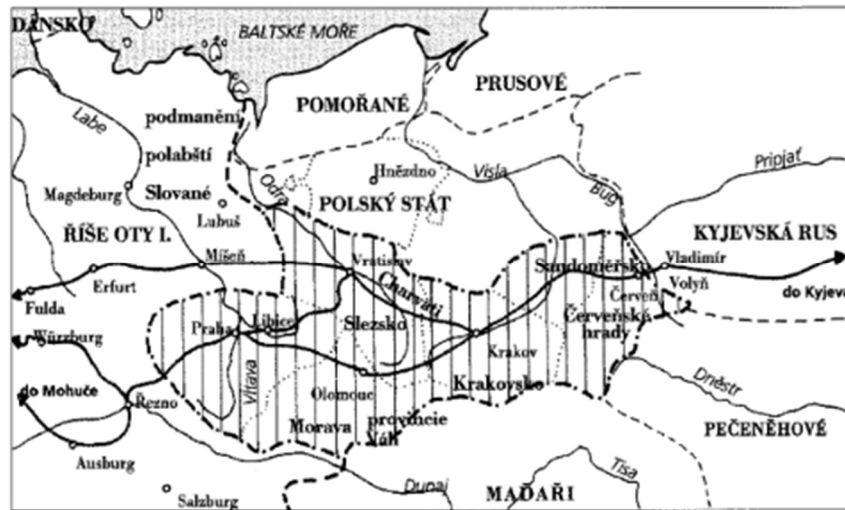
Rozsah „říše“ Boleslava I.