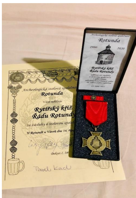
Obrázek 3.

14. října 2021. Tato tradiční setkávání zajišťují předávání hodnot a podporují soudržnost této specifické profesní skupiny. Je zde však nutno dodat, že zájem aktuálně studujících studentů není o pravidelné čtvrtletní setkávání moc velký. To je však jen důsledek toho, že oni studenti se scházejí často a pravidelně sami mezi sebou a se staršími se pak stýkají na významnějších setkáních.