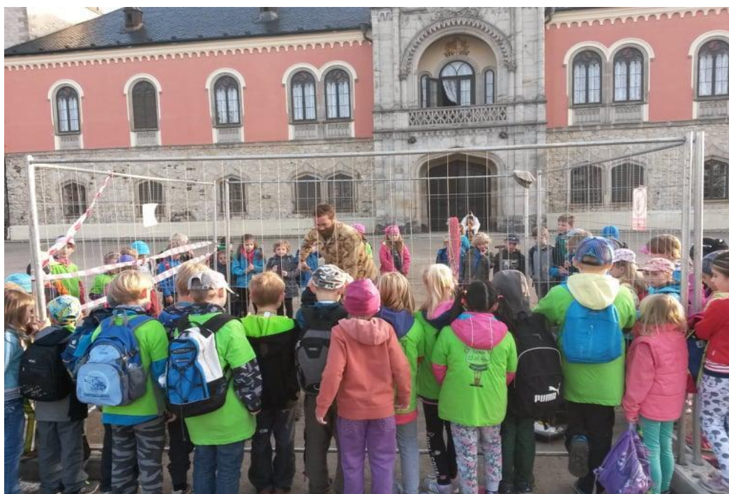
Obrázek 2. Foto Daniel Štochl, 2017

maminka s dětmi a pronesla větu. „Tak děti, když se nebudete učit, tak dopadnete takhle.“ Je však důležité zmínit, že představa veřejnosti o tom, jak má vypadat archeolog či archeologický terénní výzkum je vcelku zkreslená. S představou archeologa jako muže či ženy v bílé košili a se štětečkem je častěji potkáme ve filmech nežli na reálném terénním výzkumu. Také je nutno dodat, že v některých situacích není ono archeologické bádání zcela zjevné. Pro lepší představu takové nejasné situace je níže obrázek 1. Na fotografii, která byla pořízena právě po oné pronesené větě, vidíme archeologa, který je uvnitř takzvané klece a kolem něho jakýsi školní výlet.