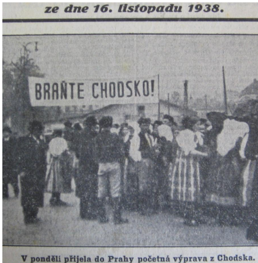
Obr. 3- Chodská protestní výprava v Praze. Archiv Muzea Chodska v Domažlicích, 2. světová válka.