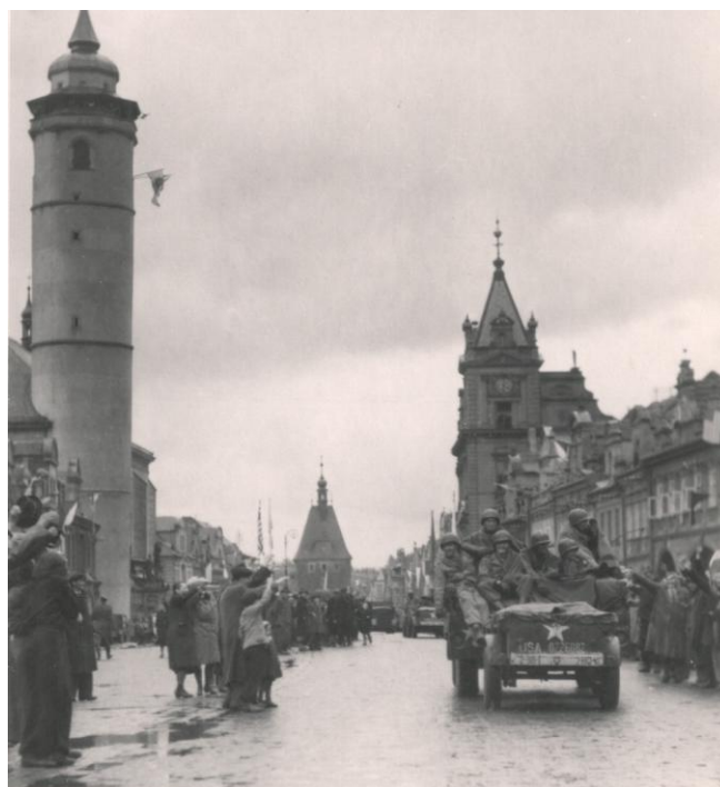
Obr. 13- Příjezd prvních amerických jednotek do Domažlic, vojáci přijíždějí směrem od Nevolic a míjejí Chodský hrad. Archiv Muzea Chodska v Domažlicích, 2. světová válka.