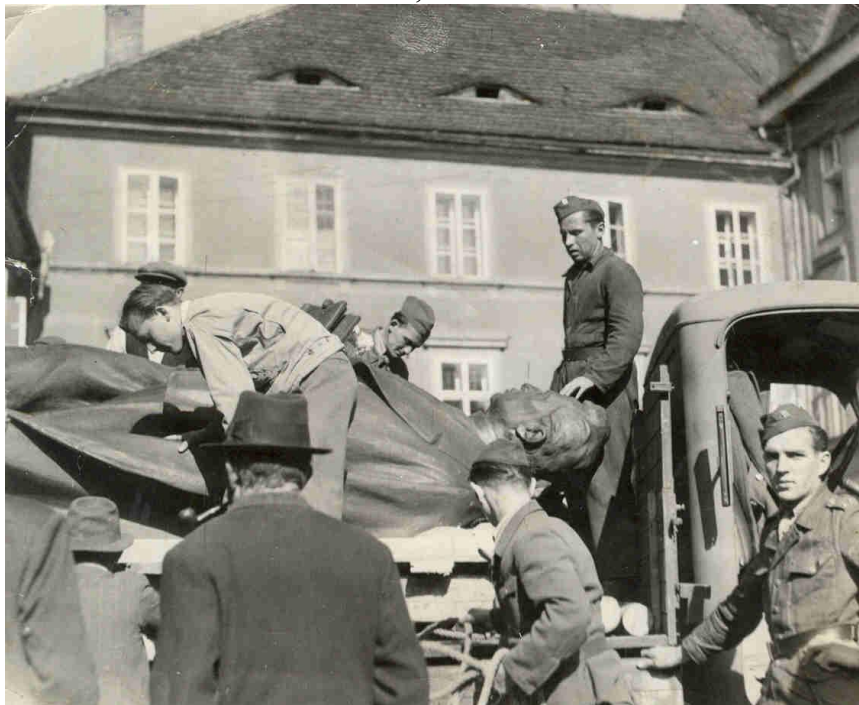
Obr. 2- Převoz sochy J. Š. Baara do domažlického muzea v Chodském hradě. Archiv Muzea Chodska v Domažlicích, 2. světová válka.