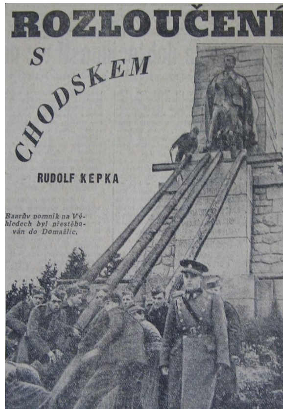
Obr. 1- Sťahování Baarovy sochy z pomníku na Výhledech. Archiv Muzea Chodska v Domažlicích, 2. světová válka.