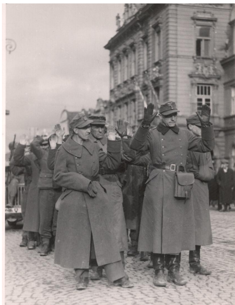
Obr. 12- Němečtí vojáci se vzdávají americké armádě. Archiv Muzea Chodska v Domažlicích, 2. světová válka.

http://www.geocaching.com/seek/cache_details.aspx?wp=GC1A9AV (3. 4. 2012 10:42)