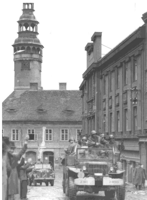
Obr. 13- Příjezd prvních amerických jednotek do Domažlic, vojáci přijíždějí směrem od Nevolic a míjejí Chodský hrad.