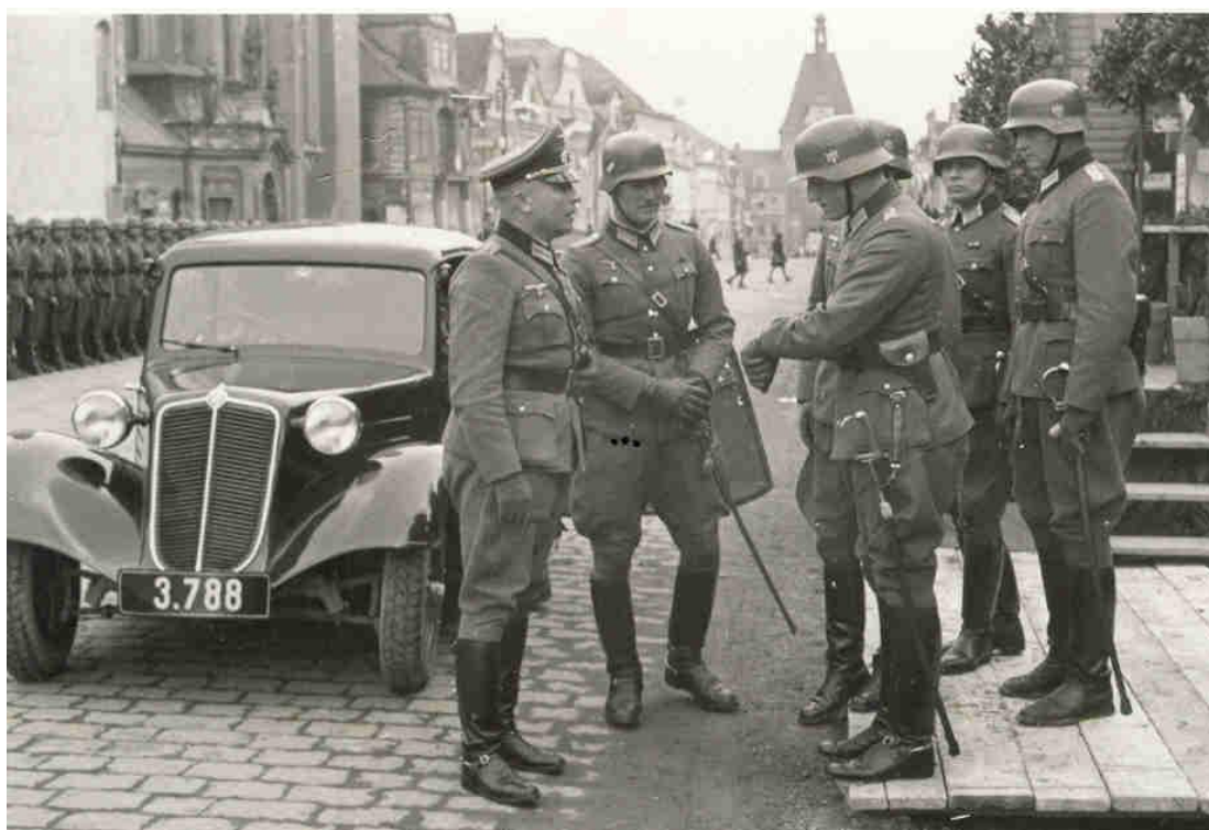
Obr. 7- Fotografie z německé vojenské přehlídky konané 29. 3. 1939 na domažlickém náměstí.