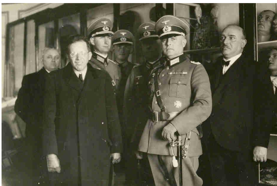
Obr. 8- Německá delegace při návštěvě Muzea v Domažlicích. Archiv Muzea Chodska v Domažlicích, 2. světová válka.