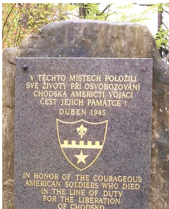
Obr. 9- Pomníček příslušníkům 90. US pěší divize na Výhledech nad Klenčím, kteří padli na přelomu dubna a května 1945 v bojích pod Čerchovem. http://lkz.wz.cz/pozvanka.php?a=vylet (1. 4. 2012 17:55)