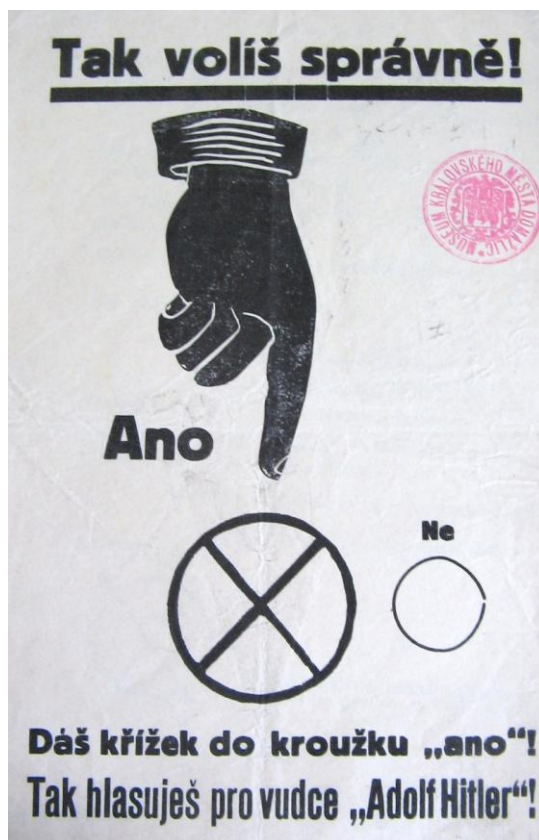
Obr. 5- Propagační volební materiál k volbám v zabraném Chodsku, pro „negramotné“ Čechy. 2. světová válka.