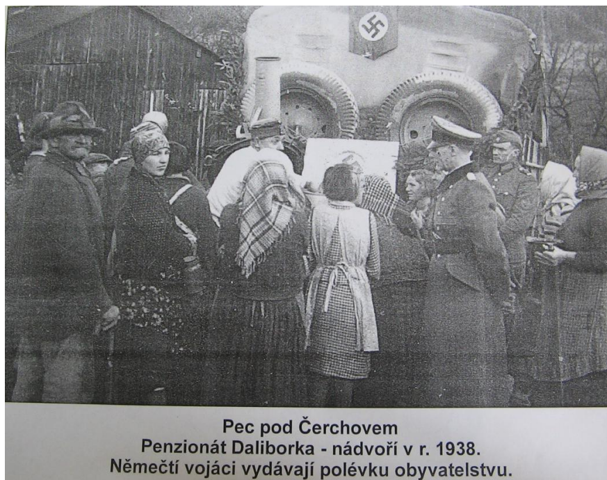
Obr. 4- Němečtí vojáci rozdávají polévku obyvatelstvu. Pec pod Čerchovem roku 1938. Archiv Muzea Chodska v Domažlicích, 2. světová válka.