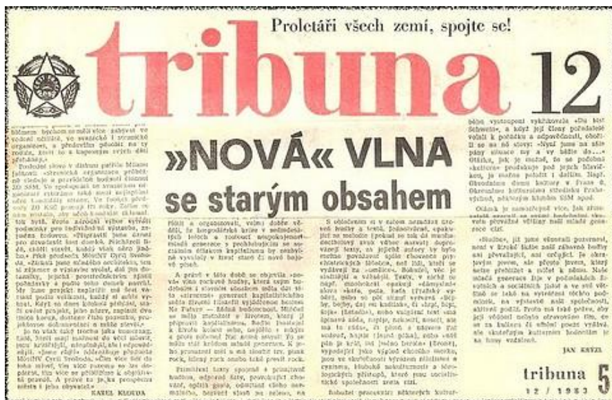
obr. č. 3 „Nová vlna se starým obsahem“ ( http://pnbo.webnode.cz/vintage/nova-vlna-se-starym-obsahem/ )

Celý text článku: (zdroj: http://www.ceskatelevize.cz/specialy/bigbit/clanky/188-nova-vlna-se-starym-obsahem/ )