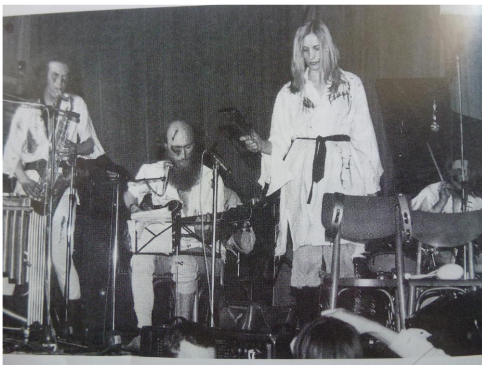
obr. č. 1 Skupina Extempore, 5. PJD