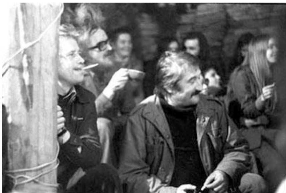
obr. č. 2 Plastic People of the Universe