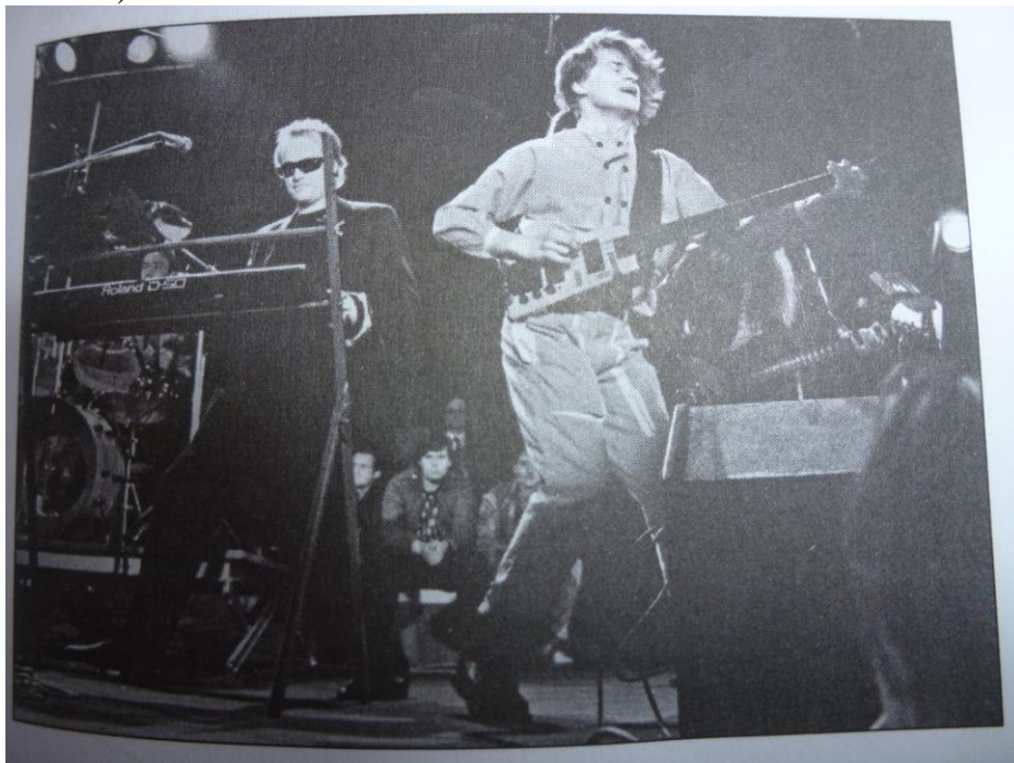
Obr. č. 5 Pražský výběr