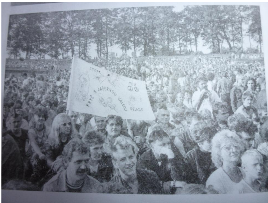
Obr. č. 9 Diváci Mírového koncertu v Plzni na Lochotíně

(obr. č. 9,10, zdroj: VANĚK, Miroslav: Ostrůvky svobody: Kulturní a občanské aktivity mladé generace v 80. letech v Československu . Praha: ÚSD AV ČR – Votobia 2002, 350 s. ISBN 80-7285-016-4.)