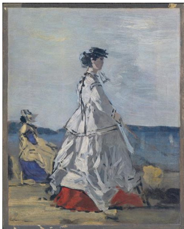
2) Pauline Metternich, autor: Eugène Boudin.