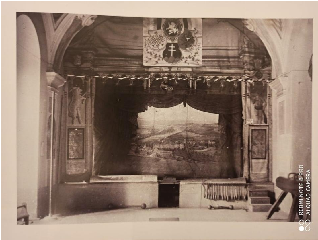
7) Divadelní opona konventního divadla, vlastní fotografie.