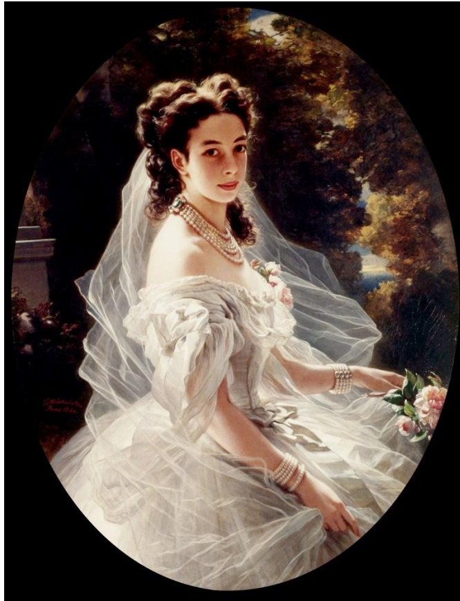
3) Pauline Metternich, autor: Franz Xaver Winterhalter.